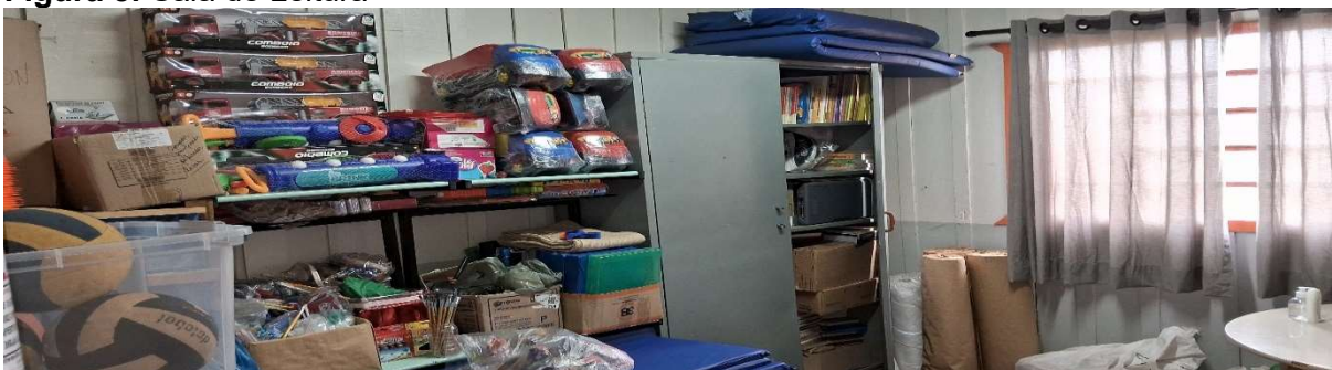
Figura 8: Sala de Leitura