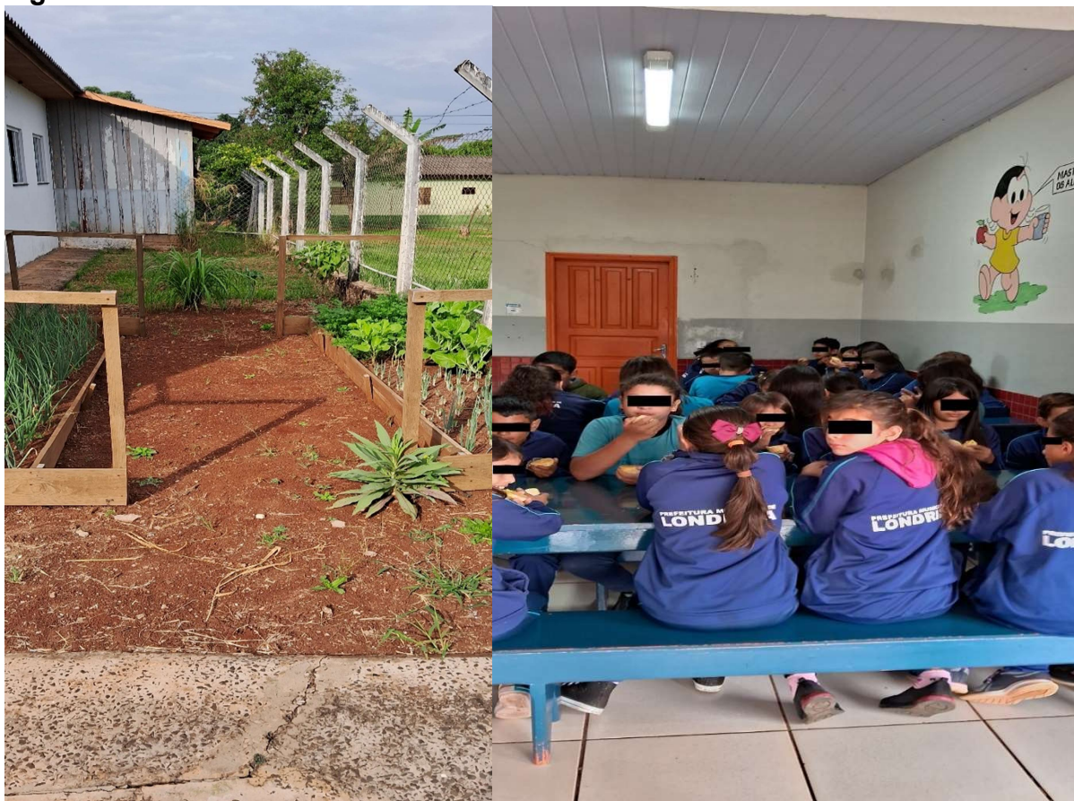
Figura 5: Horta e refeitório