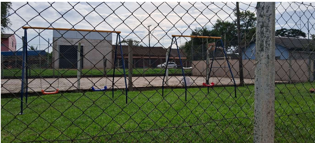
Figura 4: Quadra de esportes