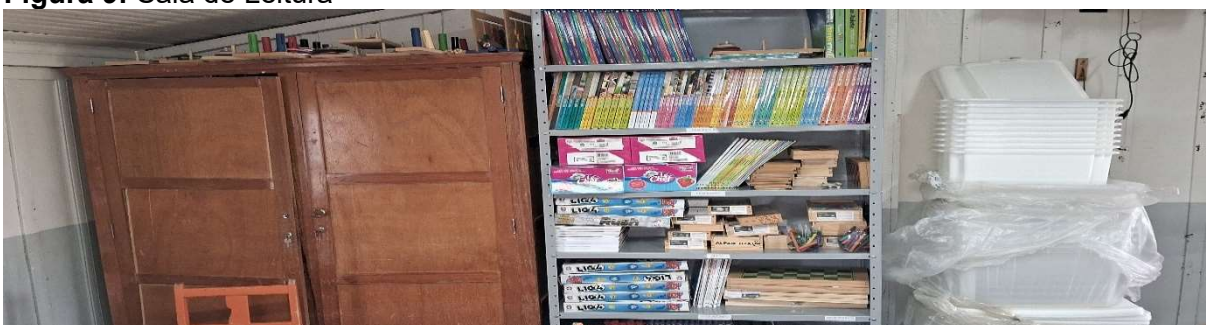
Figura 9: Sala de Leitura