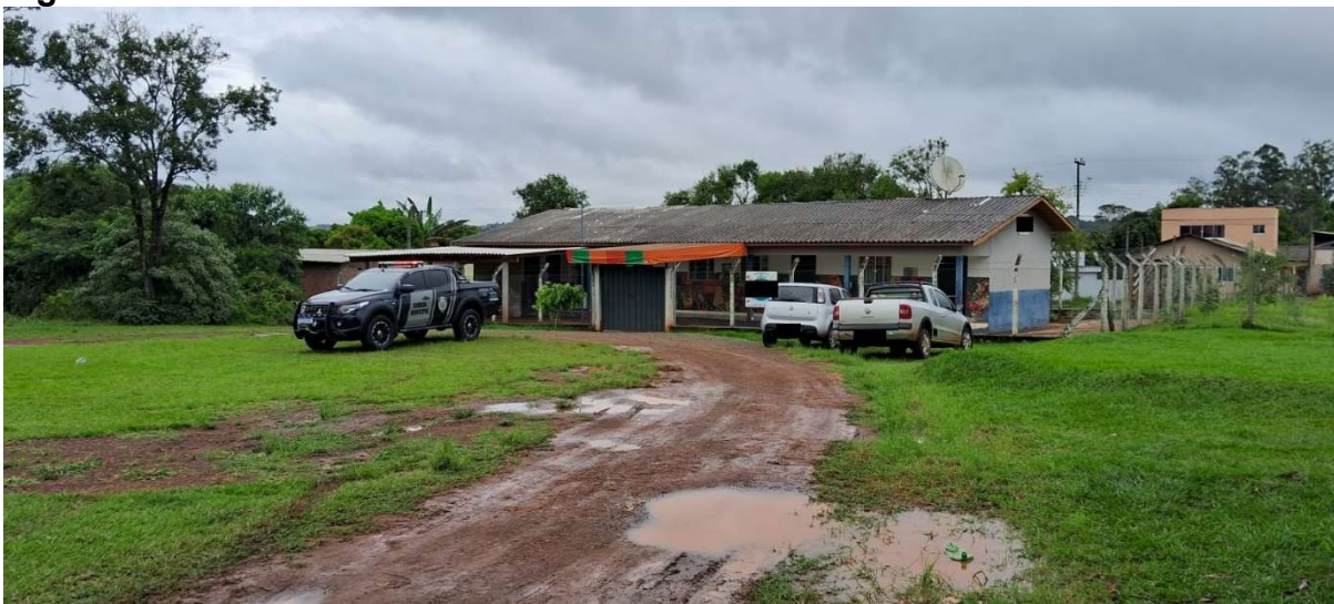
Figura 1: Frente da escola