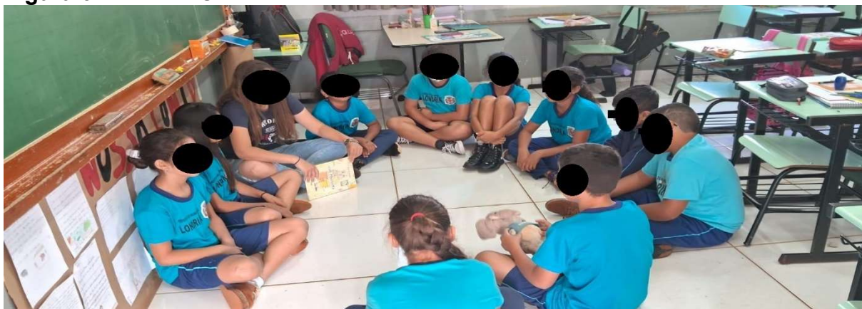
Figura 6: Roda de Conversa