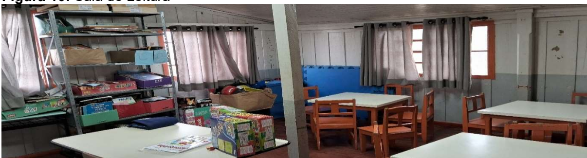
Figura 10: Sala de Leitura