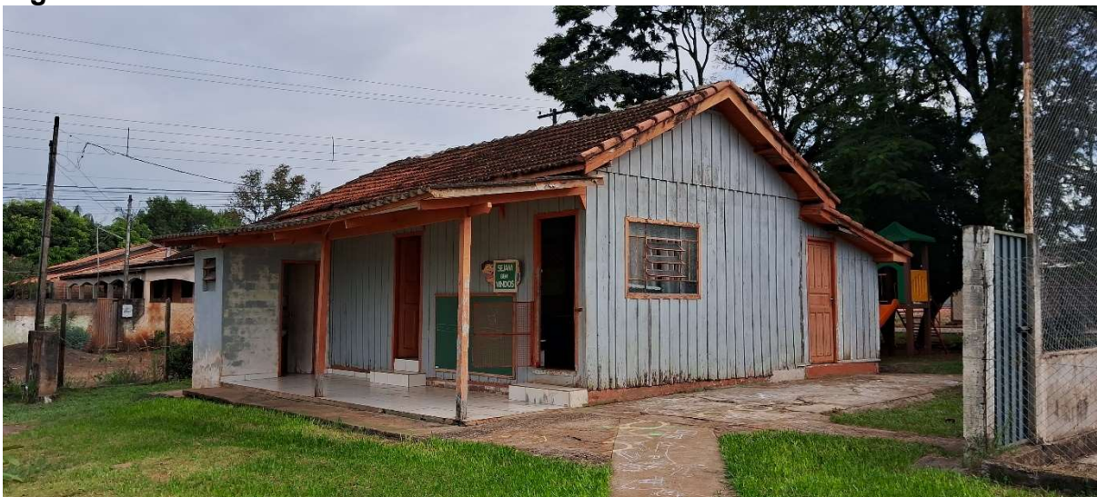
Figura 3: Sala de aula anexa