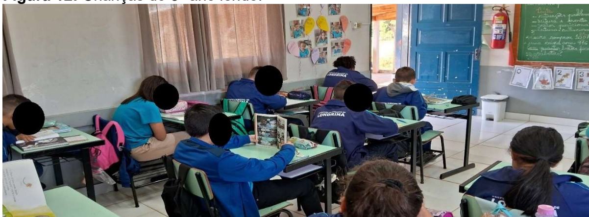
Figura 12: Crianças do 5º ano lendo.