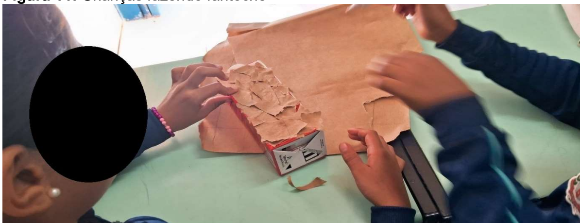
Figura 11: Crianças fazendo fantoche