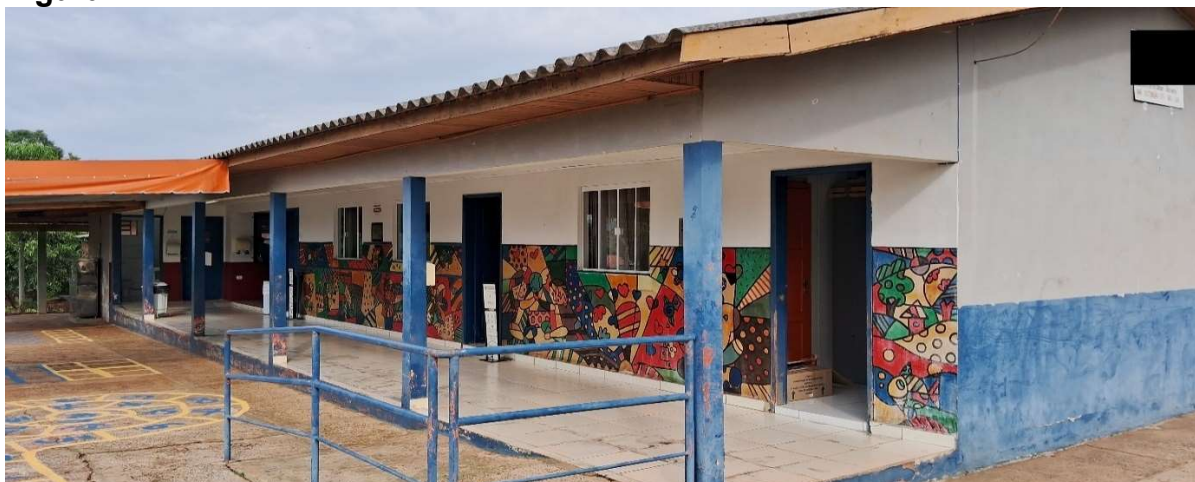
Figura 2: Pátio da escola