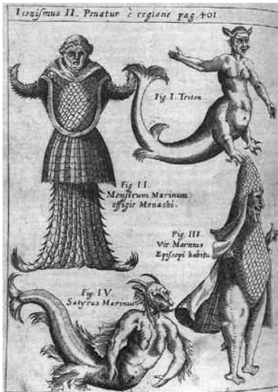
Caspar Schott, página de Physica curiosa , 1662, Würzburg, Endter.