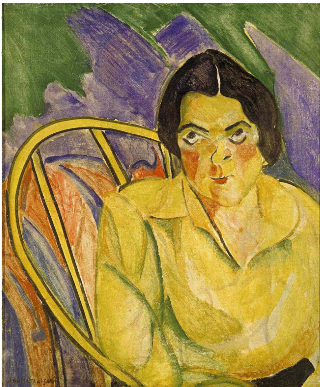
Anita Malfatti, A boba , 1915, Museu de Arte Contemporânea da Universidade de São Paulo.