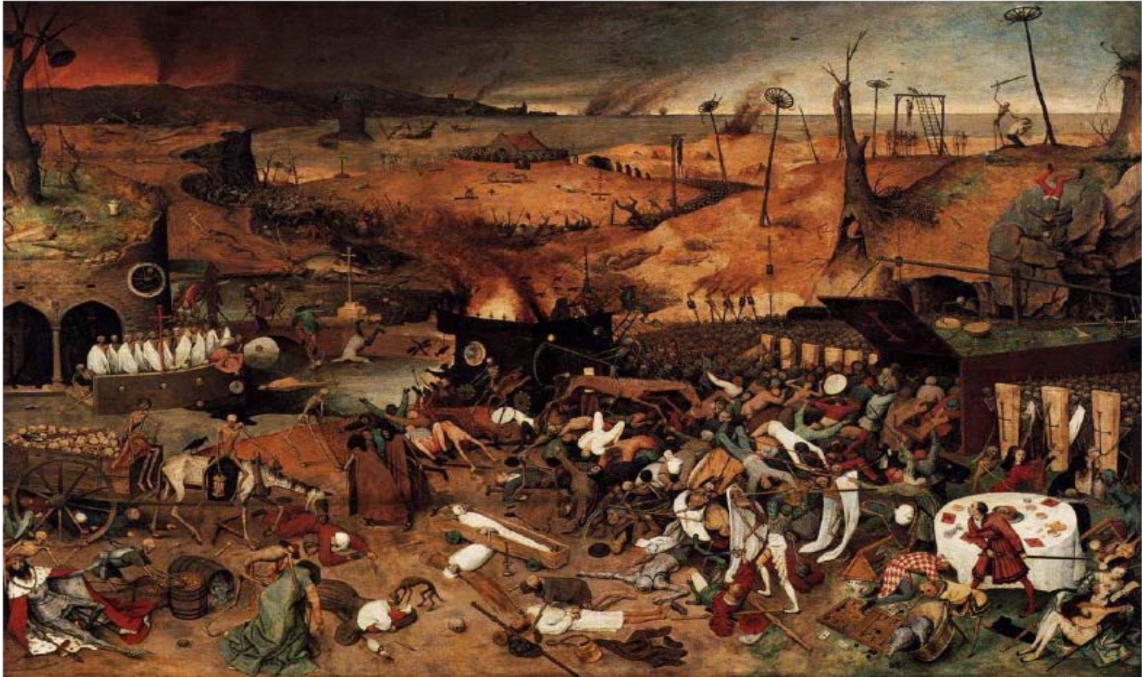
Pieter Bruegel, o Velho, O triunfo da morte , 1562, Museo del Prado, Madrid.