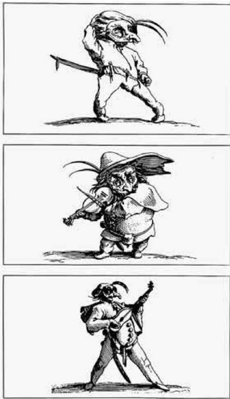
Jacques Callot, Varie figure gobbi , 1616.