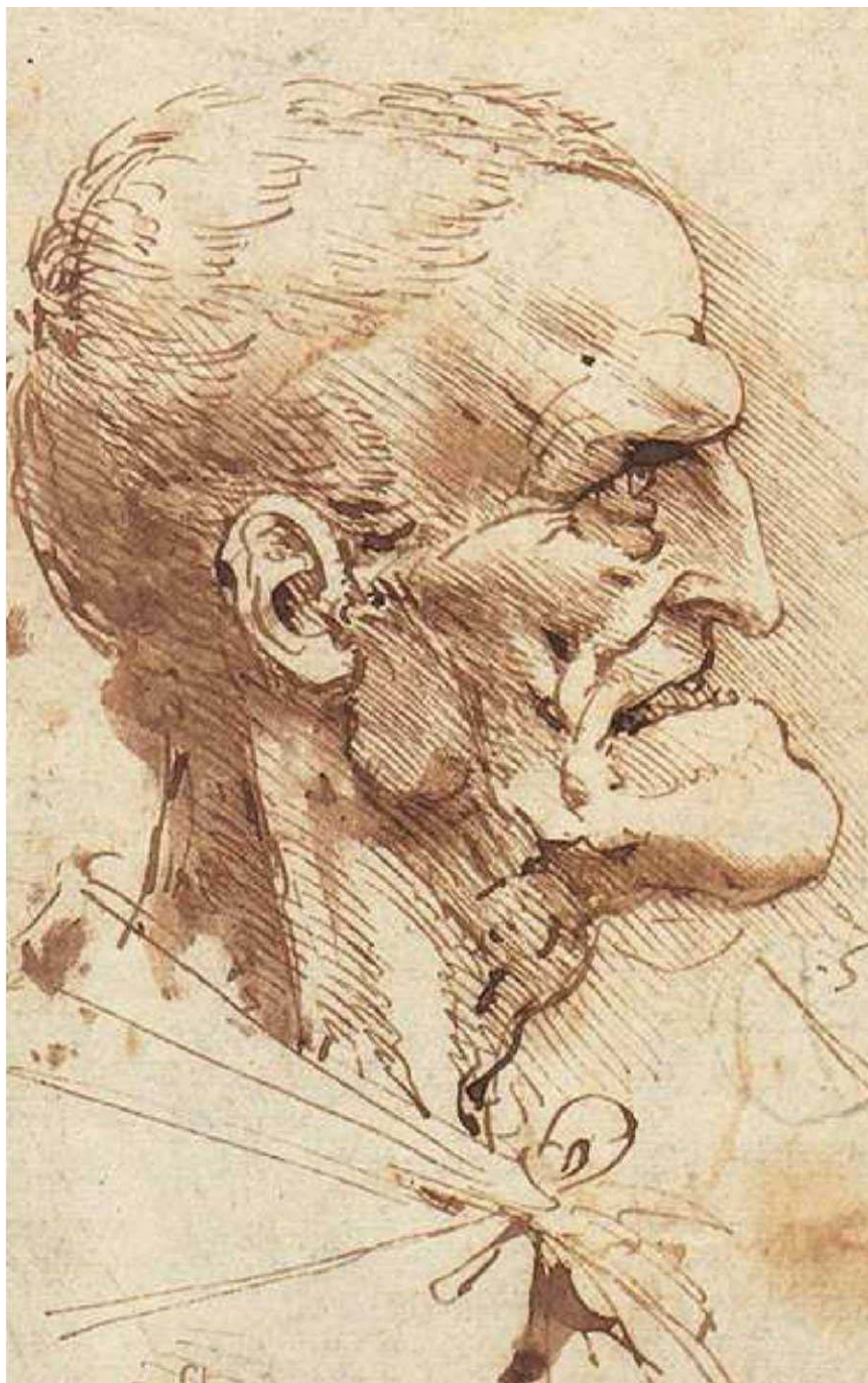
Leonardo da Vinci, Confronto de dois perfis grotescos (detalhe), 1485-1490, Hamburgo, Kunsthalle.