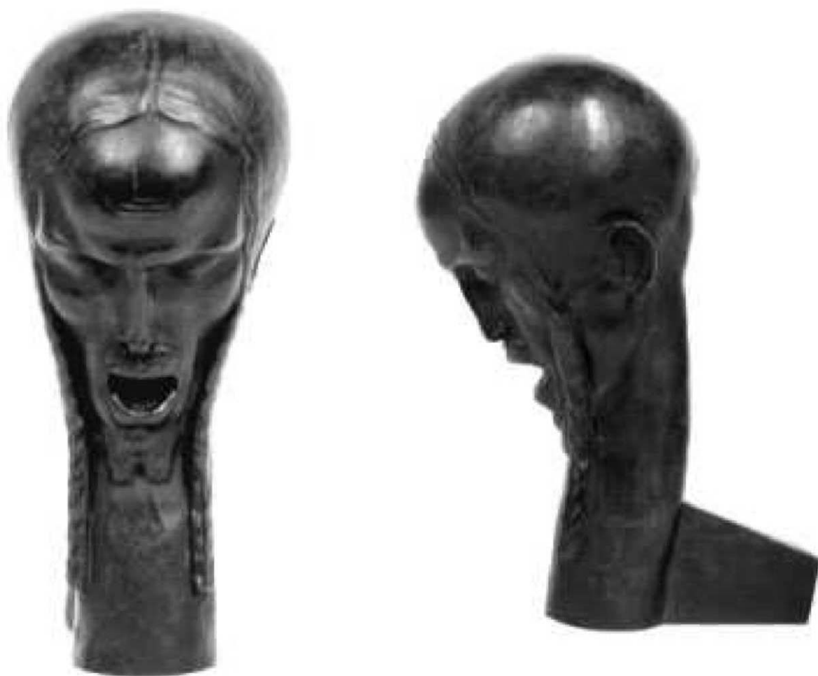
Victor Brecheret, Cabeira de Cristo , 1920, Coleção IEB - USP.