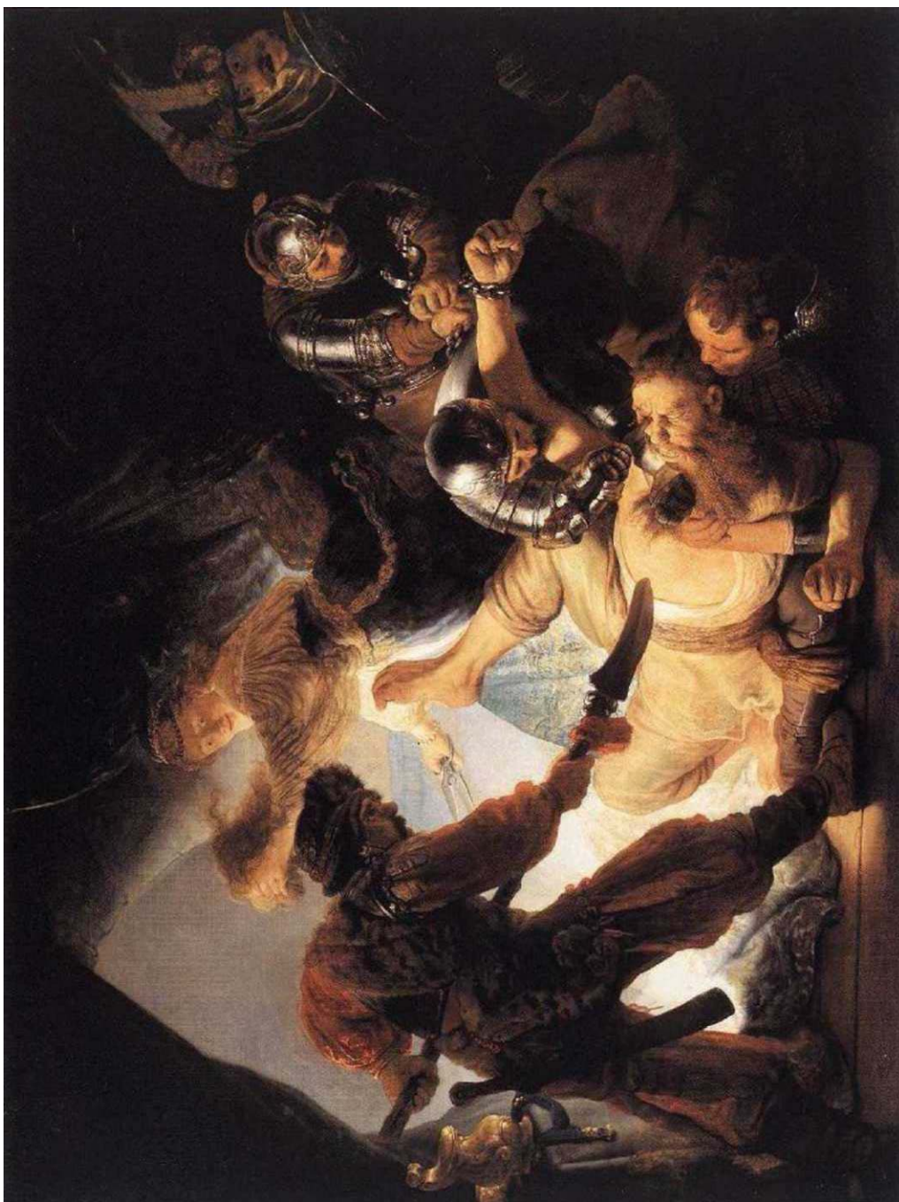
Rembrandt van Rijn A captura de Sansão , 1636 Stádelsches Kunstinstitut, Frankfurt