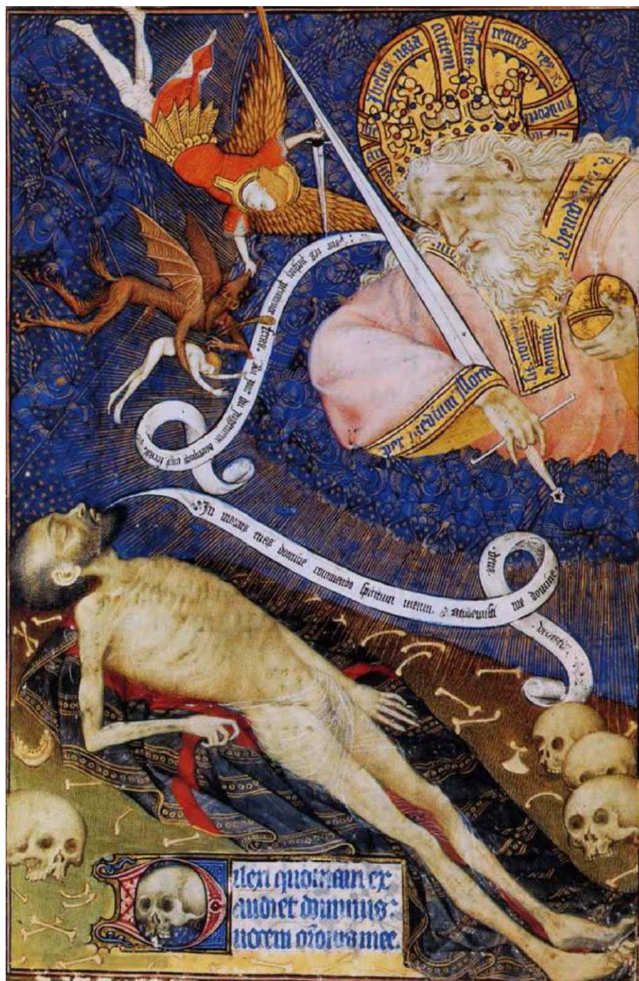
Mestre das horas de Rohan, O morto ante seu Juiz , 1418 – 1425