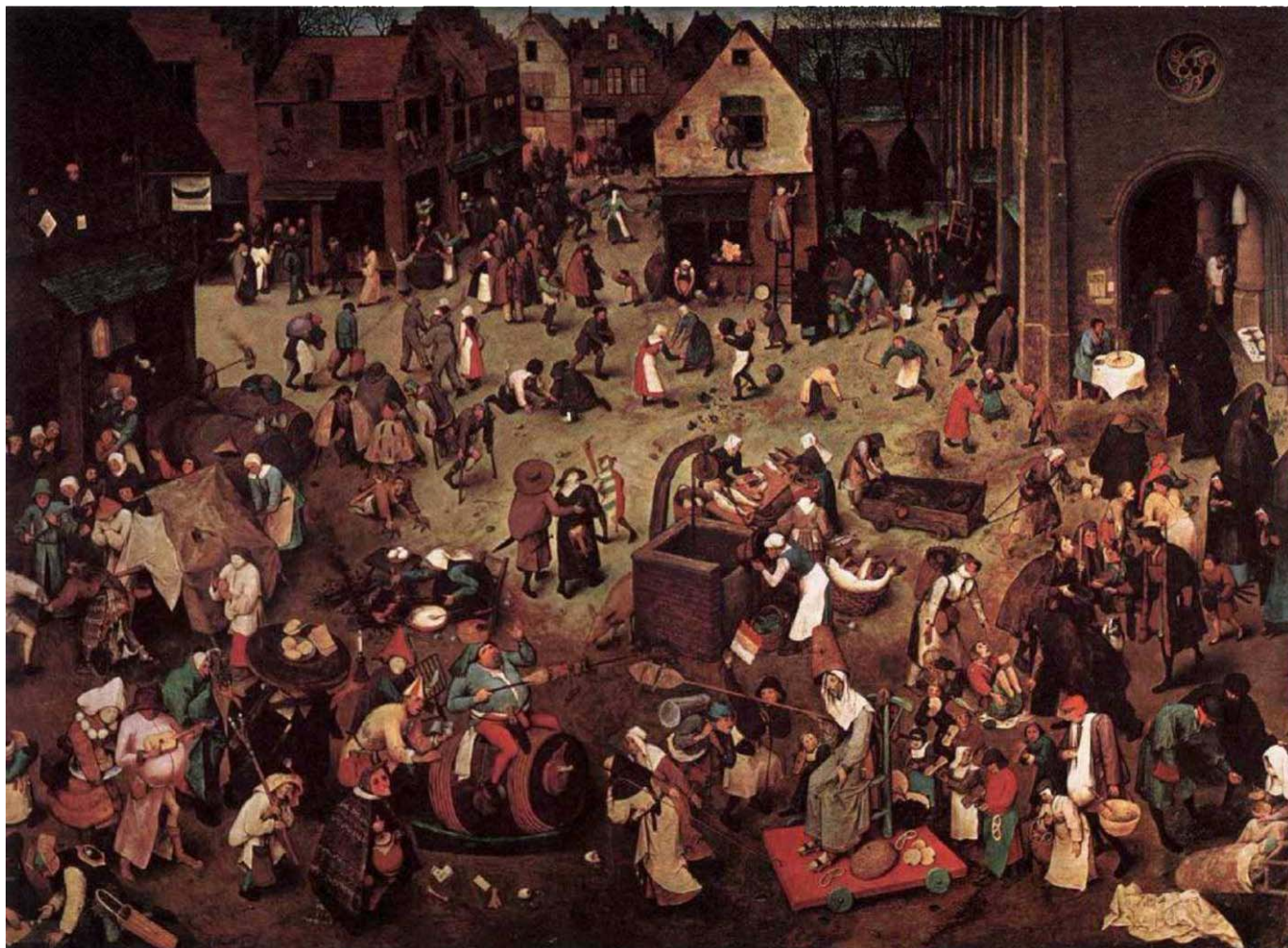
Pieter Bruegel, o Velho, O combate do Carnaval e da Quaresma , 1559, Kunsthistorisches Museum, Vienna.