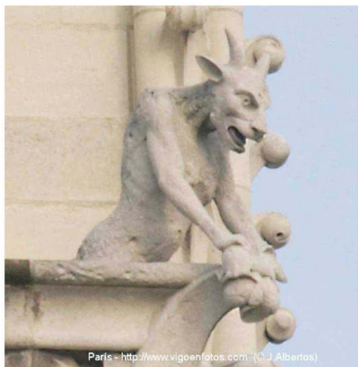
Gárgulas da Catedral de Notre Dame, Paris