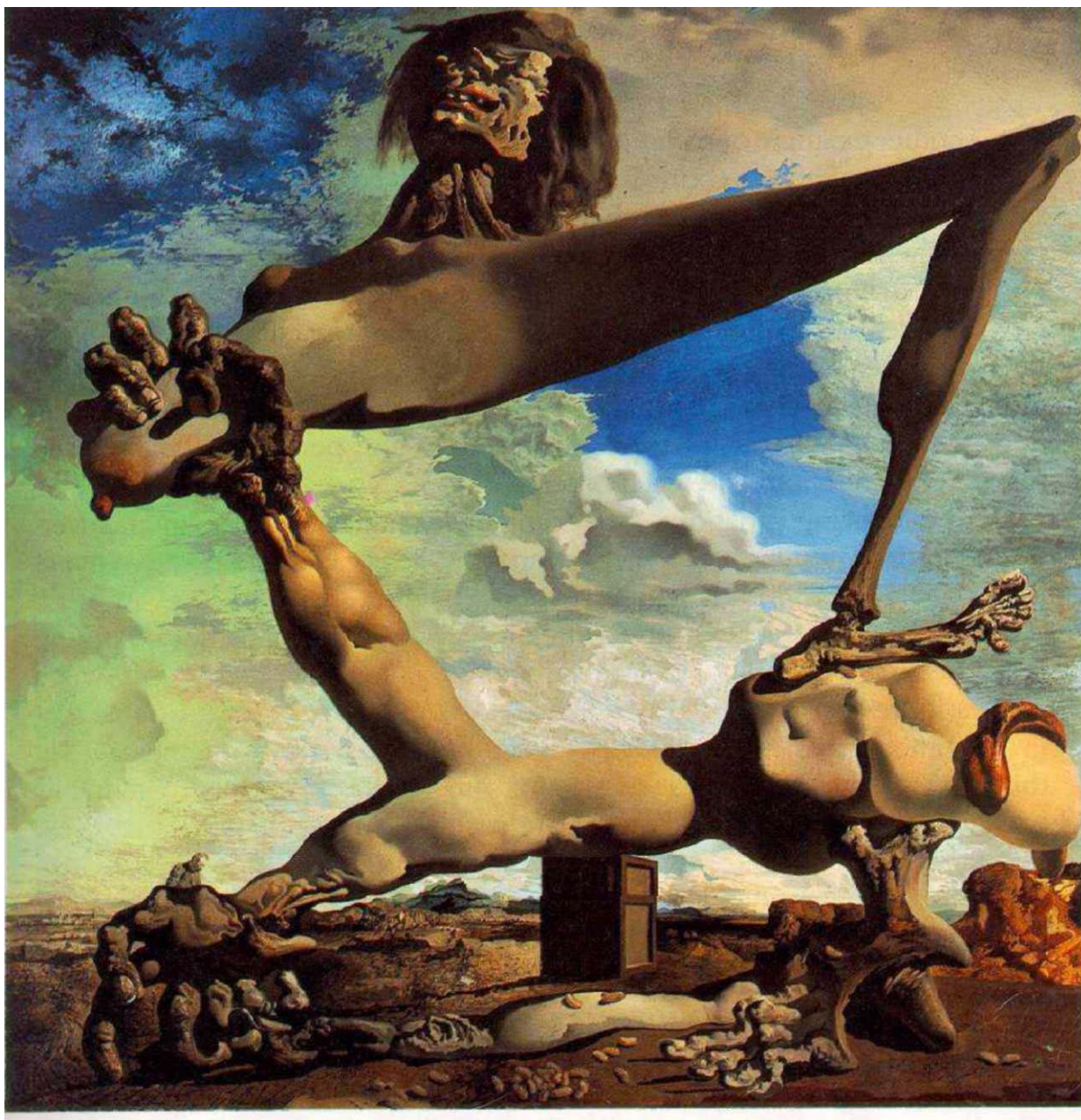
Salvador Dalí, Construção mole com feijões cozidos. Premonição da guerra civil , 1936, Philadelphia Museum of Art, Philadelphia.