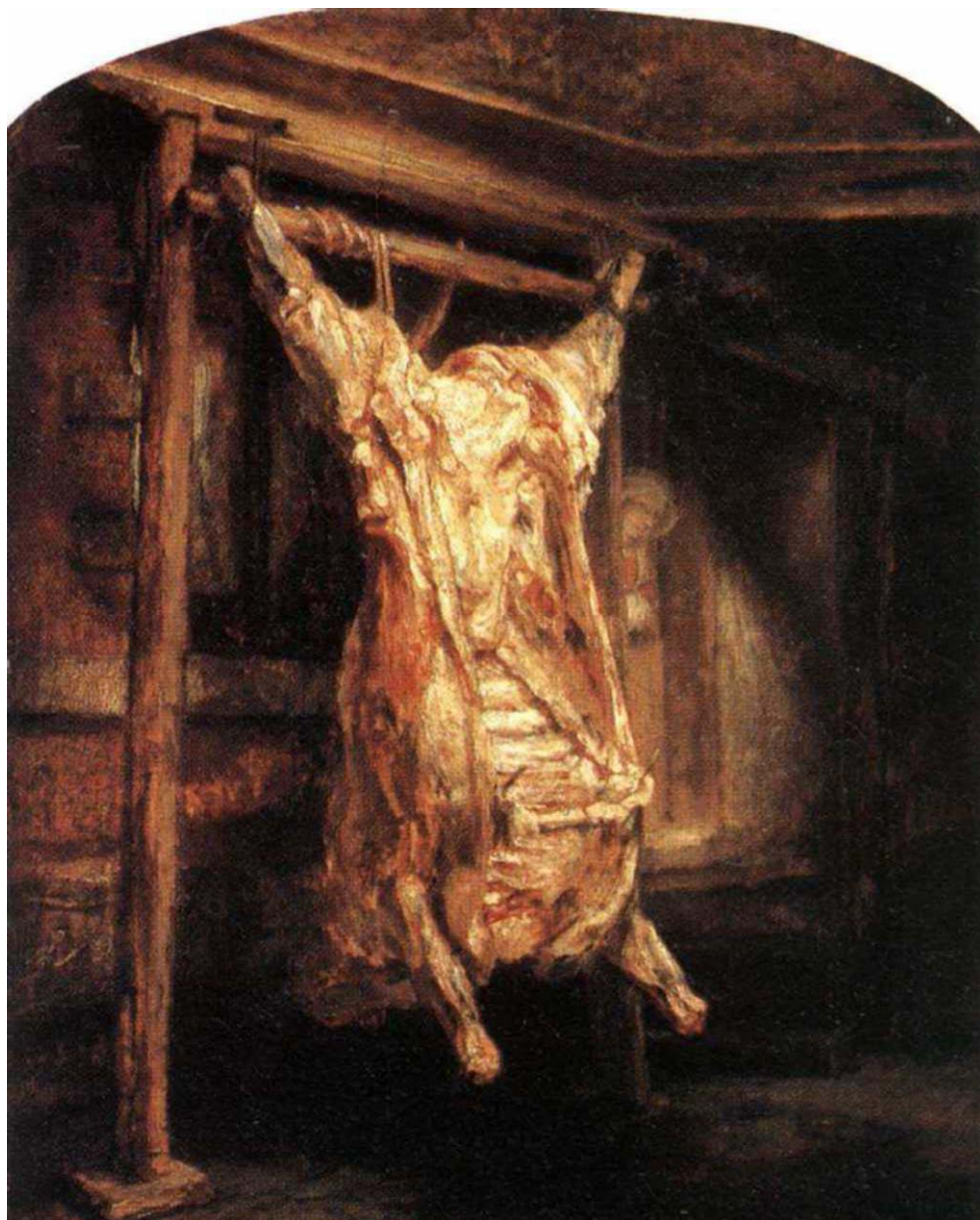
Rembrandt van Rijn O boi esquartejado , 1655 Musée du Louvre, Paris