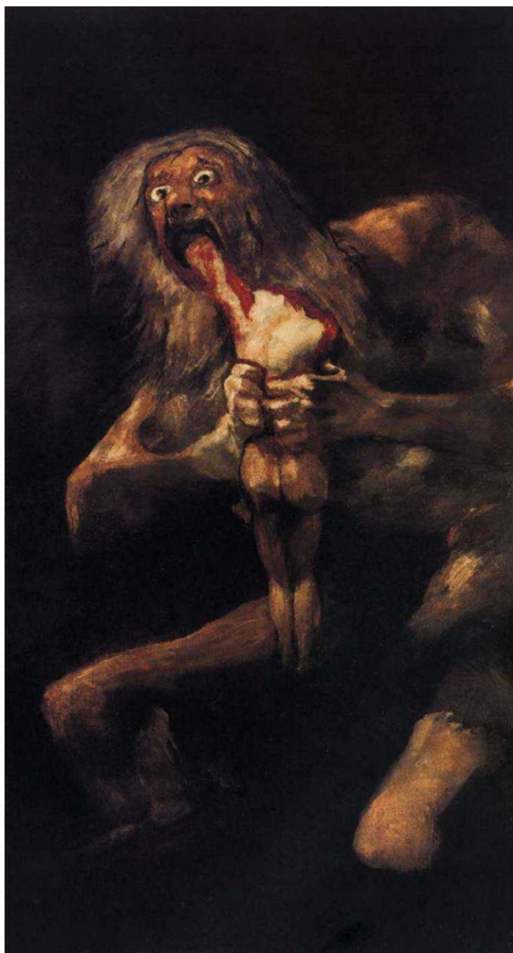
Goya Saturno devorando um filho Museo del Prado, Madrid