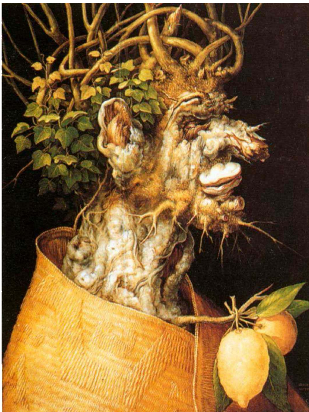
Giuseppe Arcimboldo, Inverno , 1563, Kunsthistorisches Museum, Vienna.