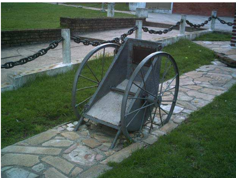
Ilustração 8 – Monumento na Praça Central do Bairro Três de Abril

aposentados e na faixa dos 70 anos de idade.