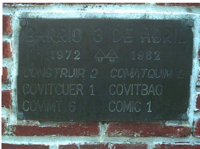
Ilustração 9 – Placa na Praça Central do Bairro Três de Abril