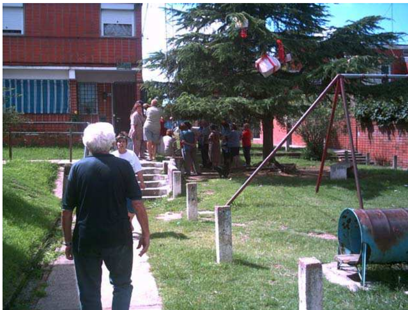
Ilustração 10 – Solidariedade com uma vizinha acidentada em Bairro Três de Abril

Na realidade, os novos são os outros , os que não são desse universo de referência; os de fora , que “invadem” o bairro cooperativo. Acontece que dentro do bairro cooperativo a diferença ideológica entre o grupo fundador e os novos é maior que em outros bairros porque os que participaram no processo de luta e construção da casa experimentaram graus elevados de consciência de classe e de desenvolvimento de valores alternativos aos dominantes como, por exemplo, a solidariedade. A ilustração 10 mostra a solidariedade com uma moradora acidentada no bairro Três de Abril: