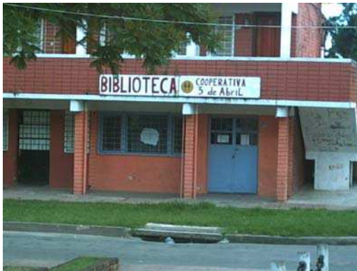
Ilustração 4 – Bairro 3 de Abril: biblioteca