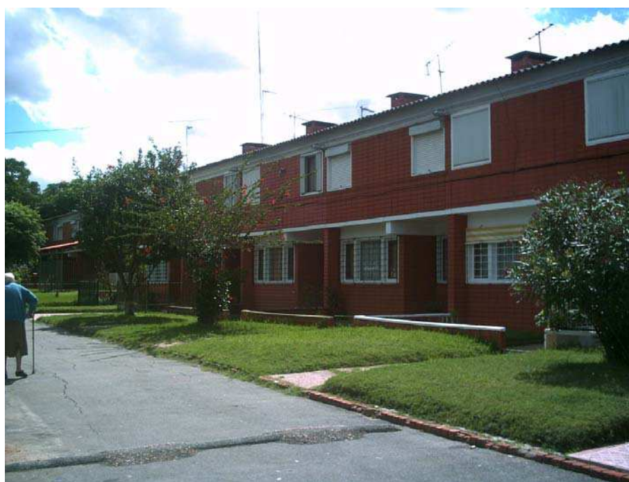
Ilustração 2 – Casas do Bairro 3 de Abril

Esta crítica não se aplica ao tipo de construção feita pela FUCVAM, porque nesse processo sempre participa pessoal técnico contratado e os materiais, em geral, são superiores aos utilizados pelo governo nos seus planos de habitação. Na visita que realizamos ao Bairro 3 de Abril, em janeiro de 2006, constatamos o excelente estado de conservação das casas que já estão com mais de 30 anos. Pode-se observar na ilustração 2 que o material utilizado nas construções do Bairro 3 de abril é de boa qualidade: