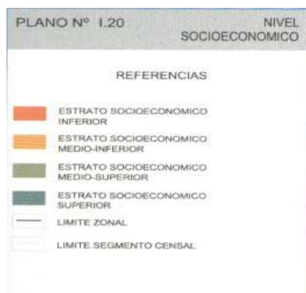
Ilustração 7 – Mapa de Montevideú

Ao cruzar esse mapeamento com os dados fornecidos pelo representante da FUCVAM, Darío Rodriguez, elaboramos o seguinte quadro: