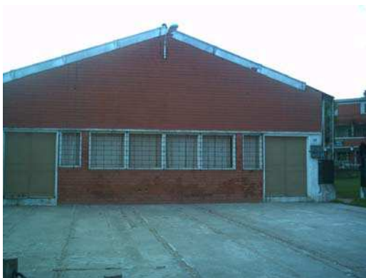
Ilustração 5 – B. 3 de Abril: salão comunitário