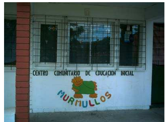
Ilustração 6 – Bairro 3 de Abril: creche