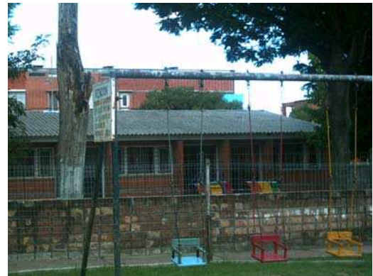
Ilustração 3 – Bairro 3 de Abril: escola