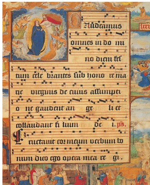
Figura 2 – Escrita quadrada