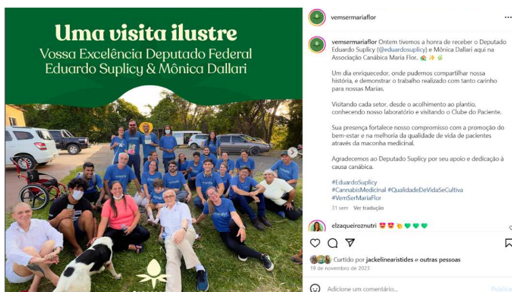
Figura 2: Post divulgando a visita do Deputado Federal Eduardo Suplicy