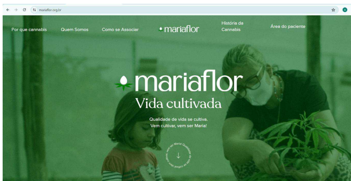
Figura 1: Template do site da Associação Canábica Maria Flor

Fonte: Página da Associação Canábica Maria Flor 16