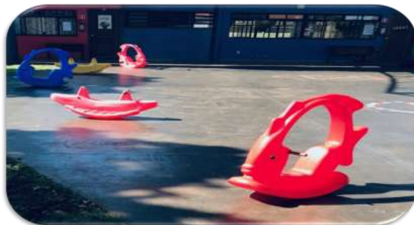
Figura 4: Playground Escola Infantil A

Ainda analisando o espaço externo, conforme podemos perceber com a Figura 4, localizada na quadra de esportes da escola, aonde possui alguns brinquedos de balançar, com formadores diversos conforme podemos analisar na Figura, formato de peixes, jacarés e cavalinhos.