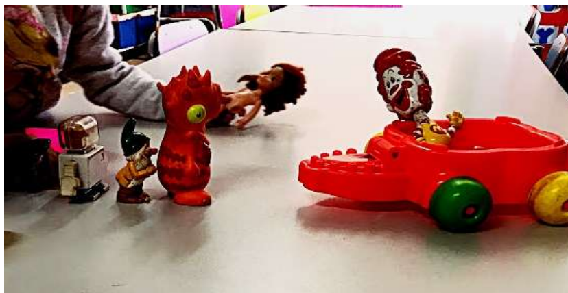
Figura 25- Brinquedos e Jogos Proporcionados Escola Infantil B

Outro detalhe em relação à escola A e B é que ambas oferecem aos alunos diversos brinquedos. Porém, quando analisamos pelo viés da Teoria Crítica, notamos algumas influências entre elas conforme as Figuras 25, 26, 27 e 28. Dentre estes brinquedos estão: pecinhas de Lego, de encaixar, bonecas, pecinhas de ferramentas, carrinhos de flexão, Barbie , acessórios de bonecas – espelho, roupas, pente, alguns bonecos de textura rígida e de textura macia, brinquedos brindes do McDonald's etc.