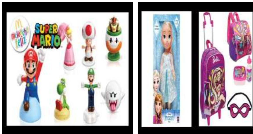
Figura 30- Brinquedos e Jogos Proporcionados Aplicação da Oficina