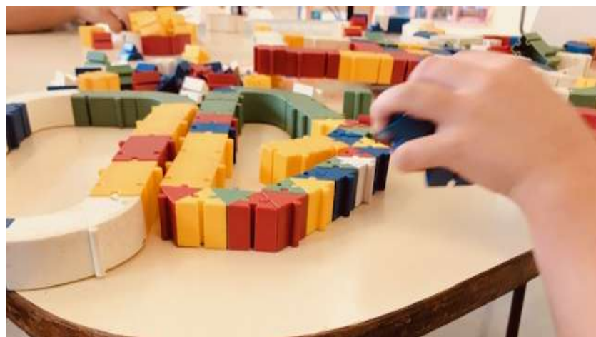
Figura 8- Brinquedos e Jogos Proporcionados

Outro aspecto relevante a se destacar que foi observado, refere-se à elaboração dos planos de aula e das atividades a serem pensadas e organizadas. Nota-se que para as professoras conseguirem dar conta de tudo o que é solicitado, como planejar novas atividades, corrigir trabalhos, etc, em alguns momentos, elas apresentavam atividades com jogos de encaixe, podemos analisar com a Figura 8 um exemplo de jogo de encaixe.