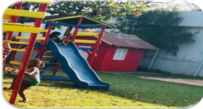
Figura 3: Playground Escola Infantil A

No que se refere as Figura 3, nota-se que a mesma casinha das figuras anteriores é bem grande, pois do seu outro lado, possui também mais um escorregador, e uma escada para as crianças subirem, que dá acesso a mesma casinha.