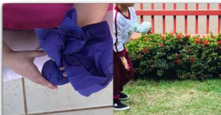
Figura 24- Confeção de Brinquedos: Peteca

brincadeira da peteca, a professora se dirigia até elas e tentava ensiná-las, a ação da professora foi, de fato, muito importante, porém, como mostram as Figuras, as crianças ficaram paradas com o seu brinquedo construído enquanto olhavam a que estava na vez de brincar, Segue, na Figura 24, alguns destes momentos.