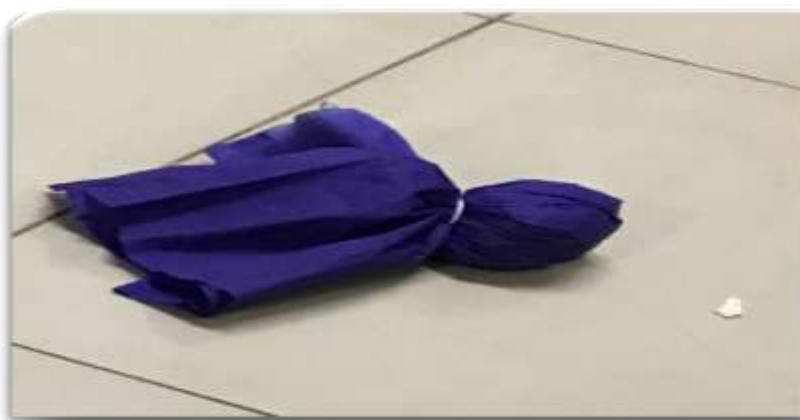
Figura 22- Confeção de Brinquedos: Peteca

Então, a professora distribuiu o jornal e ajudou as crianças a amassarem até fazer o formato de uma bola redonda. A professora regente passou em todas as mesas para ajudar as crianças no processo. Por último, colocou papel crepom nas cores roxa e verde claro, para fazer a confecção completa da peteca, conforme a Figura 22.