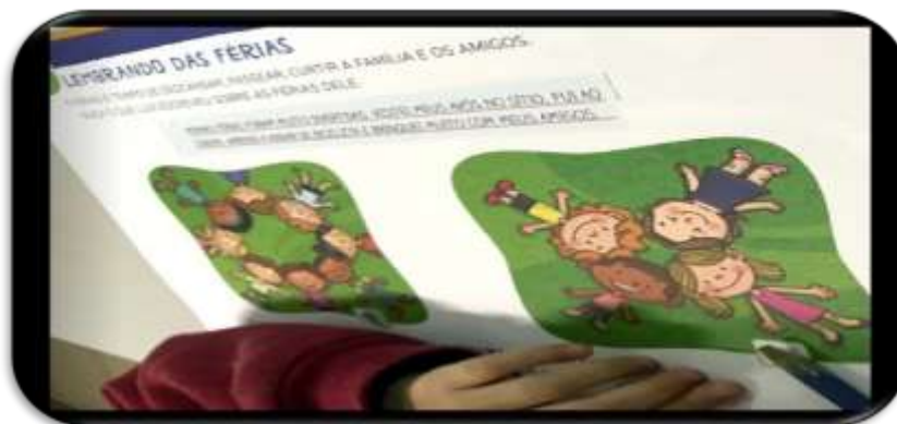
Figura 21- Apostila Escola Infantil B

Percebe-se nas Figuras 20 e 21 o quanto a apostila ainda existe nas escolas de Educação Infantil e como cada atividade desenvolve o modelo tradicional de educação, impossibilitando qualquer tipo de aprendizagem significativa, seguindo apenas um modelo, que segue um padrão de reprodução.