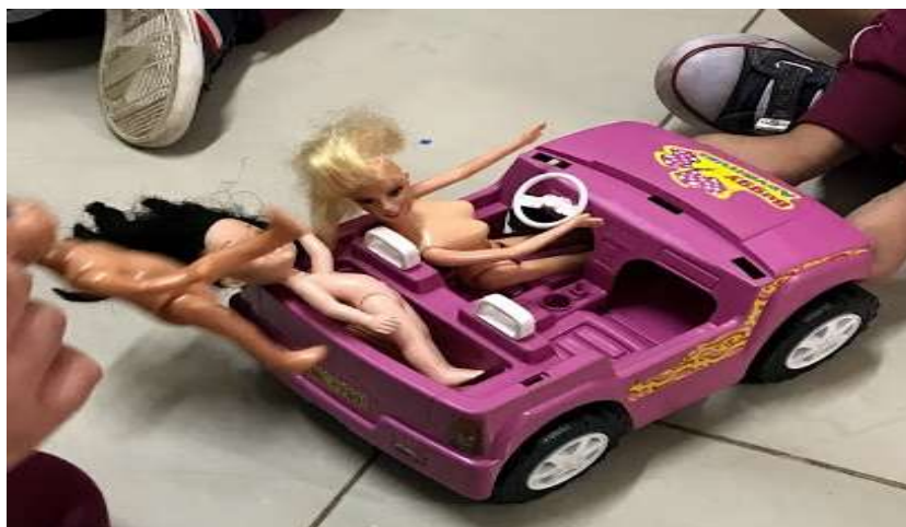
Figura 27- Brinquedos e Jogos Proporcionados Escola Infantil B

Ou seja, quanto mais aumentam as oportunidades de prazeres, mais surgem novas necessidades; a satisfação nunca é alcançada em sua plenitude. As crianças, tão novas, já sofrem com tais frustrações de insatisfação. Compra-se um brinquedo, brinca com ele por poucos instantes e já o abandona. Quando a mídia, junto ao marketing infantil, anuncia o novo brinquedo do momento, impõe uma nova necessidade na criança que, conforme a Figura 29, mostra um dos brinquedos mais consumidos pelas meninas: a Barbie e seus acessórios.