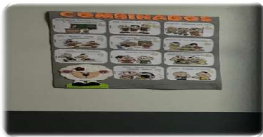
Figura 18- Cartazes Escola Infantil B

Posteriormente, as crianças precisam ler também os combinados da semana, conforme Figura 18. Em seguida, os números, dias da semana, como está o tempo e, só depois, inicia-se a aula, revelando a temática que irão trabalhar.