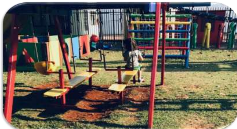
Figura 2: Playground Escola Infantil A

Assim como a Figura 1 e 2, é notório o quanto a escola possui um espaço externo de playground espaçoso para as crianças brincarem, com brinquedos de diversas cores, tamanhos, e tipos de atividades, possui também duas gangorras localizadas na casinha, há também um labirinto em formato das figuras geométricas, escorregadores, e um balanço.