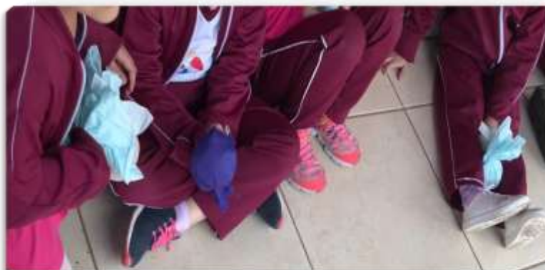
Figura 23- Confeção de Brinquedos: Peteca

Nota-se, que as crianças tiveram um pouco de dificuldade no processo de manipular o papel crepom e amassar o jornal para a manufatura da peteca. Porém, a todo momento, a professora mediava para que elas conseguissem fazer o objeto. As crianças ficavam contentes quando começava a dar certo e animadas para ver como ficaria o brinquedo.