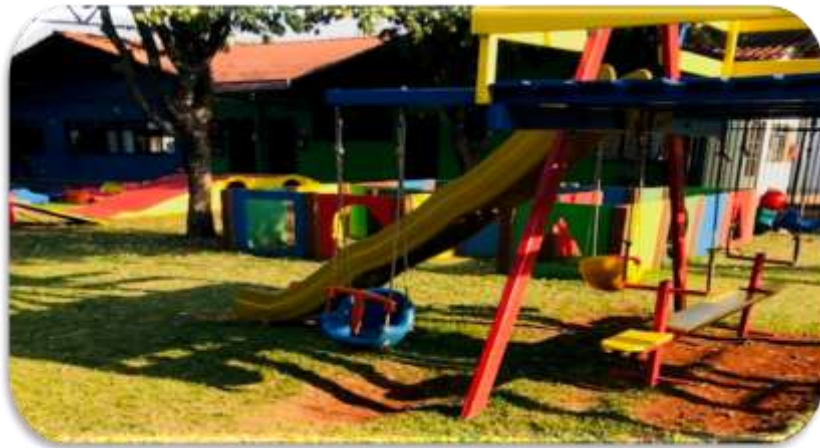
Figura 1: Playground Escola Infantil A

Na área externa como analisar com as Figuras 1,2,3 e 4, há um pátio em estilo quadra com cobertura, que está ligado ao prédio perto dos solários para o berçário 1 e 2. Indo ao pátio, há um playground com área gramada, onde existe uma estrutura de madeira em formato de uma casa (casinha) onde, abriga diversos brinquedos conforme as Figuras a seguir: