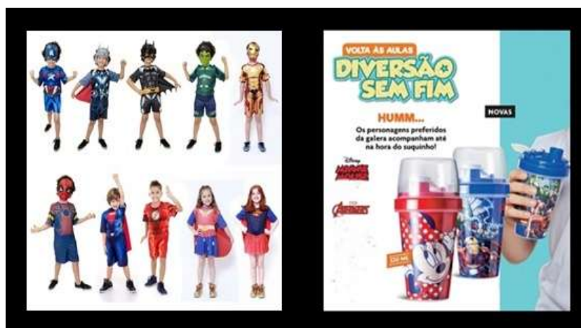
Figura 31- Brinquedos e Jogos Proporcionados Aplicação da Oficina

Entende-se então que no cenário tecnológico proporcionado as crianças estão a todo momento cercada de fetiches e clichês lúdicos que a seduzem cotidianamente para o brinquedo, para a marca e para as animações lúdicas, e principalmente para o consumo, conforme Figura 31, foi explicado o quanto a mídia e a indústria cultural de brinquedos tecnológicos influenciam a criança de todas as maneiras, infelizmente presenciamos a ausência de um brincar criativo e lúdico.