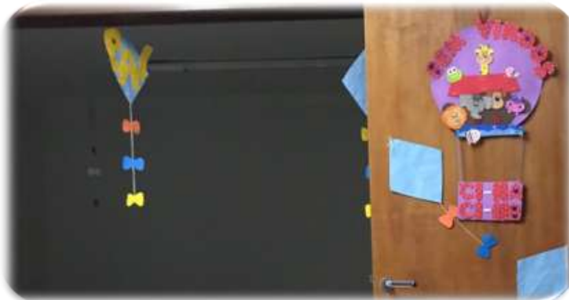
Figura 19- Cartazes Escola Infantil B

Nesse sentido, entendemos que, para não reproduzir a padronização como mostra também na Figura 19, a decoração da sala poderia ser realizada pelos alunos, pois assim é possível trabalhar a construção da autonomia e da sensação de pertencimento ao lugar que os alunos estão inseridos.