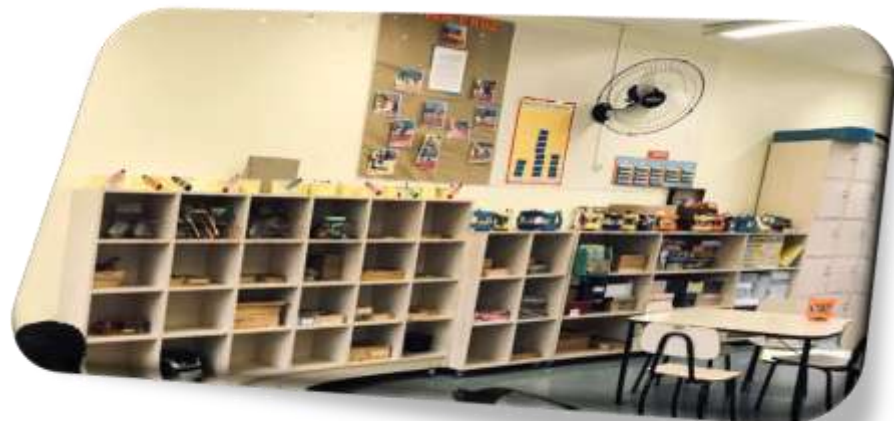
Figura 6: Cartazes e Organização da sala

Sendo assim, Adorno (1973) nos alerta, afirmando que tal padronização poderá nos levar a uma reprodução da indústria cultural no que se refere ao conformismo, ao naturalismo, impedindo, dessa maneira, pensar em espaços diferenciados que levem em consideração a identidade dos sujeitos envolvidos. Se estes cartazes tivessem sido construídos pelos alunos, poderiam ter agregado valor de pertencimento e, com isso, a sala de aula teria sua essência voltada à construção da autonomia em relação ao ser sujeito e do espaço em questão.