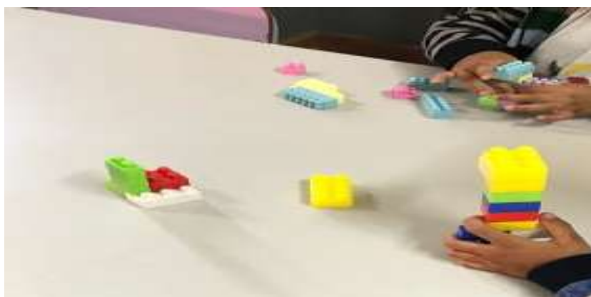
Figura 29- Brinquedos e Jogos Proporcionados Escola Infantil B

Na Figura 27 e 28, conforme os momentos observados, nota-se que as crianças se divertem e brincam com os brinquedos proporcionados pelo baú, interagem entre si, criam situações de imaginação e faz de conta, desenvolvem certas habilidades motoras etc. Porém, ressaltamos que estes momentos são entre as crianças. Não percebemos a mediação da professora nos momentos de brincadeiras, pois ela ela fazendo outras atividades das crianças.