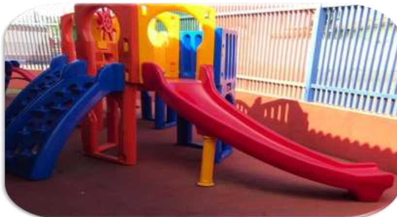
Figura 15- Parque Escola Infantil B