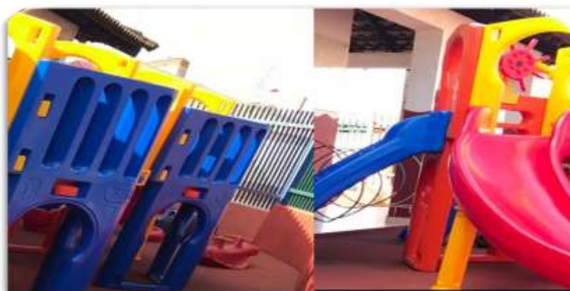
Figura 16- Parque Escola Infantil B