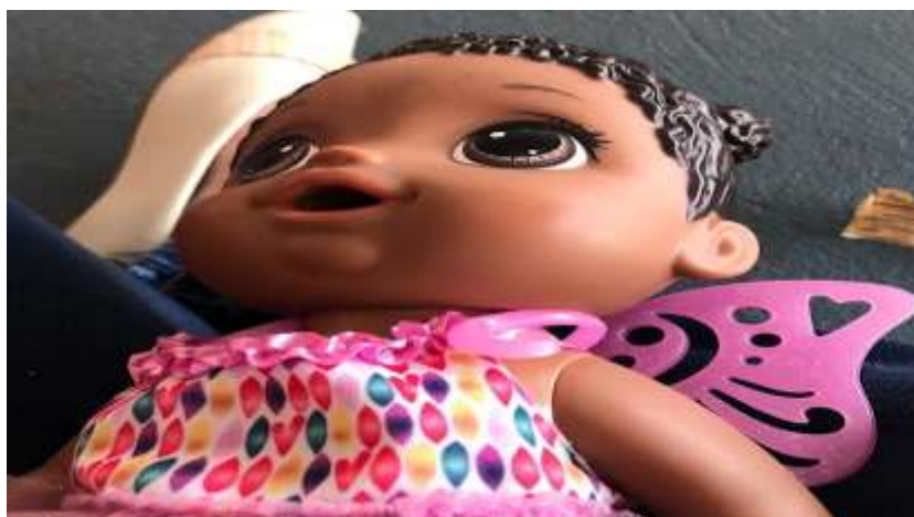
Figura 26- Brinquedos e Jogos Proporcionados Escola Infantil B

Esses brinquedos da sociedade contemporâneos têm o único objetivo de instigar e preparar a criança para o seu futuro estereotipado do mundo adulto, esquecendo o presente: o ser criança. Observa-se na Figura 25 e 26, brinquedos com influencias da industria do consumo, tais como as, as bonecas e boneco do mc donald.