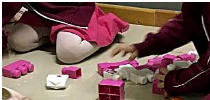
Figura 28- Brinquedos e Jogos Proporcionados Escola Infantil B

Assim como na Escola Infantil A, esta escola também acaba por fornecer peças de encaixar para as crianças como uma forma de esperar a próxima ação ( neste momento da Figura 27, as crianças brincam com suas pecinhas para esperar o momento de irem embora), Enquanto a professora esta organizando a sala, terminando de corrigir trabalhos, etc.