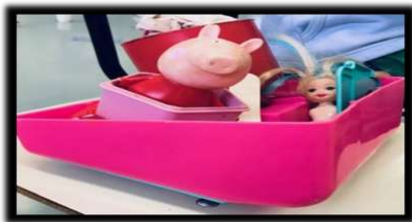
Figura 32- Brinquedos e Jogos Proporcionados Aplicação da Oficina

Foram apresentadas às professoras algumas fotos dos brinquedos proporcionados no baú, que limitam a questão do lúdico e da voz para os artefatos da indústria cultural. Brinquedos tais como: bonecas prontas com vestidos do filme Frozen , boneca Barbie , carrinho de super-herói, boneca da Peppa Pig , e outros brinquedos prontos, que não aguçavam a criatividade, nem a imaginação da criança. Conforme Figura 32 e 33.