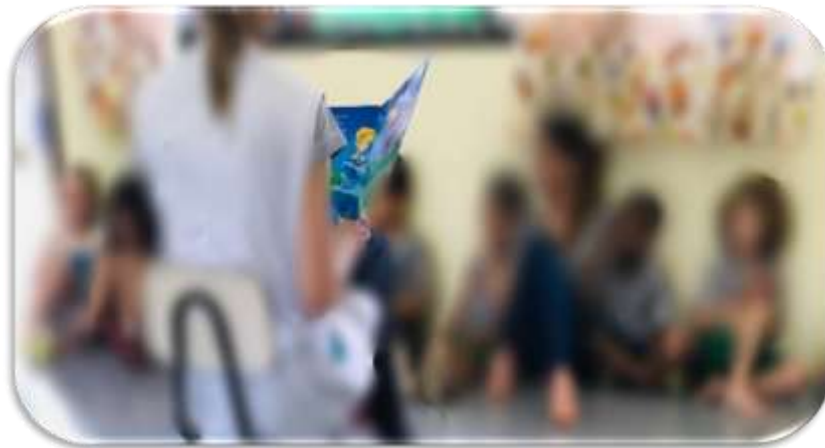
Figura 14- Roda de Leitura

É neste momento que percebemos que a professora não quer ser interrompida com as dúvidas e curiosidades das crianças, quando ela fala que irá responder depois, que percebemos que se perde o momento que poderia ser riquíssimo de indagações e contextualizações, o qual poderia promover a ludicidade por meio da formação de conceitos com as crianças.