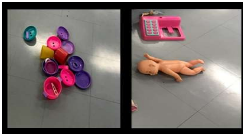
Figura 33- Brinquedos e Jogos Proporcionados Aplicação da Oficina