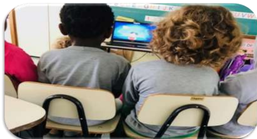
Figura 7: Atividade Reciclagem

Neste momento, as crianças gostaram do vídeo, acharam interessante por conter imagens da “Turma da Mônica”, engraçado na parte dos personagens e, no final, houve uma reportagem sobre uma baleia que se viu na televisão. Como mostra a imagem, a professora passou a atividade no notebook , que, em nossa perspectiva, as condições não foram favoráveis, pois o notebook é muito pequeno para as crianças em sala de aula. Segue a figura 7: