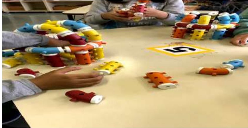
Figura 12- Brinquedos e Jogos Proporcionados

entanto, deveriam estar presentes, todos os dias, atividades que despertassem o máximo de desenvolvimento possível das crianças.