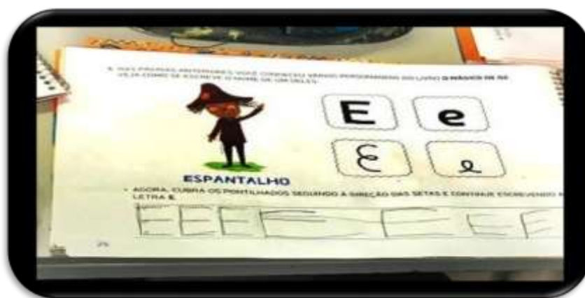
Figura 20- Apostila Escola Infantil B

Outro dado extremamente importante refere-se à apostila: a escola analisada trabalha um dia da semana com ela. Percebemos um modelo tradicional de ensino, impossibilitando de trabalhar a imaginação, faz de conta, criatividade, artefatos lúdicos com as crianças, assim como mostram as Figuras 20 e 21.