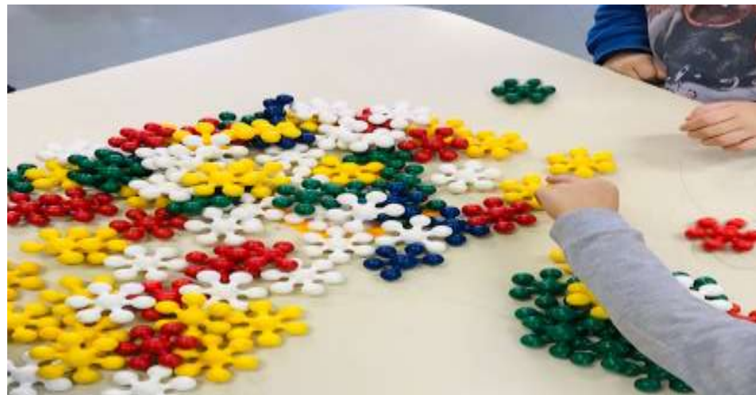
Figura 11- Brinquedos e Jogos Proporcionados

Vale mencionar, que entende-se o quanto observado na realidade, o quanto as professoras possuem uma carga horária extensa e cansativa de trabalho, e que precisariam de mais tempo de Hora atividade para organizar melhor seu trabalho pedagógico, porém para atividades que envolvam a ludicidade, é necessário a mediação do professor.