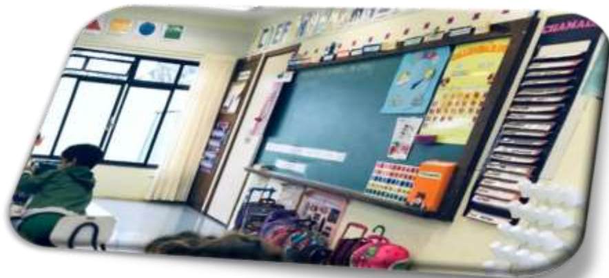
Figura 5: Cartazes e Organização da Sala

No ambiente da sala de aula, inicialmente, pude notar que o espaço físico da sala continha tipos de cartazes espalhados, tais como: calendário, ajudante do dia, regras da sala, chamada, tempo, alfabeto, gráficos e algumas produções da semana, como é possível perceber nas Figuras 5 e 6: