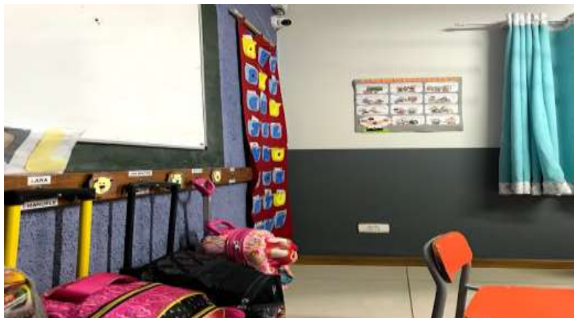
Figura 17- Cartazes Escola Infantil B

Comumente, deixam-se as crianças livres para brincar e, depois, a professora geralmente começa suas aulas com algumas questões rotineiras, tais como, fazer a leitura do calendário, falar qual dia é hoje, mês e ano. Logo em seguida, a professora oferece a proposta de leitura do Alfabeto, e números que estão na parede. Conforme a Figura 17.