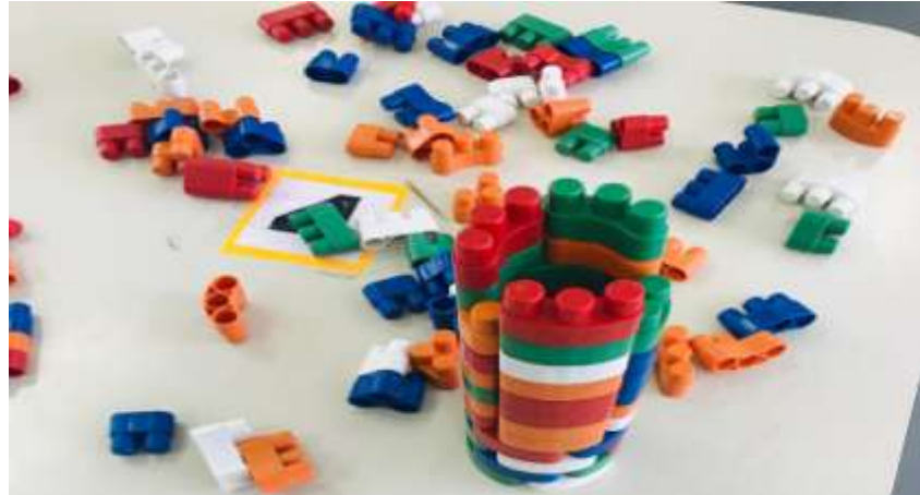
Figura 13- Brinquedos e Jogos Proporcionados