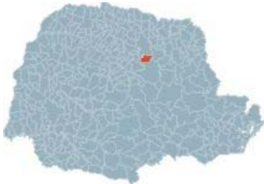
Figura 1 – Localização no Estado do Paraná

O município de Tamarana, instalado no dia 01 de janeiro de 1997 oriundo do desmembramento do município de Londrina, está localizado na região Norte do Estado do Paraná. A sede do município está localizada na latitude 23° 43' 00" S, longitude 51° 05' 00" W e altitude de 770 m.