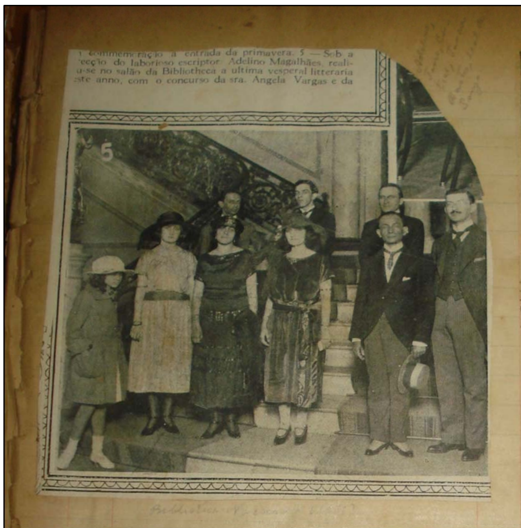
Figura 4 – Fotografia das primeiras “Vesperais”, de 1921