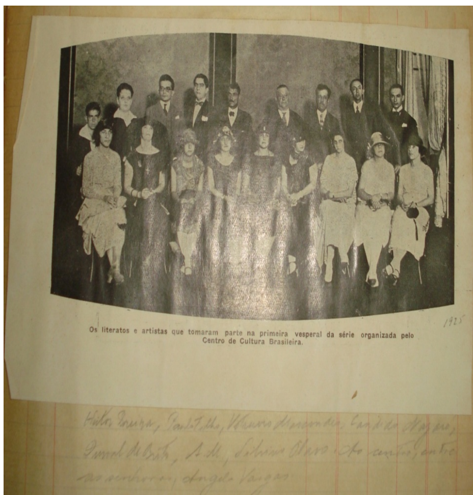
Figura 3 – Reunião do Centro de Cultura Brasileira