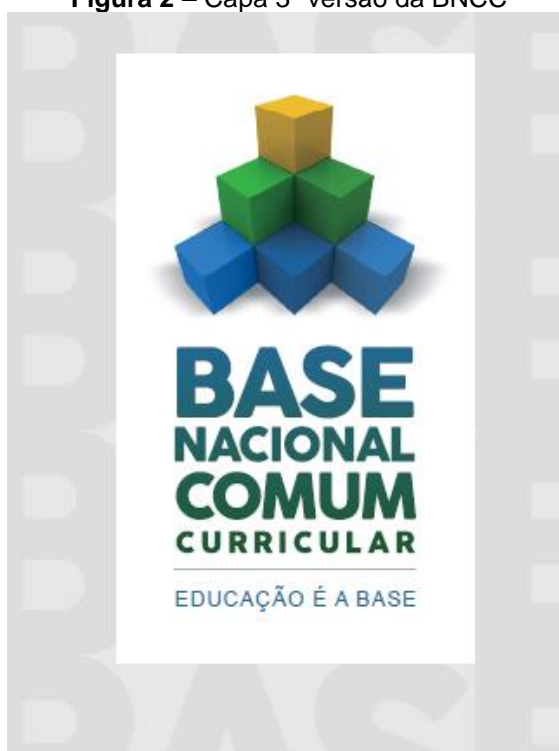
Figura 2 – Capa 3ª versão da BNCC