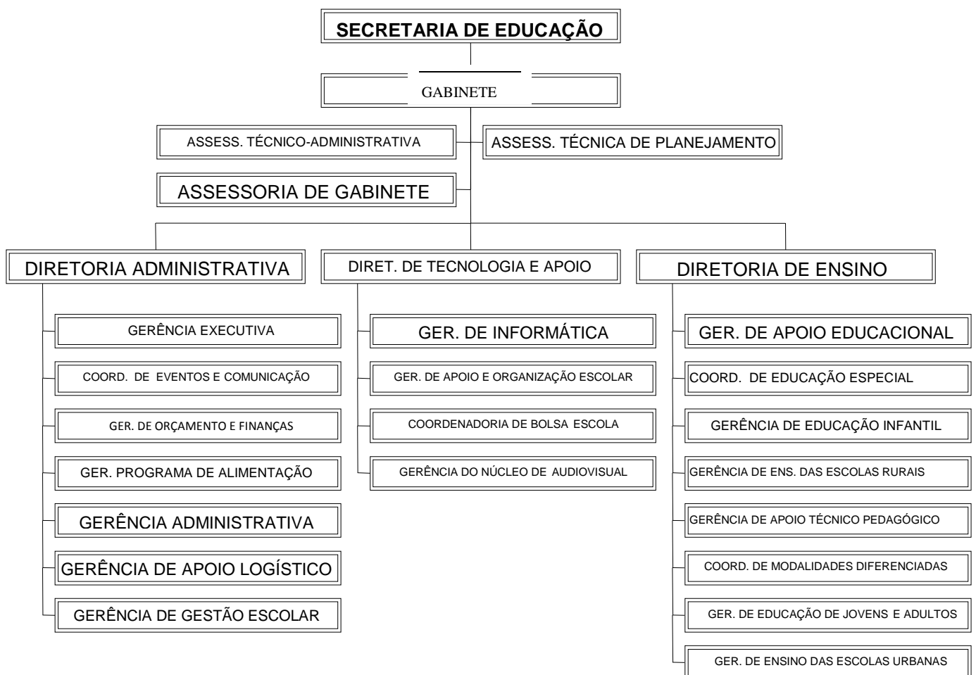
Figura 1 - ORGANOGRAMA DA SECRETARIA MUNICIPAL DE EDUCAÇÃO DE LONDRINA