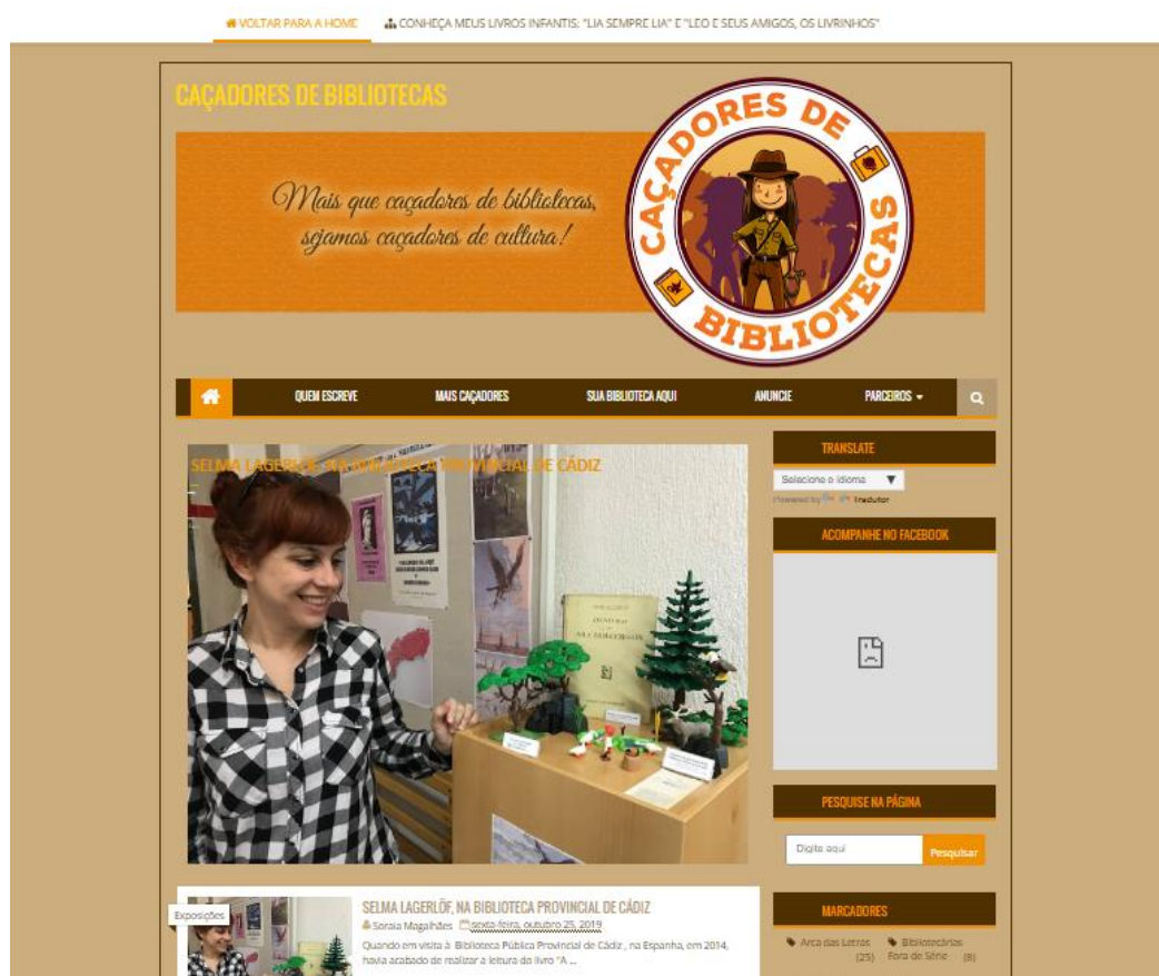
Figura 6 – Layout do blog Caçadores de Bibliotecas