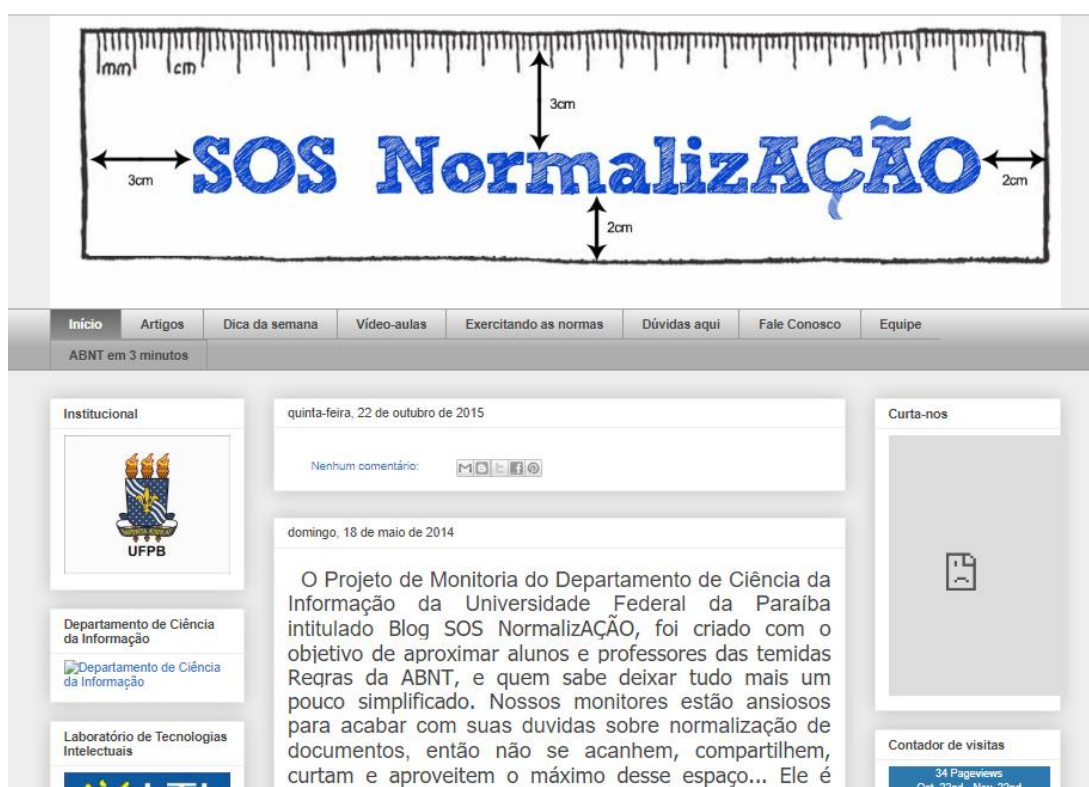
Figura 7 – Layout do blog SOS Normalização