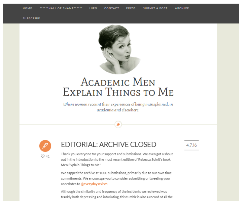
Figura 9 – Layout do blog Academic Men Explain Things to Me

A metodologia usada no trabalho é mista com “caráter exploratório-descritivo [...]” na análise no conteúdo do blog . A partir do termo mansplaining , nos anos de 2012 e 2013, foram recuperadas 15 postagens levantadas em meio às 176 últimas postagens no blog , que organizadas e salvas, permitiram extrair do título e conteúdo, suas induções (SOUSA et al. , 2019).