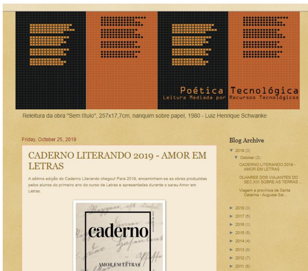
Figura 5 – Layout do blog Poética Tecnológica