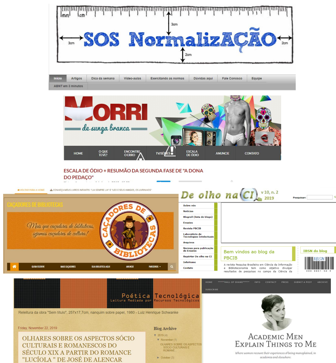
Figura 11 – Organização e representação por menu dos blogs