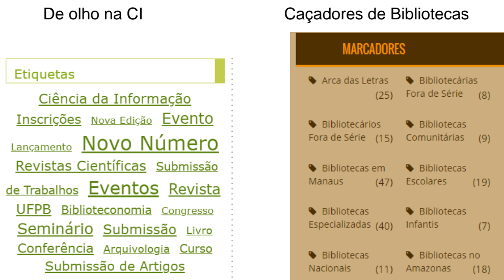
Figura 10 – Organização e representação por tags , marcadores