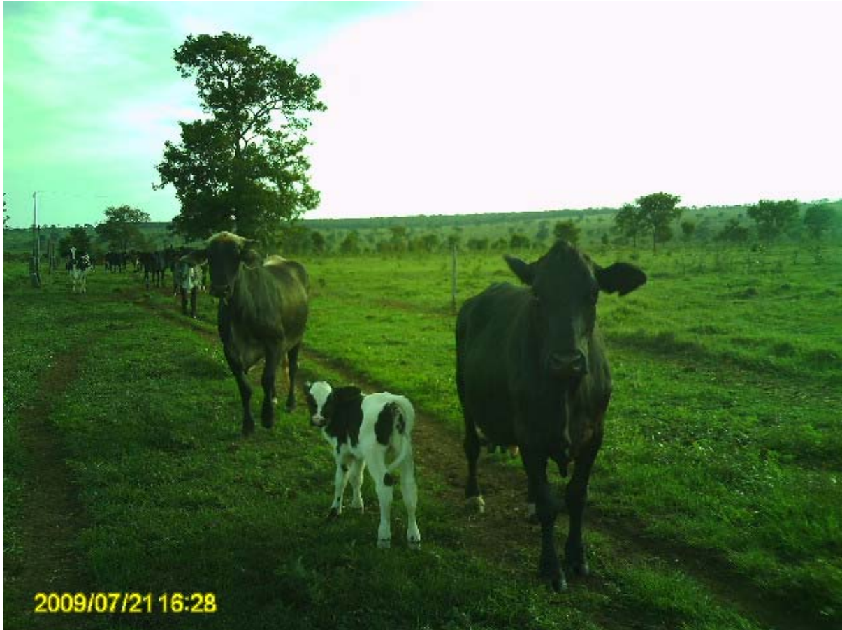
Foto 8 – Pecuária de leite no Assentamento Santa Rita.

O Mato Grosso do Sul produziu 490.069.000 litros de leite no ano de 2007, que representaram 1,88% da produção nacional que foi de 26.133.913.000 litros de leite.