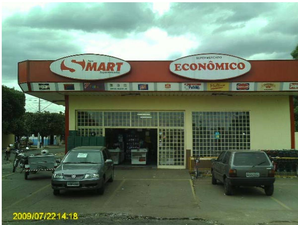
Foto 12 – Mercado na cidade de Santa Rita do Pardo – MS.

A construção civil é outro setor beneficiado pela implantação de assentamentos. Uma das lojas de material de construção local venceu a licitação para fornecimento de material para construção das casas do assentamento Santa Rita e com isso, segundo seu proprietário, no período teve condições de crescer, e hoje 30% das suas vendas são para os assentados.