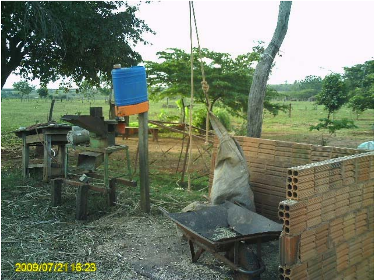
Foto 7 – Local de preparo do alimento do gado leiteiro.

No Mato Grosso do Sul, no ano de 2007, foram ordenhadas 502.571 vacas, o que representa 2,38% do rebanho nacional que é de 21.122.273 vacas. Em Santa Rita do Pardo foram ordenhadas 4.716 vacas que representam 0,94% do rebanho estadual.