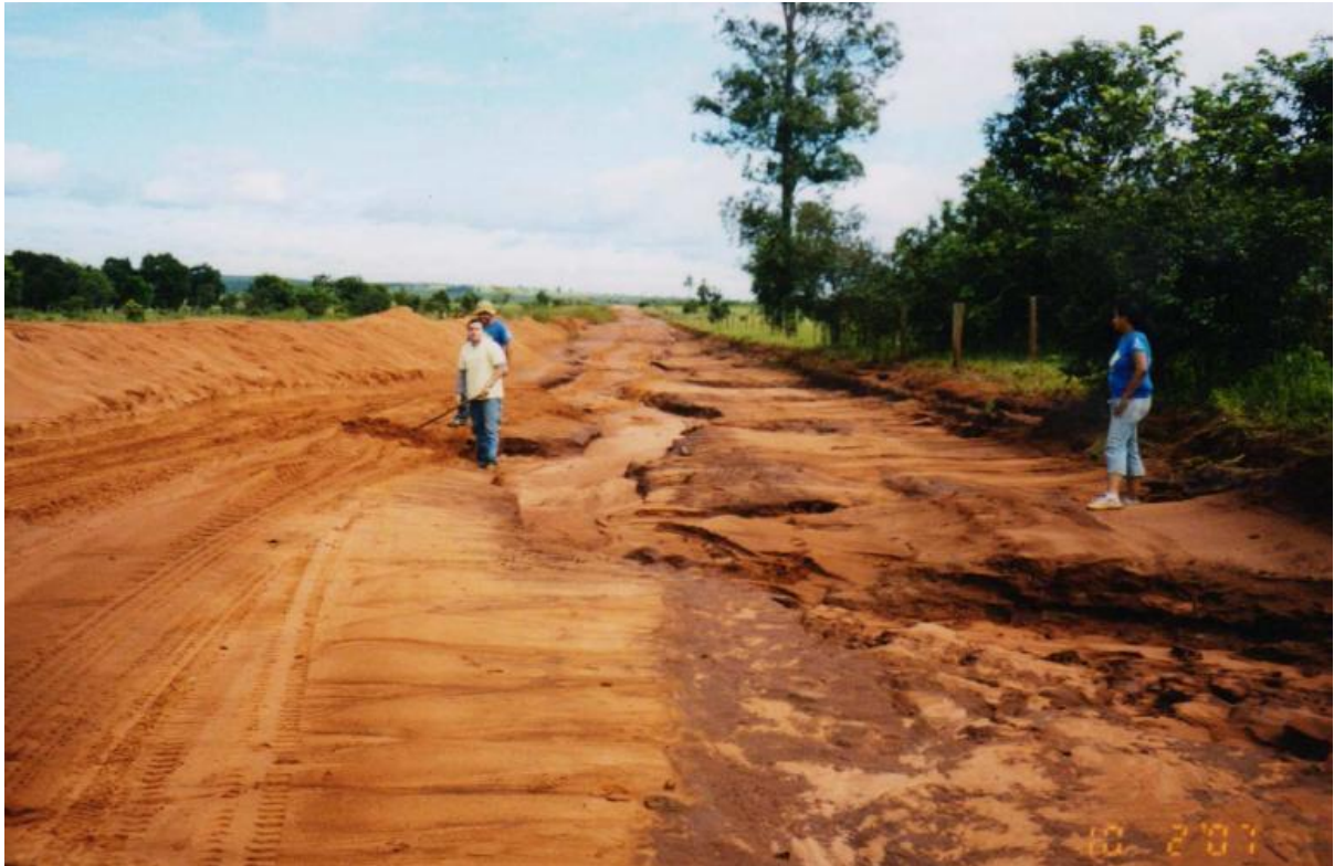
Foto 3 – Estrada de acesso ao assentamento Mutum.

Já no assentamento São Tomé as terras são mais aptas à agricultura, de modo que essa é desenvolvida em conjunto com a pecuária leiteira.