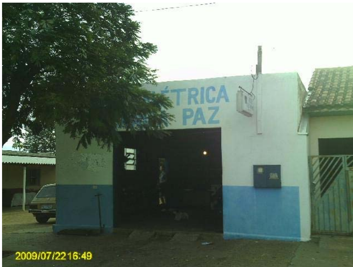
Foto 11 – Oficina e elétrica na cidade de Santa Rita do Pardo – MS.

Mesmo já tendo sido discutido aqui no trabalho que alguns assentados fazem suas compras no município de Bataguassu e em outros municípios, segundo a associação comercial e os próprios donos de mercado de Santa Rita do Pardo 10% dos consumidores dos mercados locais são assentados. Na Foto 12 pode-se observar um dos mercados do município.