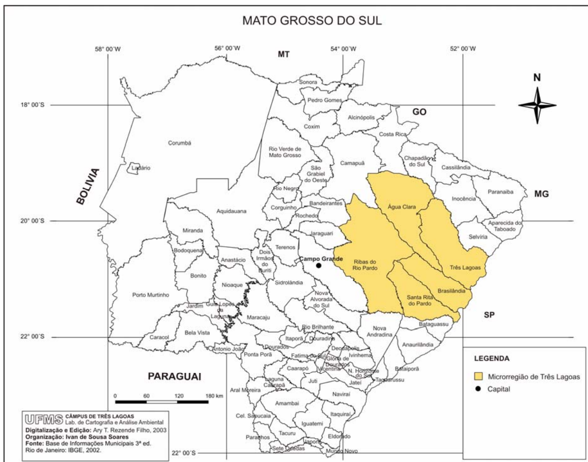
Mapa 3 – Microrregião de Três Lagoas.

Todas estas cidades estão ligadas em rede, e uma delas é rede urbana sulmatogrossense. Segundo Fresca.