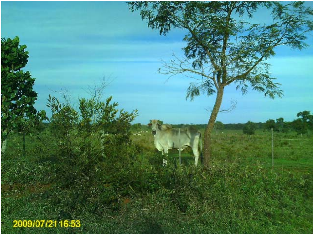
Foto 9 – Pecuária de corte no Assentamento Santa Rita.

engorda. Já no assentamento Mutum, esta opção está ligada às características do próprio assentamento, como o tamanho dos lotes, o dobro dos demais, em virtude da qualidade das terras do assentamento caracterizadas pelos próprios assentados como “muito fracas”.