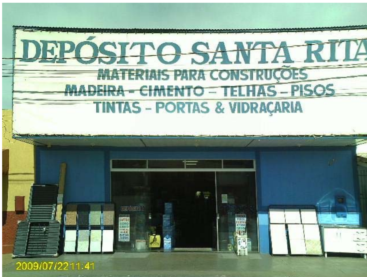
Foto 13 – Depósito de material para construção na cidade de Santa Rita do Pardo – MS.

Na tabela 30, pode-se observar que no Brasil são os pequenos estabelecimentos os grandes responsáveis por práticas de manejo menos degradantes, pois tem sua terra como um instrumento de trabalho que deve ser muito bem cuidado, pois ela deverá produzir por várias gerações. O mesmo pode ser observado em Santa Rita do Pardo, na tabela 31, com uma diferença os grandes estabelecimentos são significativos utilizadores das práticas de pousio e proteção de encostas. Essas duas práticas agrícolas são compreensivelmente fáceis de serem utilizadas pelas grandes propriedades, pois deixar a terra improdutiva pode ser considerado pousio, e nas encostas que não são utilizadas produtivamente, e que a vegetação cresce, pode ser considerado proteção de encostas. Estas práticas podem ser mais encontradas nas grandes propriedades, pois o tamanho de suas áreas e muitas vezes a função que a propriedade tem para seu proprietário, coincidem com essas práticas. Na maioria das vezes as grandes propriedades são controladas como reserva de valor ou capital, o que se encaixa nas praticas tidas como proteção, mas que na verdade são uma