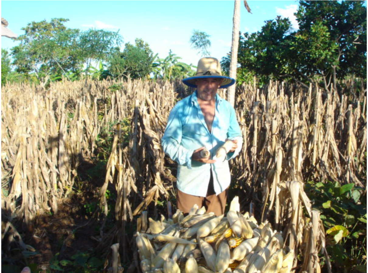
Foto 4 – Produção de milho no assentamento São Tomé.

principalmente para autoconsumo. Nos assentamentos de Santa Rita do Pardo o milho é utilizado principalmente para produção de silagem para o gado e alimento para os animais de pequeno porte.