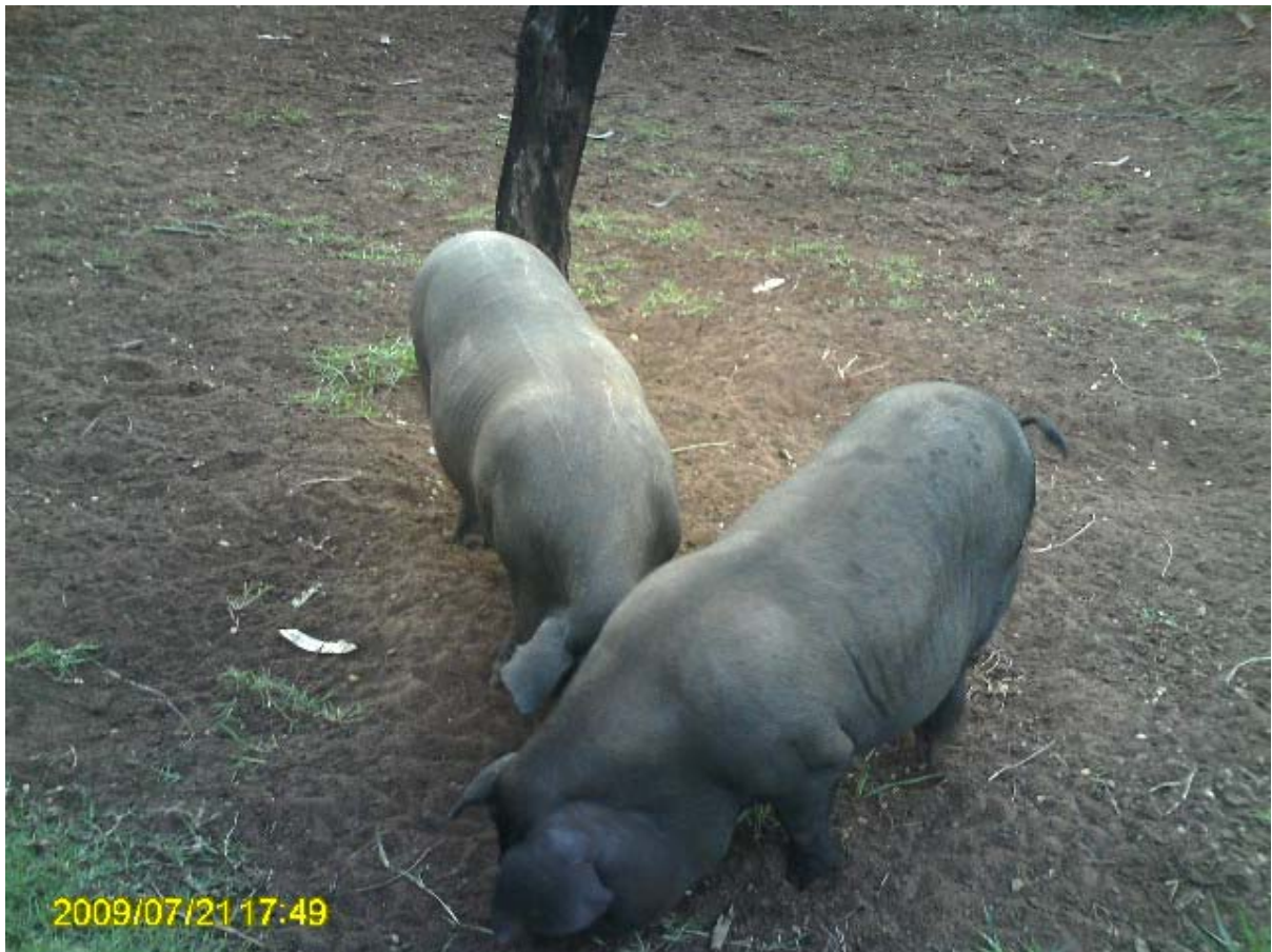
Foto 5 – Produção de suínos no Assentamento Córrego Dourado.

Desta forma, fica claro que se necessita de uma quantidade considerável de milho para alimentar estes animais.