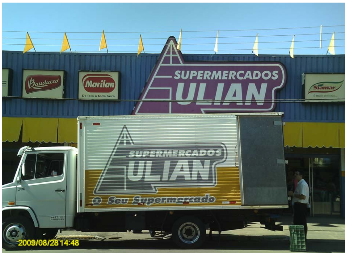
Foto 10 – Mercado em que os Assentados fazem suas compras na cidade de Bataguassu – MS.

Na Foto 10, pode-se observar um caminhão, este estava sendo carregado com as compras dos assentados, de um único assentamento. Esta é uma cena que se repete uma vez a cada mês.