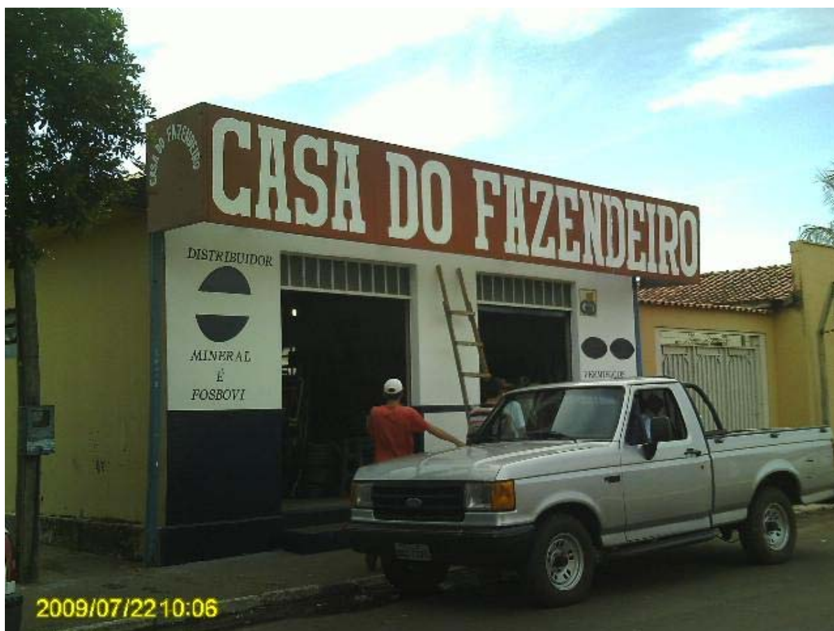
Foto 15 – Casa de produtos veterinários na cidade de Santa Rita do Pardo – MS.

Segundo a associação comercial de Santa Rita do Pardo 40% das vendas do setor no município são feitas para assentados.