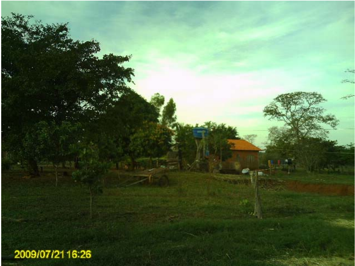
Foto 1 – Casa camponesa no assentamento Santa Rita.

O segundo foi o assentamento Mutum, que possui apenas um terço de sua área no município, sua área total é de 15.831,694 hectares. Foi criado em 1996, e nele foram assentadas 340 famílias. Estas famílias foram assentadas em lotes de 40 hectares em média, variações ocorreram devido à qualidade das terras, segundo os próprios assentados informaram. A foto 2 mostra assentados do Assentamento Mutum produtores de doce de leite.