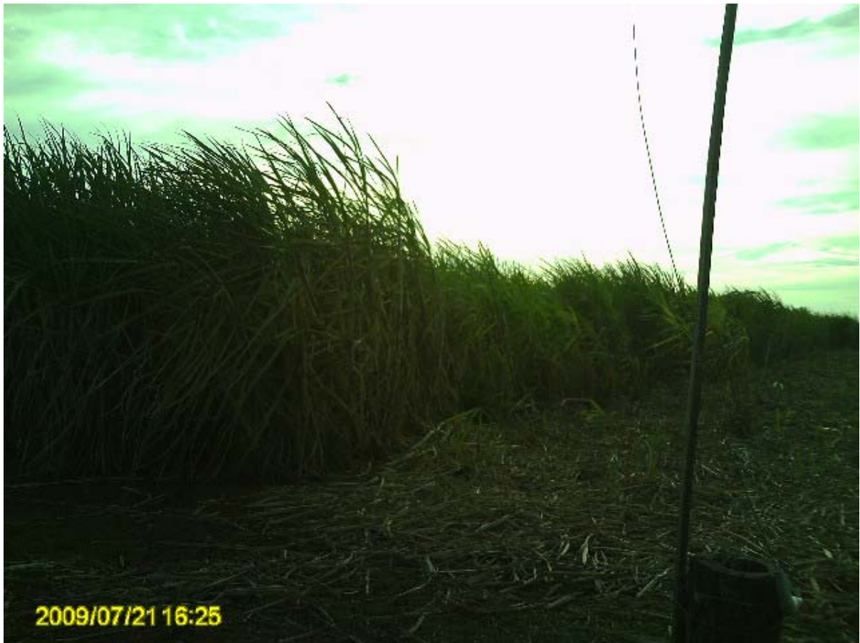
Foto 6 – Cana no assentamento Santa Rita, volumoso utilizado na alimentação do rebanho leiteiro.

Tais rebanhos leiteiros têm, como a produção de suínos, uma ligação muito estreita com a produção agrícola de milho, sendo este junto com a cana-de-açúcar, muito utilizado na produção de alimento para o rebanho leiteiro.