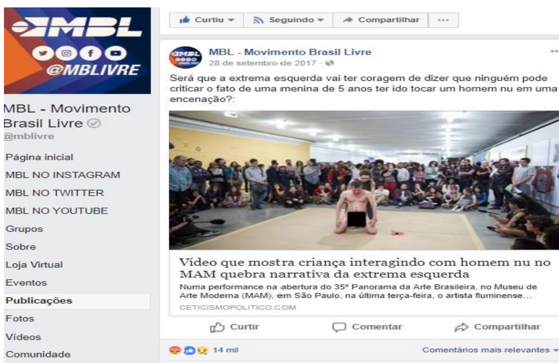
Figura 3 – Vídeo na página do facebook do MBL em referência à exposição do MAM

interagia com o artista, o MBL criou uma campanha contrária à exposição. A matéria do Jornalivre , cujo título “Museu de Arte Moderna de São Paulo faz evento com erotização infantil e gera revolta” 69 , teve mais de 160 mil compartilhamentos. Com 5 mil compartilhamentos, o post na página do facebook do MBL, intitulado “Será que a extrema esquerda vai ter coragem de dizer que ninguém pode criticar o fato de uma menina de 5 anos ter ido tocar um homem nu em uma encenação?” 70 , como ilustra a Figura 3 , foi o mais difundido sobre o tema 71 .