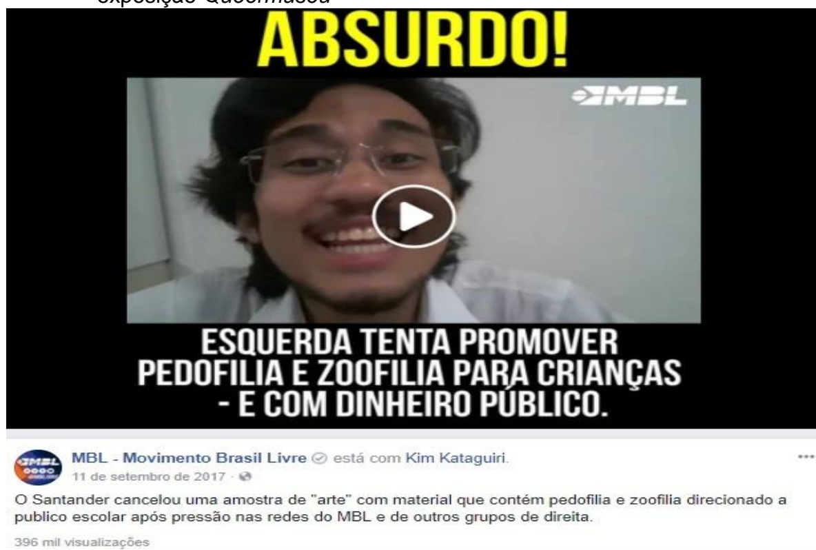
Figura 2 – Vídeo publicado na página do facebook do MBL em referência à exposição Queermuseu

“Esquerda tenta promover pedofilia e zoofilia para crianças – e com dinheiro público” 65 , teve 70 mil visualizações 66 , enquanto que a matéria publicada pelo Jornalivre : “Santander Cultural promove pornografia e até pedofilia com base na Lei de Incentivo à Cultura” 67 , teve mais 12 mil compartilhamentos 68 .