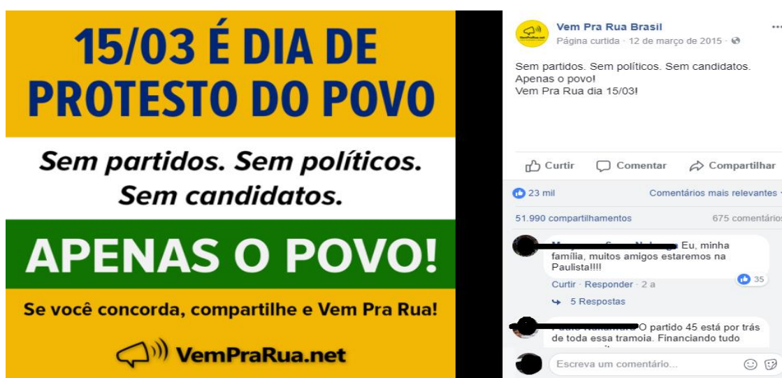
Figura 1 – Convocação pelo Facebook do Vem Pra Rua para a manifestação de 15/03/2015 46

A primeira manifestação do ano de 2015 foi marcada pelas críticas ao governo Dilma e ao PT. O VPR fez o chamado para o ato nas redes sociais como o “dia de protesto do povo”, “sem partidos”, “sem políticos”, “sem candidatos”, “apenas o povo”, conforme ilustra a Figura 1 .