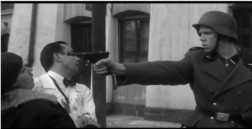
Figura 8: Nazista assassinando a mulher, enquanto o médico tenta salvá-la.