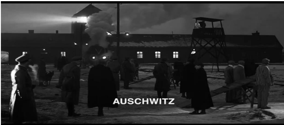
Figuras 10: Chegada em Auschwitz.