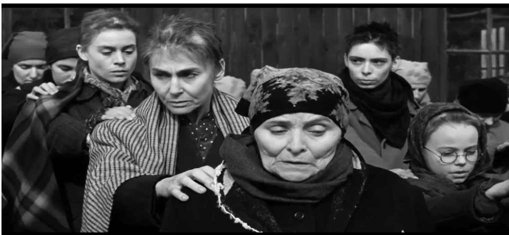
Figura 11: Em Auschwitz, as mulheres perderam os cabelos.