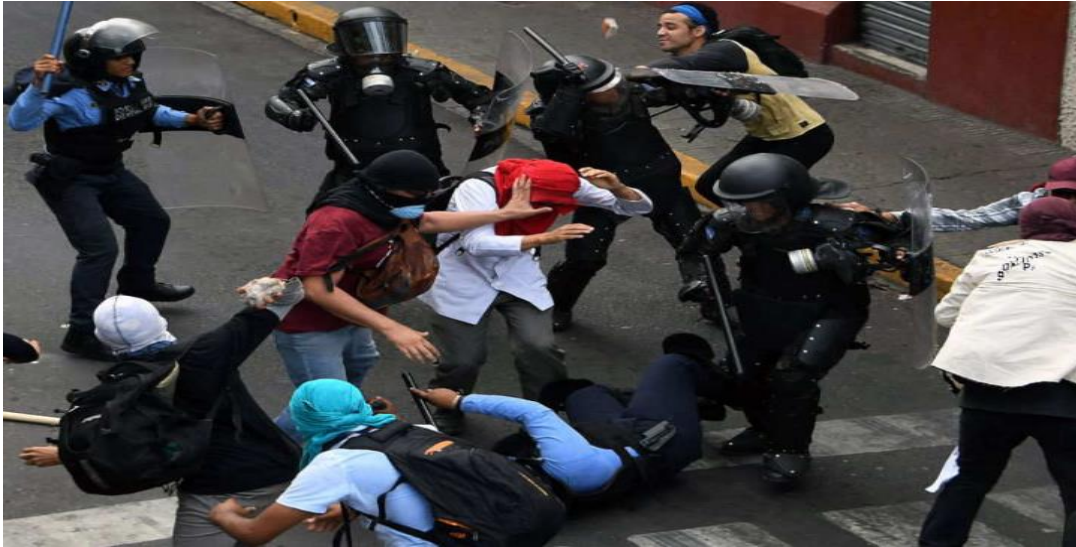
Figura 15: Professores e estudantes lutam contra a Polícia de Honduras, nas ruas da capital do país.