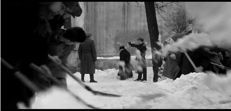
Figura 3: Frieza e desumanização dos nazistas.