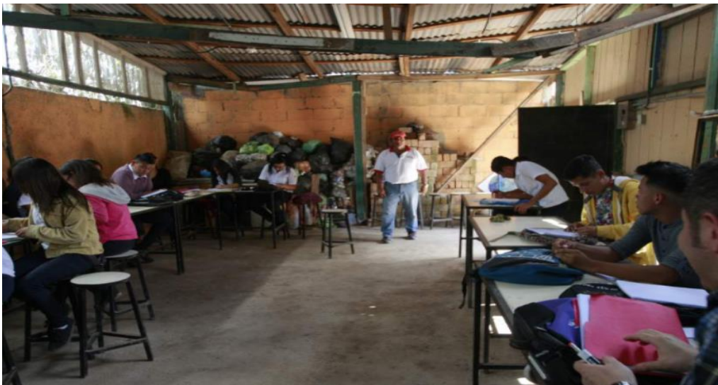
Figura 16: Teto de laboratório dos Centro Educativo, está prestes a cair.