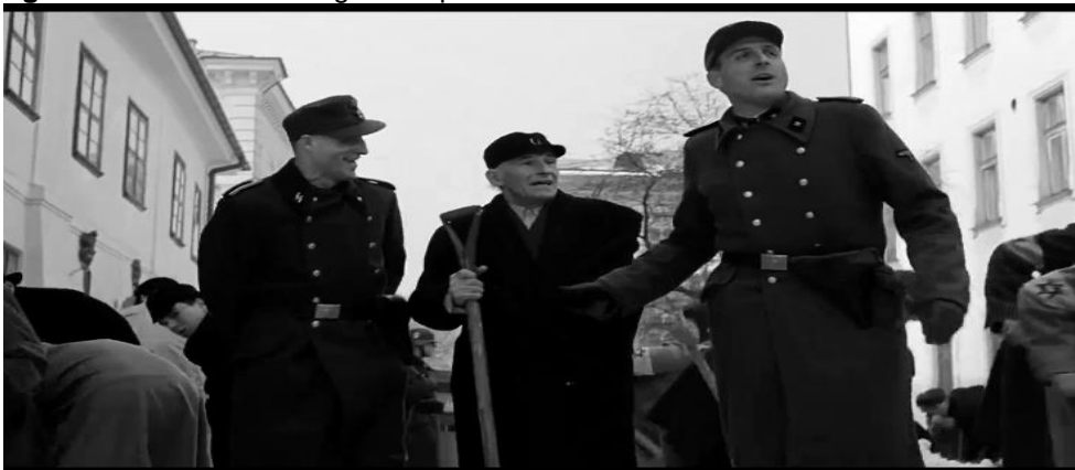
Figura 2: O idoso está enganado pelo uso de falsa bondade.