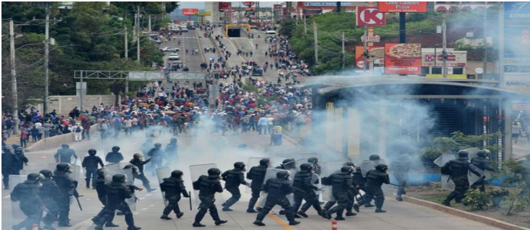
Figura 14: Professores e estudantes brigam contra as forças policiais de Honduras, que lutam em contra da privatização da educação que o governo quer implementar.