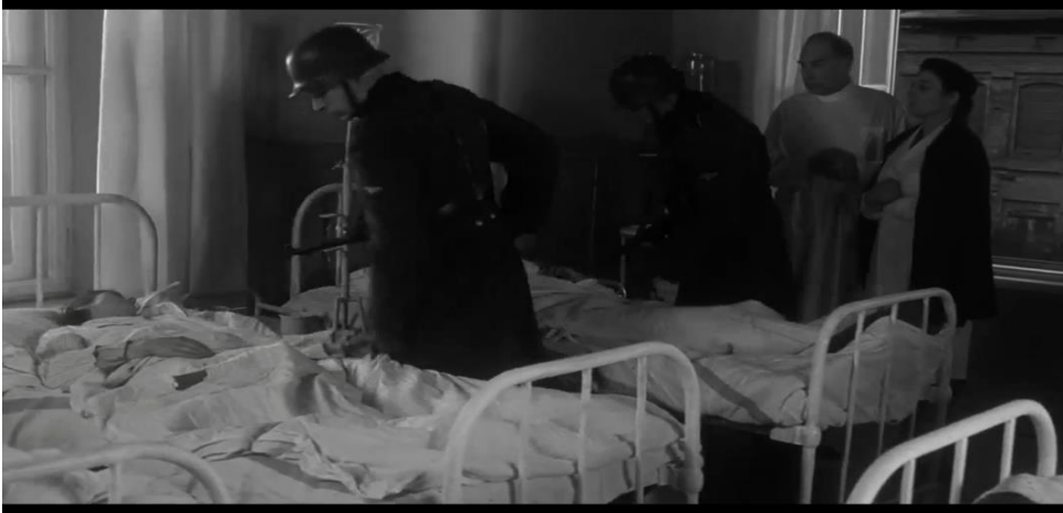
Figura 7: Morte dos pacientes nos hospitais e a ação dos soldados nazistas.