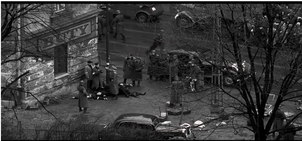
Figura 9: Assassinato em massa pelos soldados nazistas.