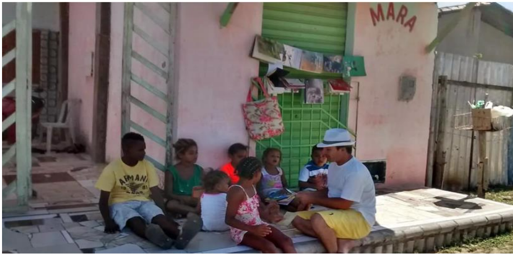
Figura 13: Professor desempregado transformou a calçada de casa em sala de aula