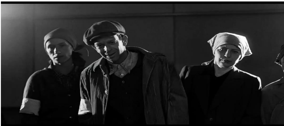
Figura 6: Professor trabalhando na fábrica de painéis de alumínio.