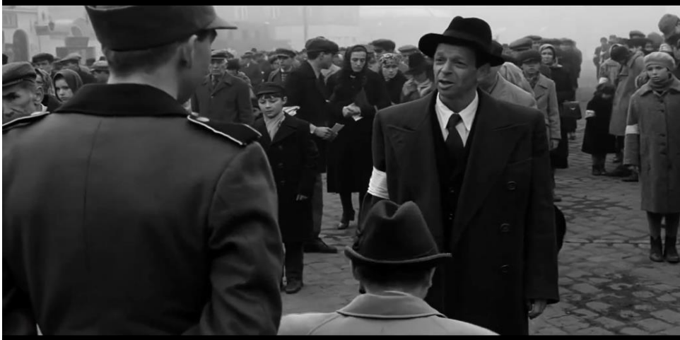
Figura 5: A desvalorização do professor e redução de sua condição profissional.