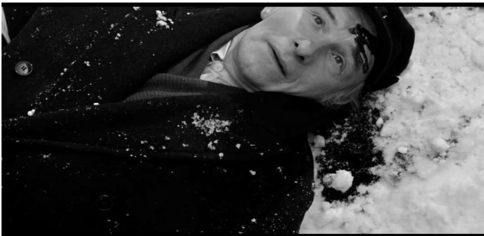
Figura 4: O idoso é executado pela desumanidade dos nazistas.