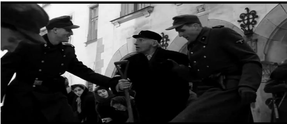
Figura 1: Cena do judeu e idoso retirando neve das ruas.