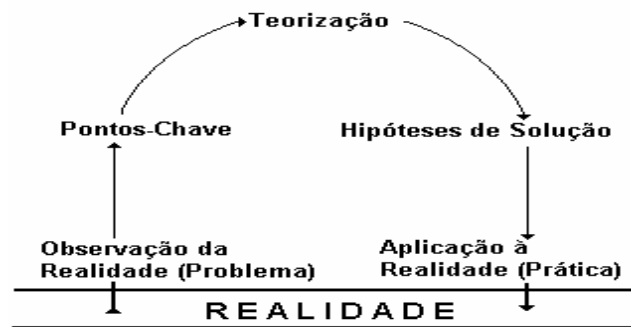
Figura 1 - Arco de Maguerez