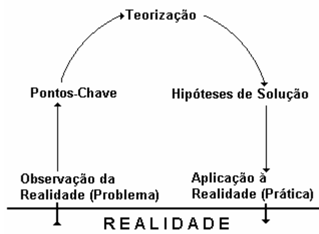
Figura 4 - Arco de Magueréz - 2011

Neste item, passamos a detalhar um pouco mais as etapas do Arco de Magueréz, segundo a versão de Berbel (2011), já brevemente descritas na opção metodológica deste trabalho. A figura a seguir ilustra a dinâmica do Arco com suas cinco etapas: Observação da realidade e definição do problema, Pontos-chave, Teorização, Hipóteses de Solução e Aplicação à Realidade.