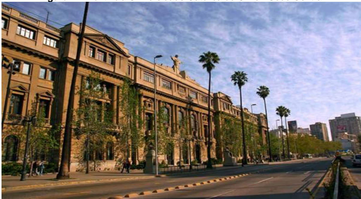
Figura 7 – Pontifícia Universidade Católica do Chile - Sede Central.