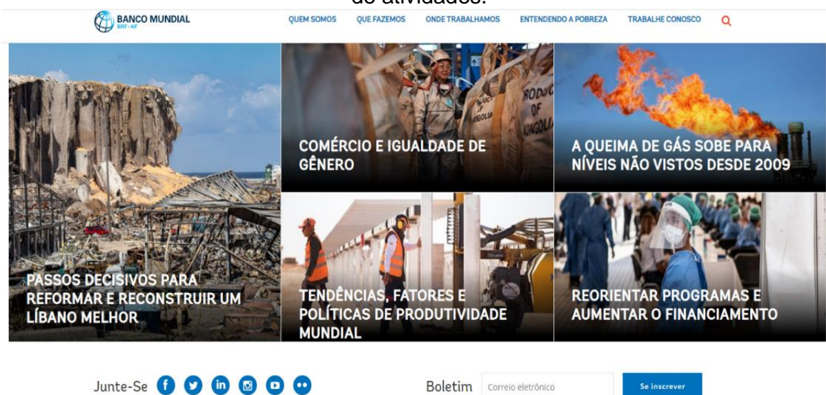
Figura 1 – Página inicial do site do Banco mundial explicitando seus diversos ramos de atividades.