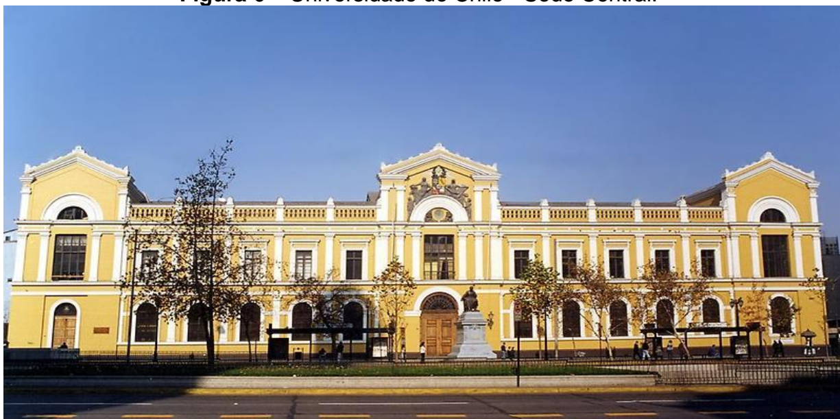
Figura 6 – Universidade do Chile - Sede Central.

Fonte: Site da Universidade de Chile. Disponível em: https://www.uchile.cl/portal/versao-portuguesa/apresenta%C3%A7%C3%A3o/86123/informacoes-gerais . Acesso em: 02 set. 2020.