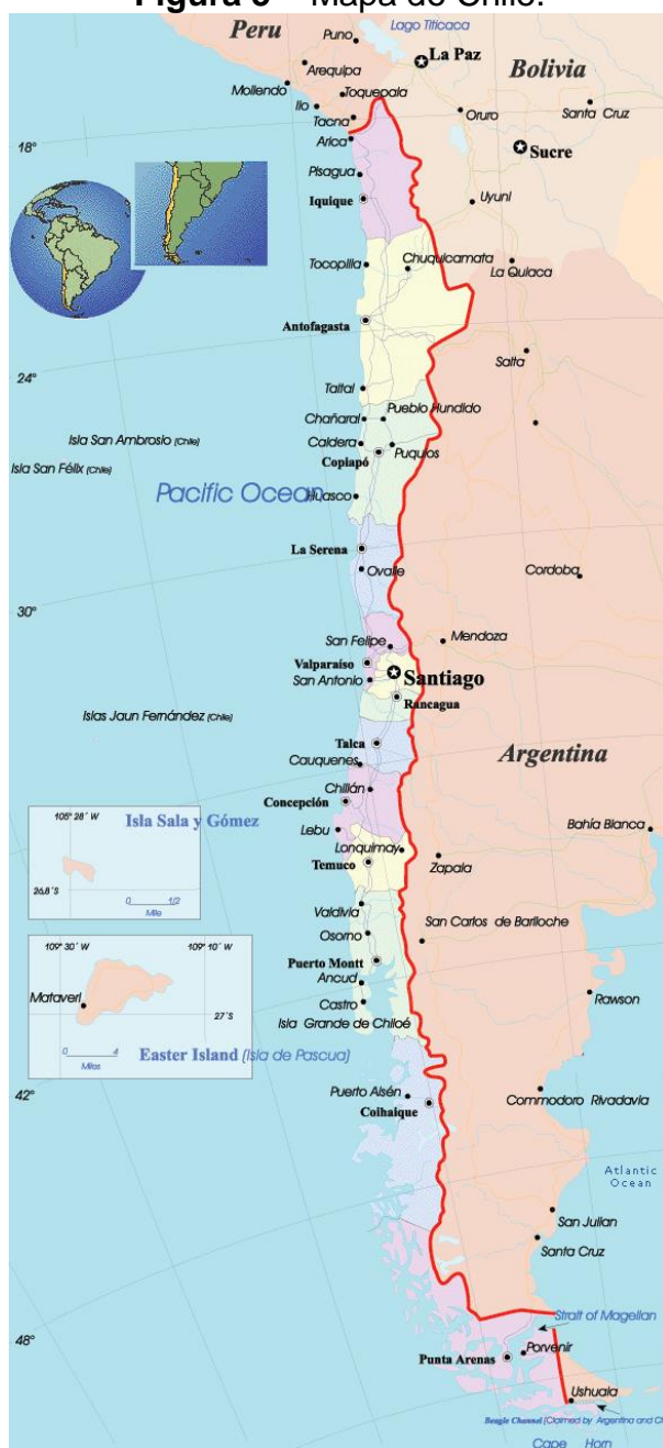
Figura 5 – Mapa do Chile.