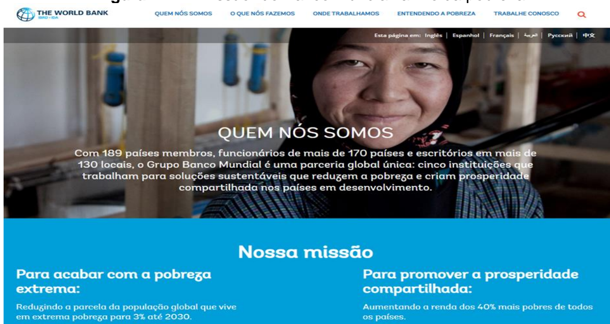
Figura 2 – A "missão" do Banco Mundial: alívio da pobreza.