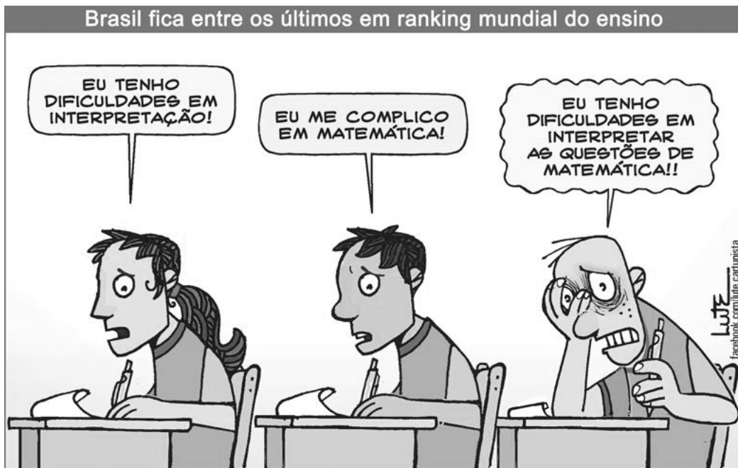
Disponível em www.facebook.com/lute.cartunista

Adaptado de CAFARDO, R. Brasil só deve dominar leitura em 260 anos. Folha de Londrina . Folha Geral. 1 de mar. 2018, p. 8.