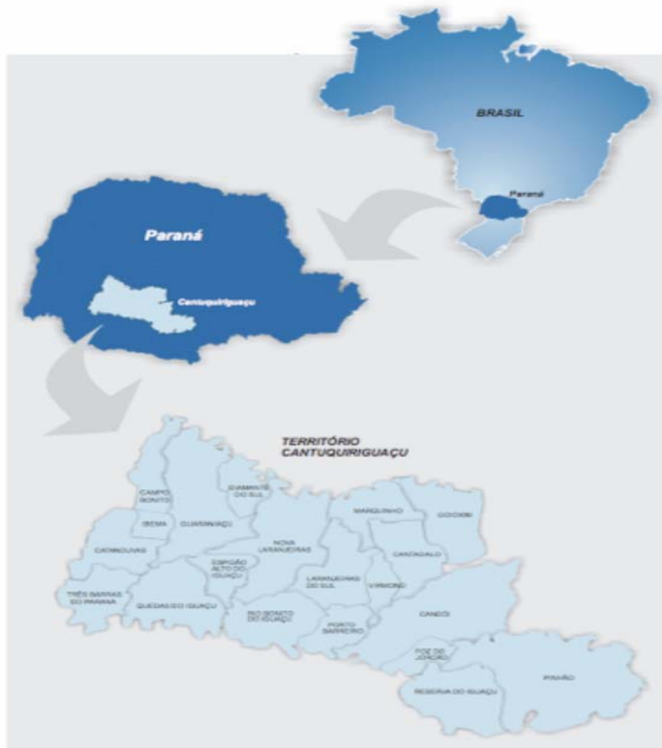
Mapa 1 – Localização do Território Cantuquiriguaçu. Fonte: CONDETEC, 2004, p. 4.

Esta pesquisa foi realizada em Cantuquiriguaçu, denominação dada ao território localizado entre os rios Piquiri, Iguaçu e Cantu (Mapa 1). Do território fazem parte vinte municípios, sendo que 51,74% da população -cerca de 120 mil pessoas -vive na área rural: Campo Bonito, Candói, Cantagalo, Catanduvás, Diamante do Sul, Espigão Alto do Iguaçu, Foz do Jordão, Goioxim, Guaraniaçu, Ibema, Laranjeiras do Sul, Marquinho, Nova Laranjeiras, Pinhão, Porto Barreiro, Quedas do Iguaçu, Reserva do Iguaçu, Rio Bonito do Iguaçu, Três Barras do Paraná e Virmond (BRASIL, 2008).