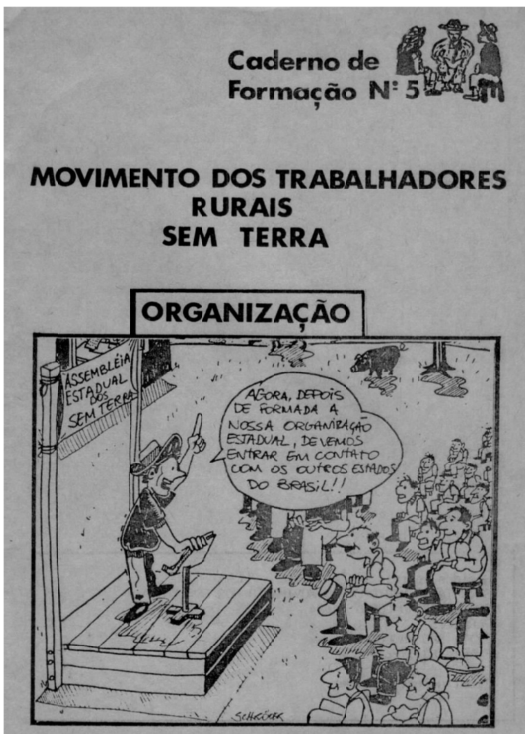
MST. Movimento dos Trabalhadores Rurais Sem-Terra: Organização. Caderno de Formação n. 5. São Paulo, 1985a.