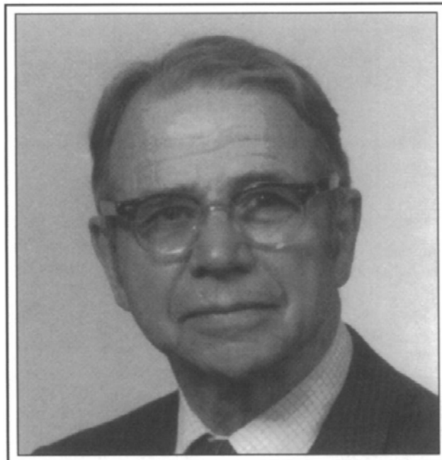
Figura 1 - O Geógrafo Richard Hartshorne

Richard Hartshorne (12 de dezembro de 1899 — Kittannig, Pennsylvania ) eminente geógrafo norte-americano (Figura 02), realizou seus estudos de graduação na Universidade de Princeton entre os anos de 1917 e 1920, tendo como campo de estudo a Matemática. Fascinado pela obra de Ellsworth Huntington, Hartshorne segue os conselhos do autor — se corresponderam por meio de cartas — e foi obter uma formação mais ampla em Geologia, Antropologia, Biologia, Economia, dentre outras áreas. Assim, em 1921, entra para o curso de doutoramento junto ao Departamento de Geografia da Universidade de Chicago, um dos mais famosos dos Estados Unidos.