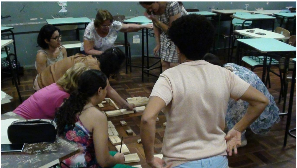
Figura 1 – Atividade deflagradora: construção da Escola Ideal

Discutiu-se, sobretudo, o espaço físico, mais que qualquer outro aspecto. Percebeu-se, então, o desejo e as aspirações do grupo. Nossa escola é um prédio de andares, bem diferente das construções atuais das escolas municipais, que se apresentam na forma da letra U ou numa formação parecida com a representação abaixo, feita durante o grupo focal 38 .