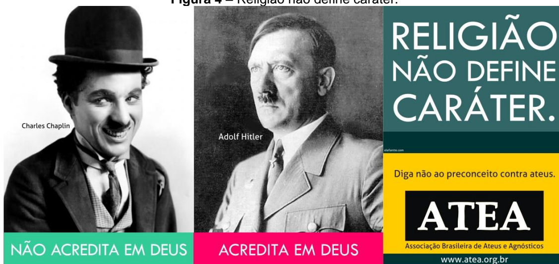
Figura 4 – Religião não define caráter.

Por fim, a frase “Religião não define caráter”, é colocada junto às imagens de Charles Chaplin (com a frase “não acredita em Deus”) e Adolph Hitler (com a frase “acredita em Deus”). Assim como a frase anterior, “Se Deus existe, tudo é permitido”, Montero e Dullo (2014) argumentam que a campanha “coloca o problema da conduta moral” (p. 65) e, devido às imagens e enunciados escolhidos evocando a crença ou a descrença em Deus, “causa escândalo” (p. 65).