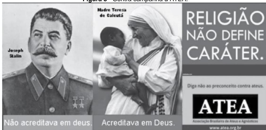
Figura 5 - Contra campanha à ATEA.