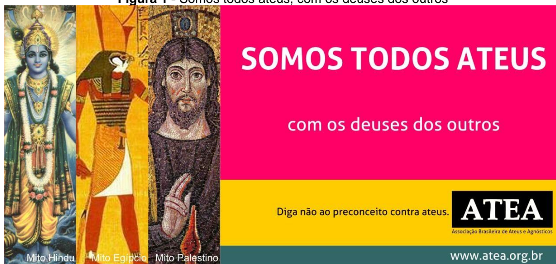
Figura 1 - Somos todos ateus, com os deuses dos outros