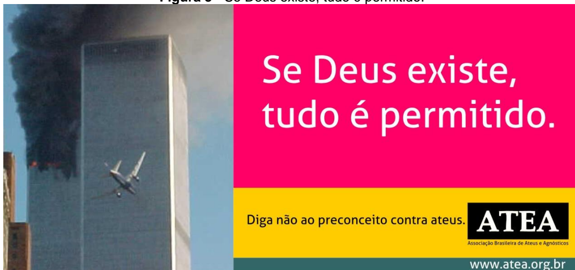
Figura 3 - Se Deus existe, tudo é permitido.

A próxima frase, “Se Deus existe, tudo é permitido”, foi inserida junto a imagem do ataque às torres gêmeas no dia 11 de setembro em Nova Iorque. Montero e Dullo (2014) argumentam que a frase é colocada como uma inversão “à proposição bem conhecida de Dostoiévski na obra Os irmãos Karamázov , de 1879” (p. 64).