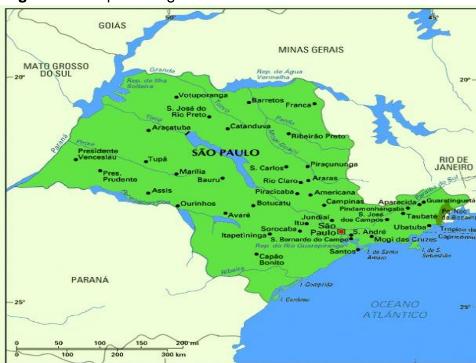
Figura 1 – Mapa da região do Estado de São Paulo

O município de Presidente Prudente foi escolhido como palco de nossas reflexões, pelo fato de ser o único de grande porte na região e por possuir uma trajetória significativa na implantação dos serviços da Política de Assistência Social, sendo base de referência para outros municípios da redondeza. Presidente Prudente está localizada no sudoeste do Estado de São Paulo 60 e, segundo o IBGE, em 2015, a população do município era de 222.192 habitantes.