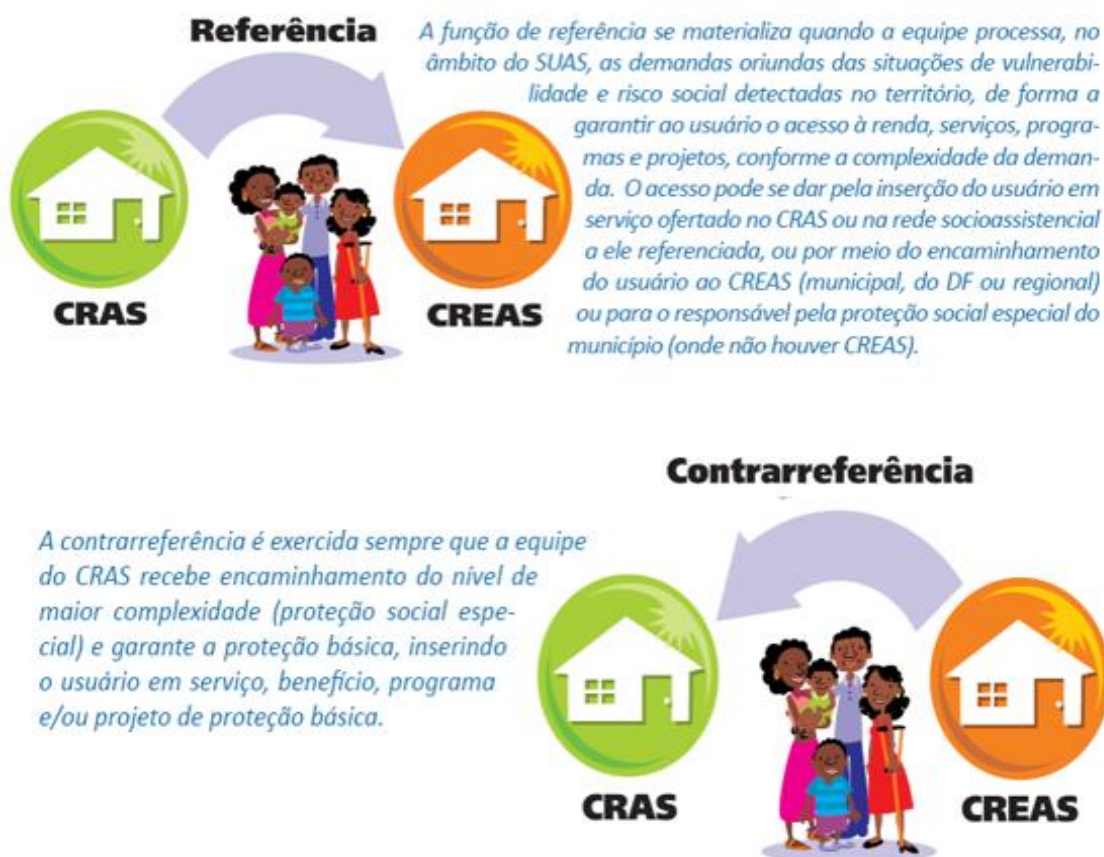
Figura 2 – Referência e a Contrarreferência do Usuário