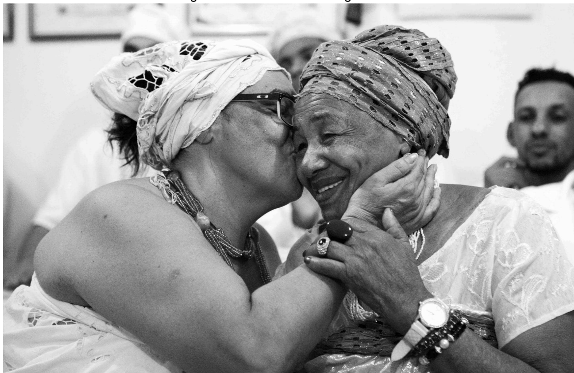
Figura 22: Acolhimento de Agbá