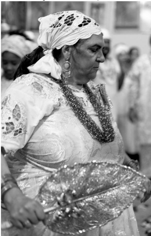
Figura 17: Rum de Opará