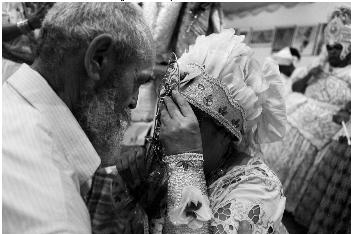
Figura 23: Devoção