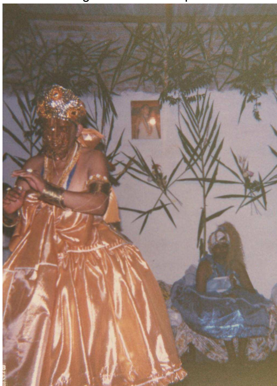
Figura 12: Oxum Opará