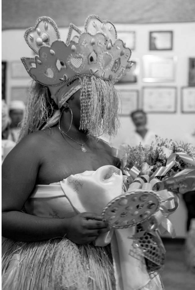
Figura 19: Rum de Oxum