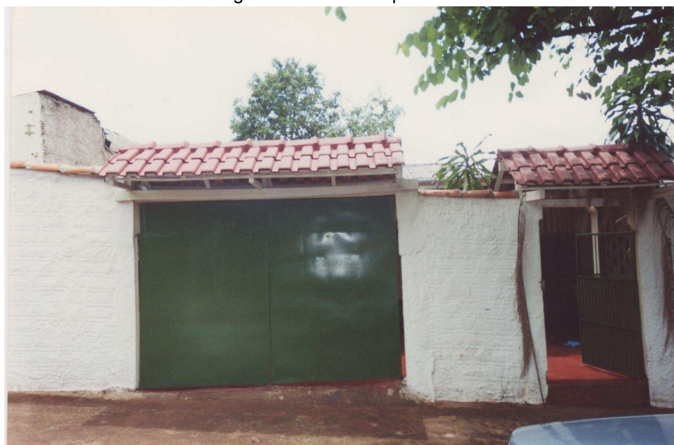
Figura 13: Ylê Axé Òpó Omim

Ser filha de santo do Ylê Axé Òpó Omim é ser cotidianamente amada, zelada e cuidada por Mamãe Oxum. É saber que tenho uma mãe que está sempre comigo e também que tenho responsabilidade e obrigações de filha com essa mãe.