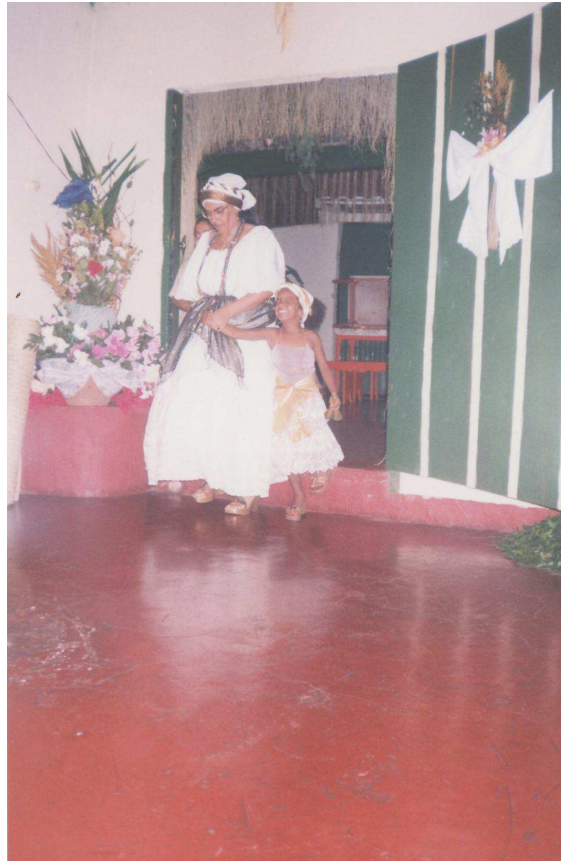
Figura 7: Vó e Neta: Mães