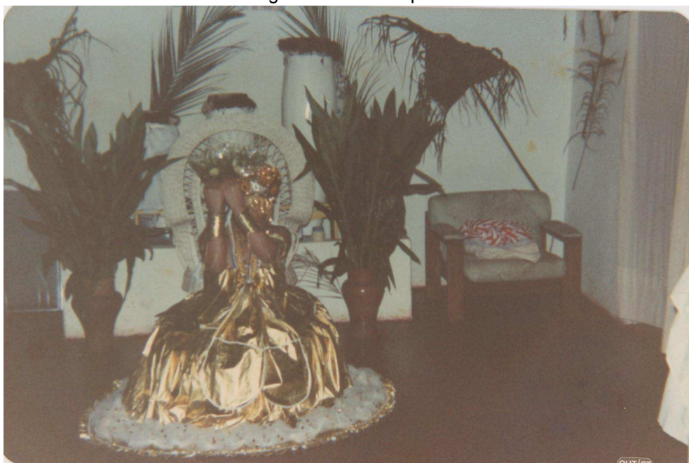
Figura 11: Oxum Opará