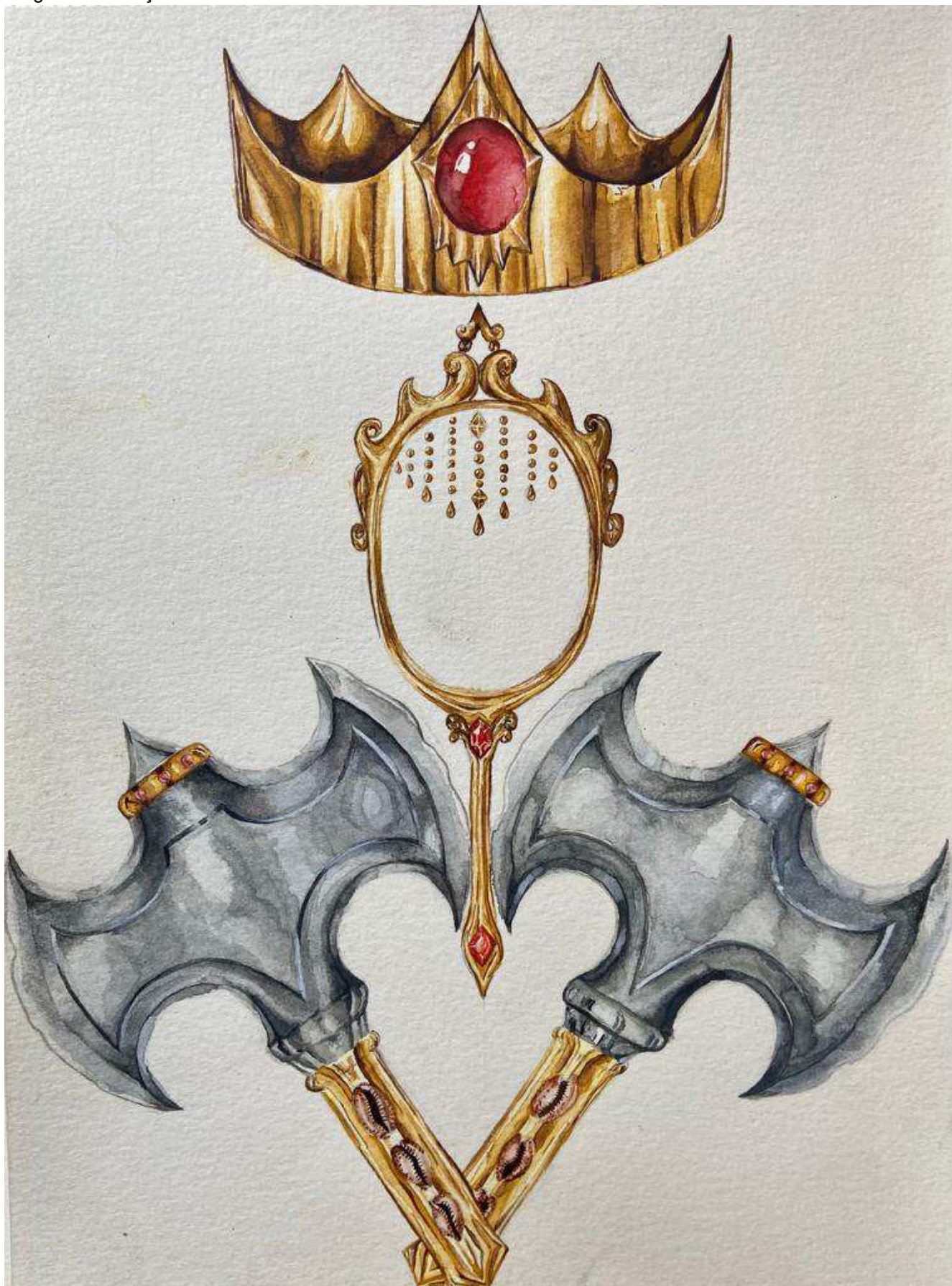
Figura 1: Proteção

Fonte: Arte de Tayla Silla, 2023. Acervo pessoal.