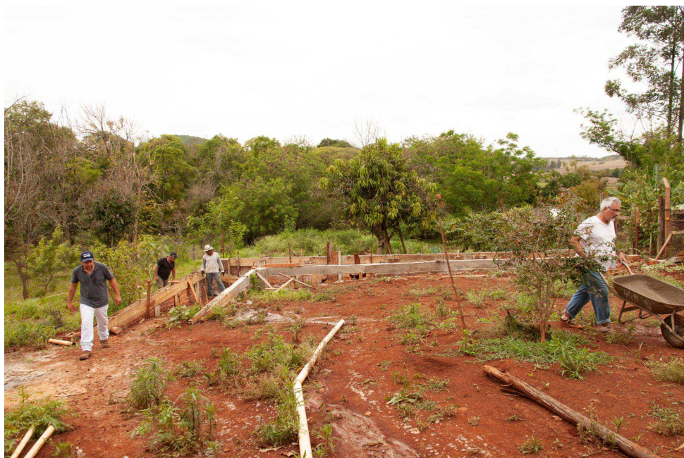
Figura 5: A construção do Palácio de Mamãe Oxum