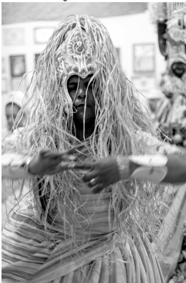
Figura 18: Rum de Oxóssi