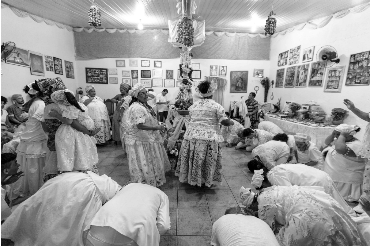
Figura 15: Xirê de Oyá