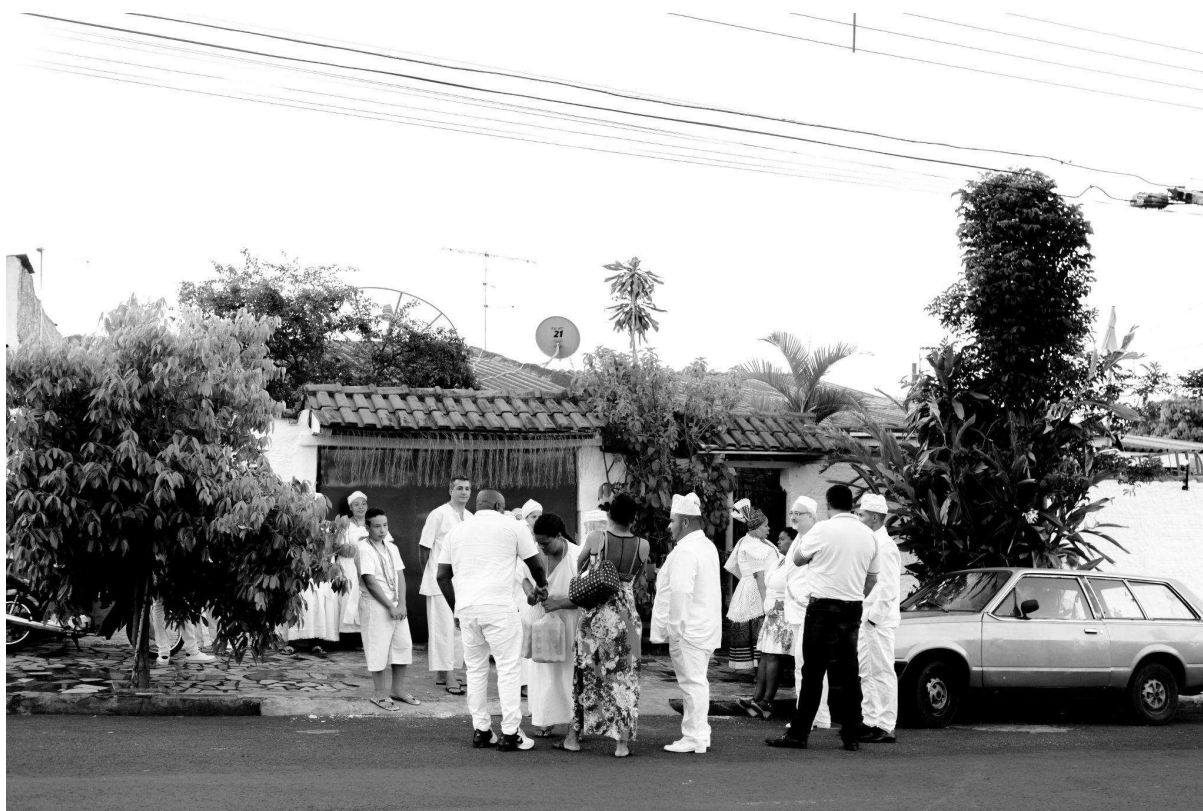
Figura 14: Portal para o Sagrado