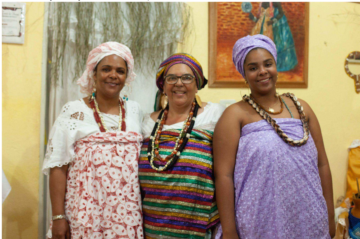
Figura 3 - Matrilinearidade (da esquerda para a direita: Iyákekerê 21 Mãe Odé, Iyálorixá 22 e Iyálodê 23 Mãe Omin e Iyáloxé Iyázinha 24 de Oxum)