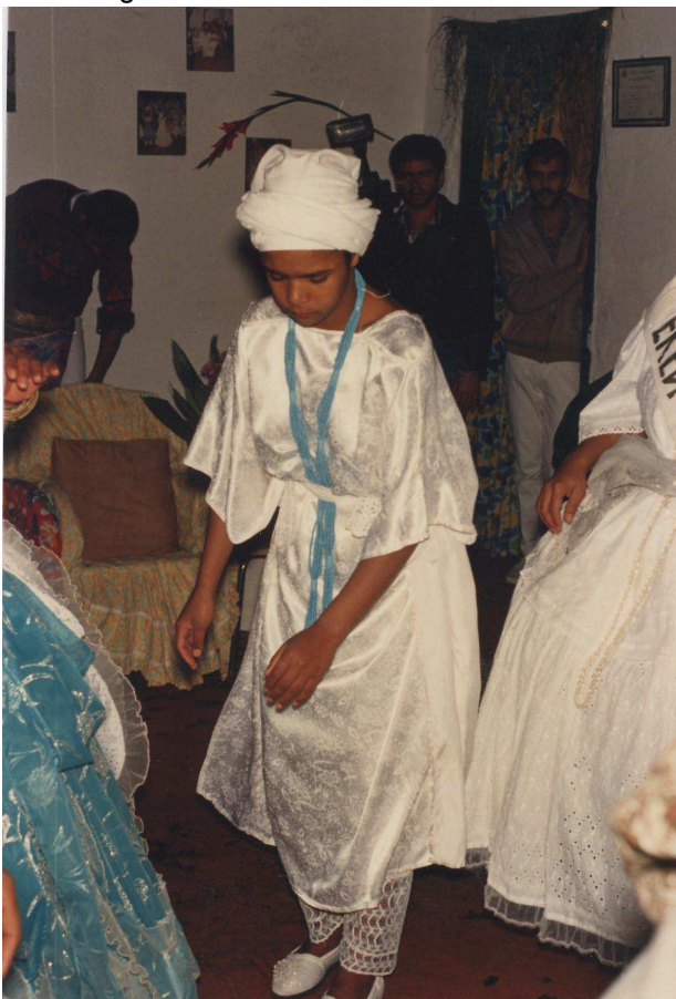
Figura 8: Saída de Santo de Mãe Odé

hierarquia. Nos dias de festa, em que sou uma lyawo fotógrafa, eu tenho o agô dos orixás e das Mães para fotografar esses momentos e de poder estar em pé.