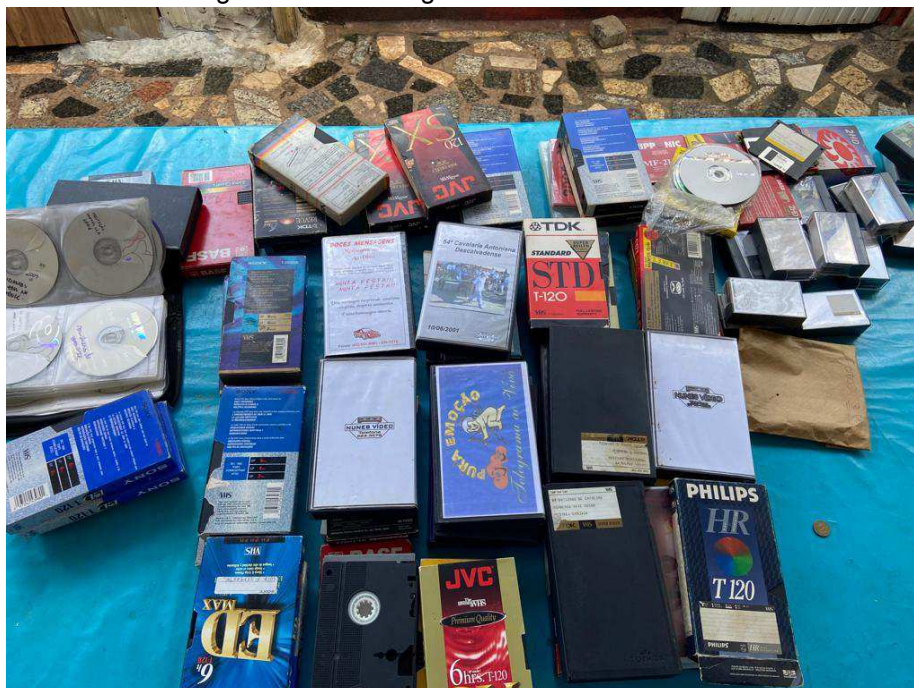
Figura 24: Amostragem do acervo audiovisual