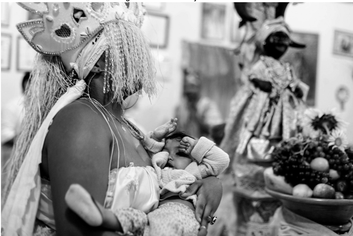
Figura 20 - Nos braços do Órun