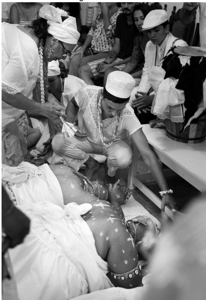
Figura 16: Pawó 36

Fonte: fotografia de Larissa Alvanhan, 2019 - Acervo: Ylê Axé Ôpó Omim.