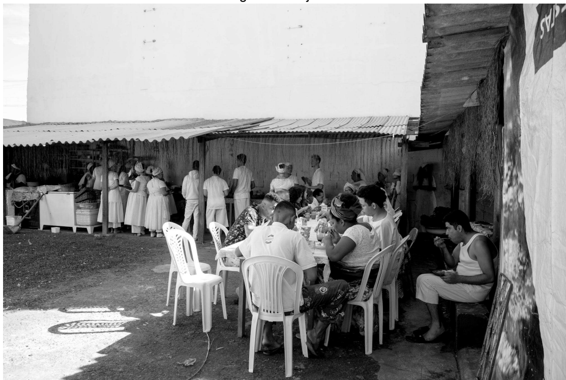
Figura 21 - Ajeum