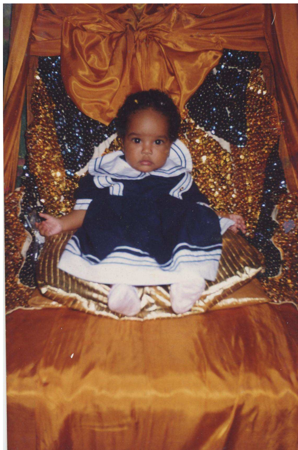
Figura 6: A herdeira

luta financeira, uma conquista e memória viva de uma comunidade em expansão, mas que mantém cotidianamente suas raízes ancestrais!