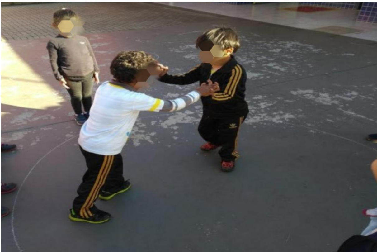
Figura 6: Atividade da cultura corporal: Luta.

melodias e coreografias, possibilitando a expressão dos sentimentos, emoções, sensações e pensamentos, permitindo que a criança adquira a imagem global de seu corpo e a consciência do seu eu, de forma individual, em duplas e em grupos.