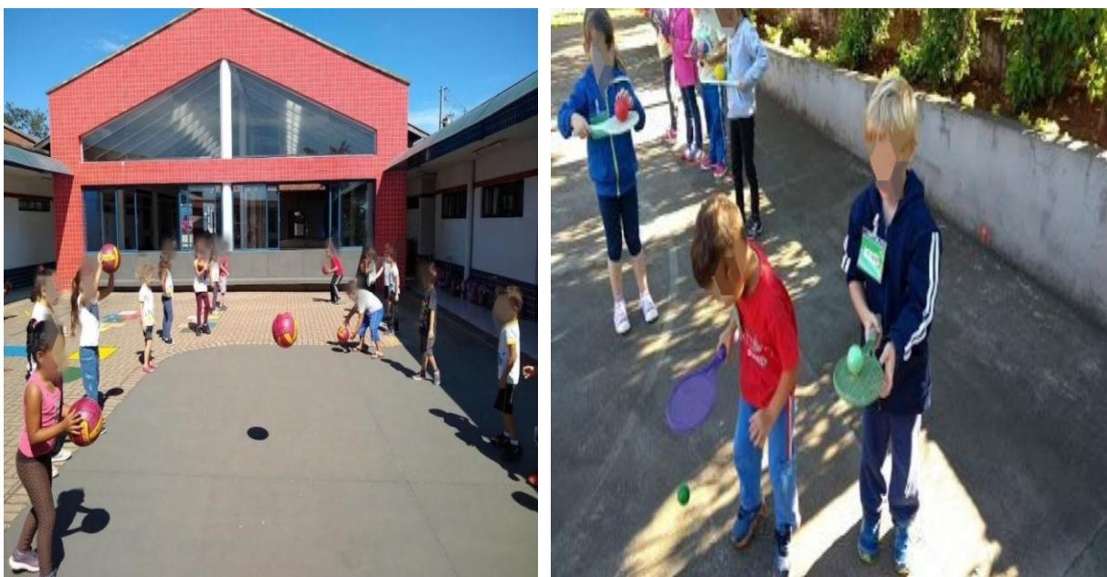
Figura 4: Atividade da cultura corporal: Jogo.

Assim, na Figura 4 tem como objetivo possibilitar à criança a vivenciar o jogo, por meio da brincadeira a manipulação de objetos como bolas e raquete, conhecendo a função social do objeto, as suas características físicas e as possibilidades de realização das ações, potencializando também a coordenação motor global, a coordenação motora óculo-manual, a organização e a orientação espacial.