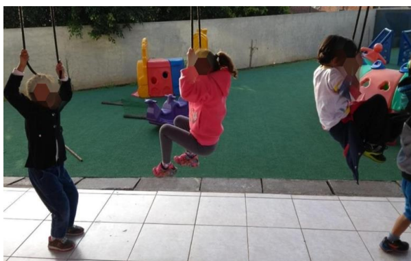
Figura 3: Atividade da cultura corporal: Ginástica.

A Figura 3 apresenta a ginástica como atividade, que tem o objetivo de proporcionar à criança as vivências e experiências de formas de movimentos ginásticos, corroborando com o desenvolvimento da destreza corporal e suas variantes como: posição invertida corporal e rolamentos. Por meio destas atividades, a criança vai apropriando-se da sua consciência corporal no espaço e também das suas limitações, além de potencializar a força muscular de membros superiores, a flexibilidade e o equilíbrio.