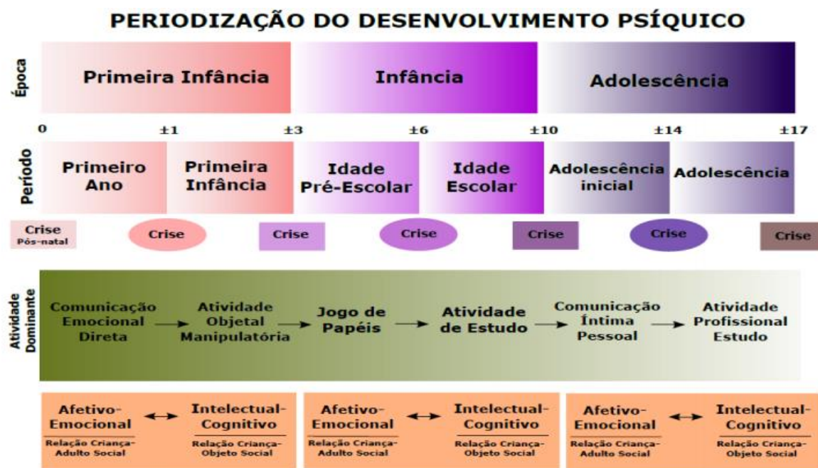
Figura 1: Esquema representativo da periodização do desenvolvimento psíquico.

Elaborado por: Angelo Antonio Abrantes, Departamento de Psicologia, Faculdade de Ciências, UNESP campus Bauru, 2012.