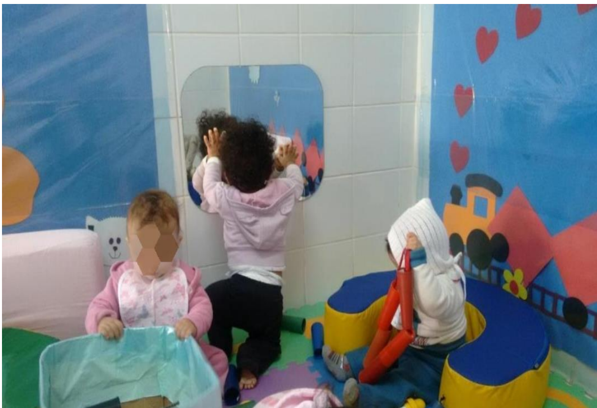
Figura 2: Atividades da cultura corporal: Brincadeiras de percepções sensoriais.