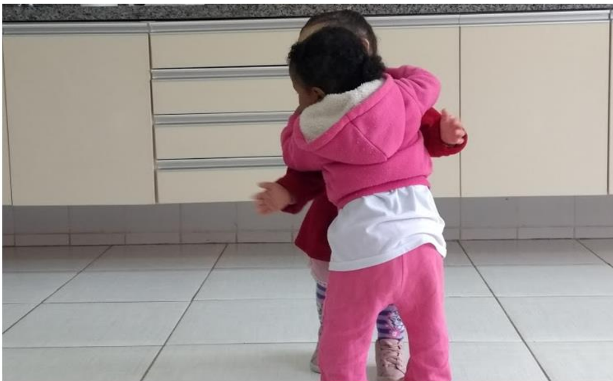
Figura 5: Atividade da cultura corporal: Dança.

Para Elkonin (2009) por meio do jogo é possível promover o desenvolvimento de vários processos psíquicos na criança, a exemplo da percepção e a memória, na transição de formas de pensamento elementares par outras mais elevadas, como de formação de conceitos científicos, desenvolver a independência, a comunicação e sociabilização com outras crianças, impulsionando à aceitação das regras sociais, enriquecendo suas noções acerca do mundo que a cerca, conforme figura 5.