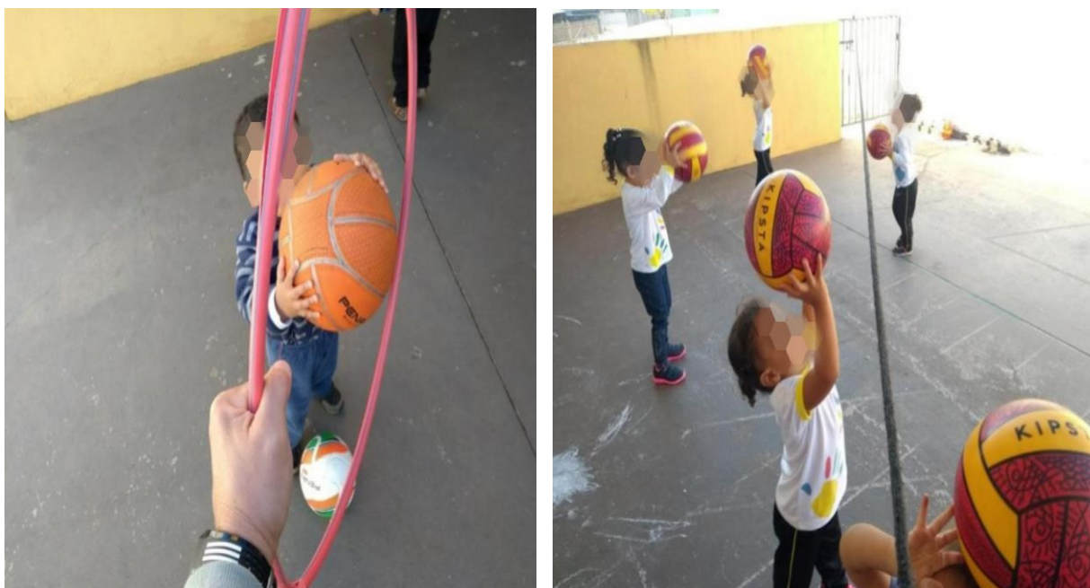
Figura 7: Atividade da cultura corporal: Esporte.