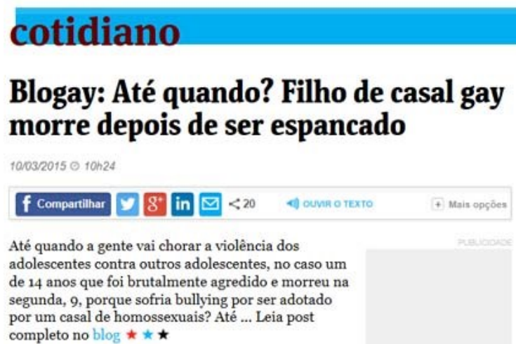
Figura 3 – Texto da coluna “Blogay” com entrada pela Editoria Cotidiano