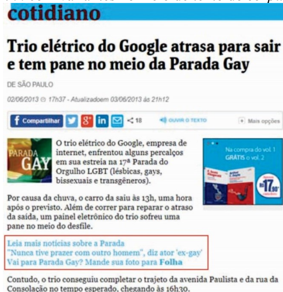
Figura 4 - Link com variantes no meio de texto do corpus da pesquisa