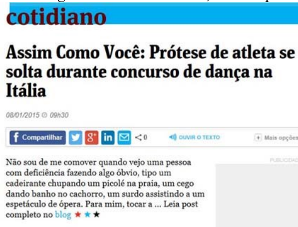
Figura 7 – Exemplo do blog “Assim Como Você”, entrada pela Editoria Cotidiano