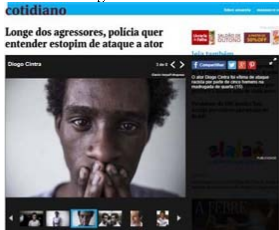
Figura 6 – Exemplo de Álbum Fotográfico referente a evento com temática gay