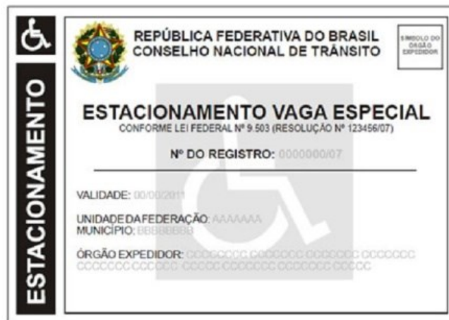
Figura 11 – Símbolo utilizado em cartões de estacionamento para cadeirantes

Soma-se a esse raciocínio o fato de que as vagas especiais para estacionamento de condutores cadeirantes são sinalizadas por um signo imagético que reproduz uma pessoa com deficiência em cadeira de rodas. O símbolo é utilizado em placas verticais para sinalizar vagas especiais de estacionamento, na sinalização horizontal e, também, no cartão de estacionamento das pessoas que têm direito ao benefício. O documento é padronizado pelo Conselho Nacional de Trânsito (CNT) (Figura 11).