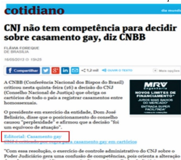
Figura 5 – Link com variante no meio de texto do corpus da pesquisa