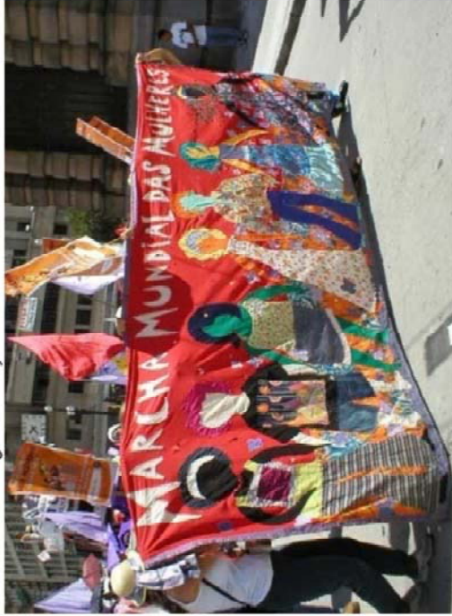
FIGURA 4F - Segunda Edição 2005

http://rejanecapuva.blogspot.com/2011/02/01/ archive.html