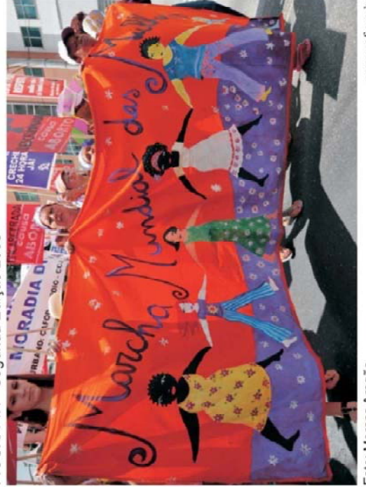
FIGURA 4H - Segunda Edição 2005