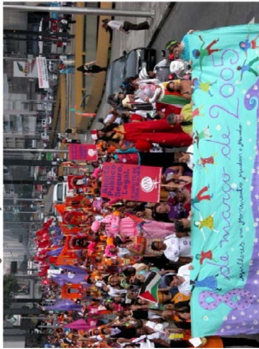
FIGURA 4E - Segunda Edição 2005