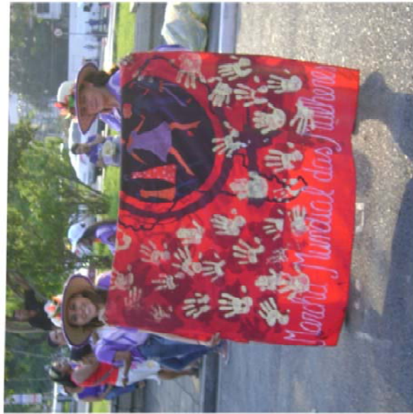
ANEXO 1 A