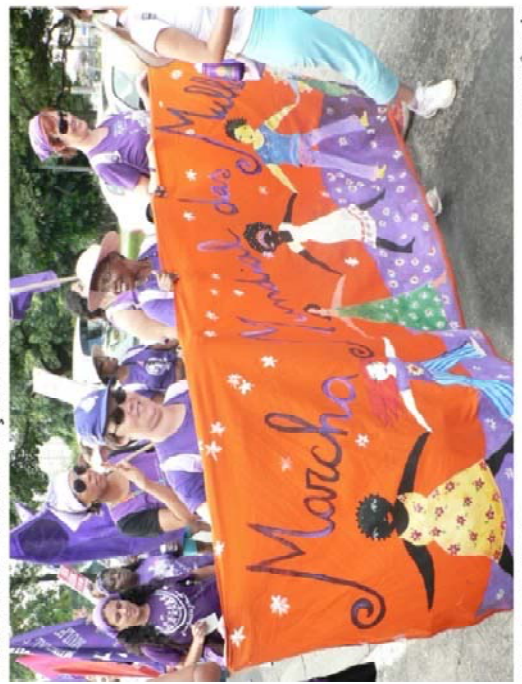
FIGURA 4G - Terceira Edição 2010

http://rejanecapuva.blogspot.com/2011/02/01/ archive.html