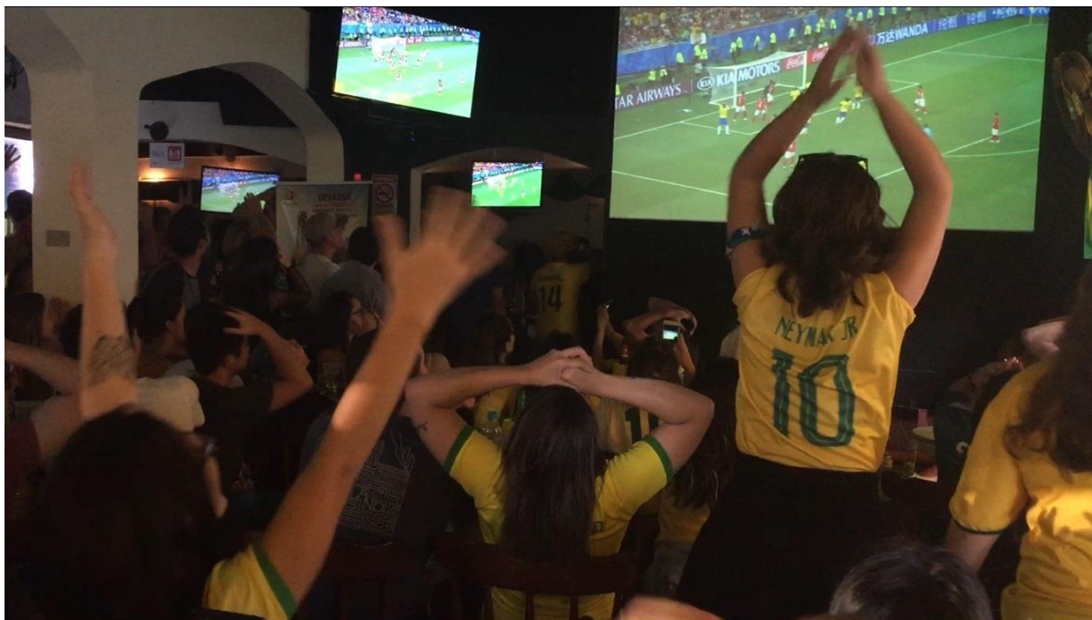
Figura 14. Torcedores da seleção comemorando um quase-gol. Imagem do autor, 2018.