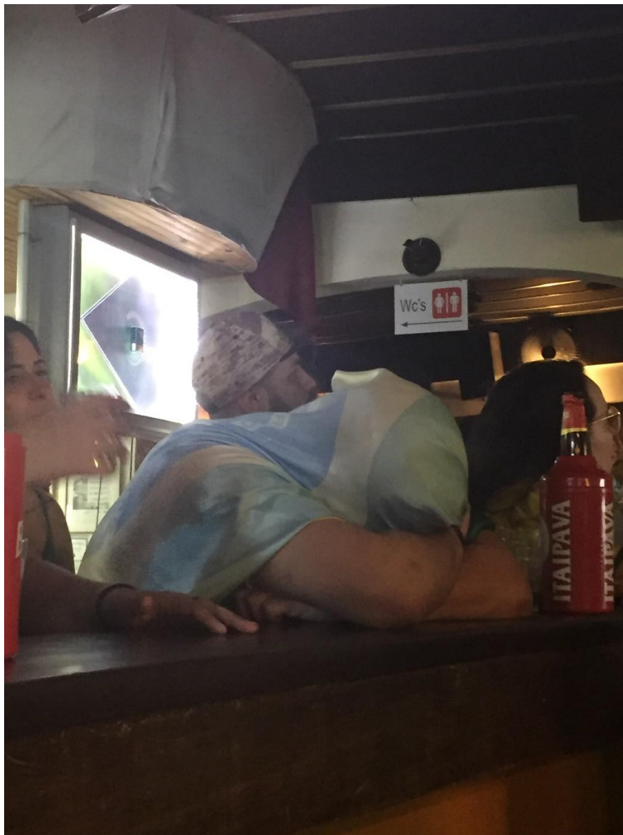
Figura 13. Torcedor escondendo o rosto na desclassificação do Brasil na Copa.