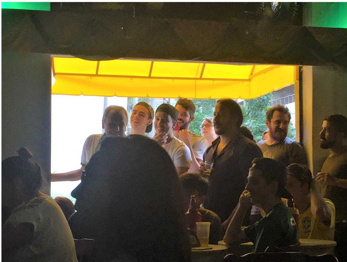
Figura 12. Torcedores assistindo ao jogo pela janela do Bar Brasil.