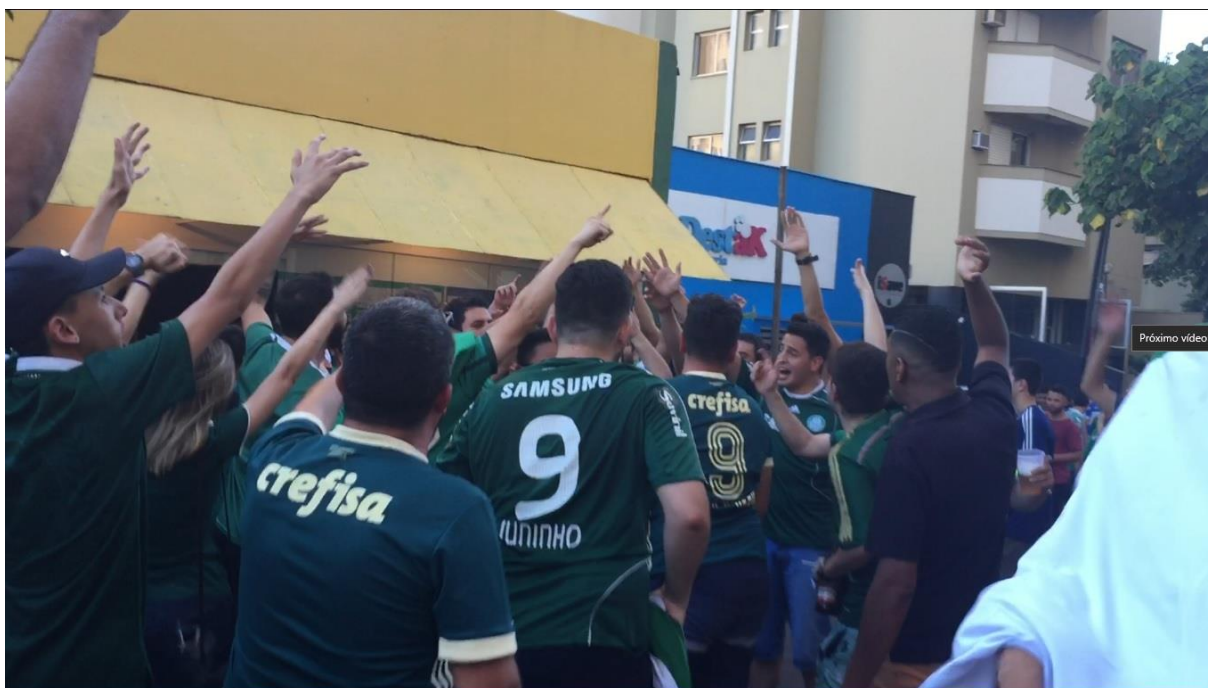
Figura 16. Torcedores do Palmeiras comemorando o título em frente ao Bar Brasil.