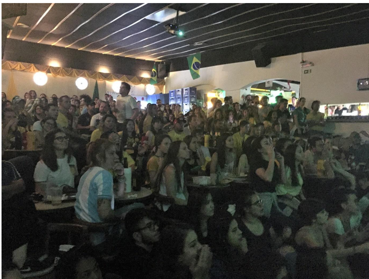
Figura 10. Ala estádio-bar do Bar Brasil cheia durante jogo do Brasil na Copa 2018.