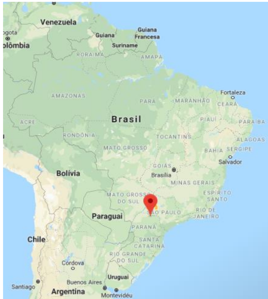
Figura 1. Localização de Londrina no mapa brasileiro.

também se manifesta enquanto um polo educacional, e continua atraindo para a cidade migrações de pessoas de todo estado e de todo o país.