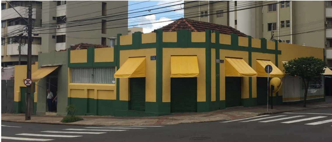
Figura 2. Fachada do Bar Brasil durante o dia. Foto do autor, 2018.

Londrina com os estádios desses times, ou por pessoas interessadas na partida. Neste cenário, o Bar Brasil se configura como o local de maior preferência para os torcedores em Londrina para assistir partidas de futebol. O Bar Brasil é, inclusive, utilizado como ponto de encontro da maior torcida organizada do Londrina Esporte Clube, Falange Azul, quando o time joga longe do Estádio do Café, o estádio da cidade.