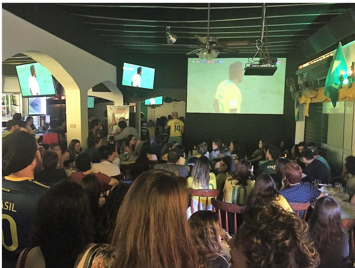
Figura 8. Bar Brasil durante jogo do Brasil na Copa 2018. Imagem do autor, 2018.