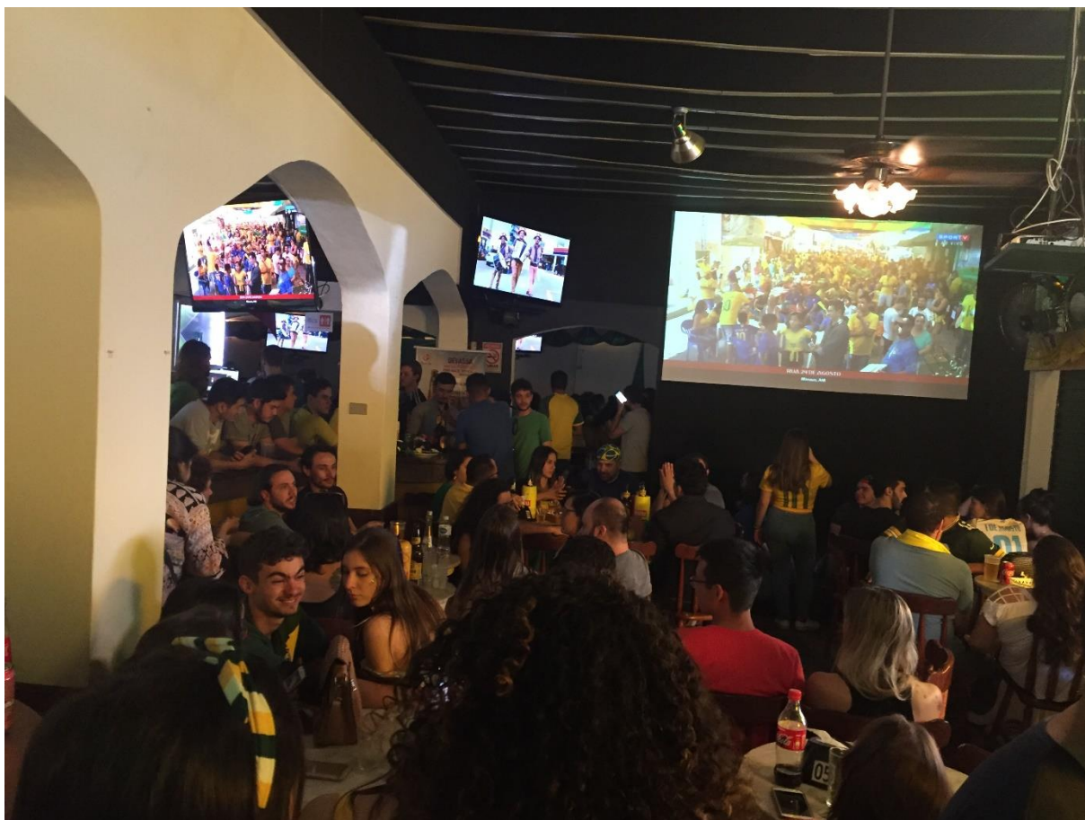
Figura 11. Ala boteco do Bar Brasil pouco antes de jogo do Brasil na Copa 2018. Imagem do autor, 2018.