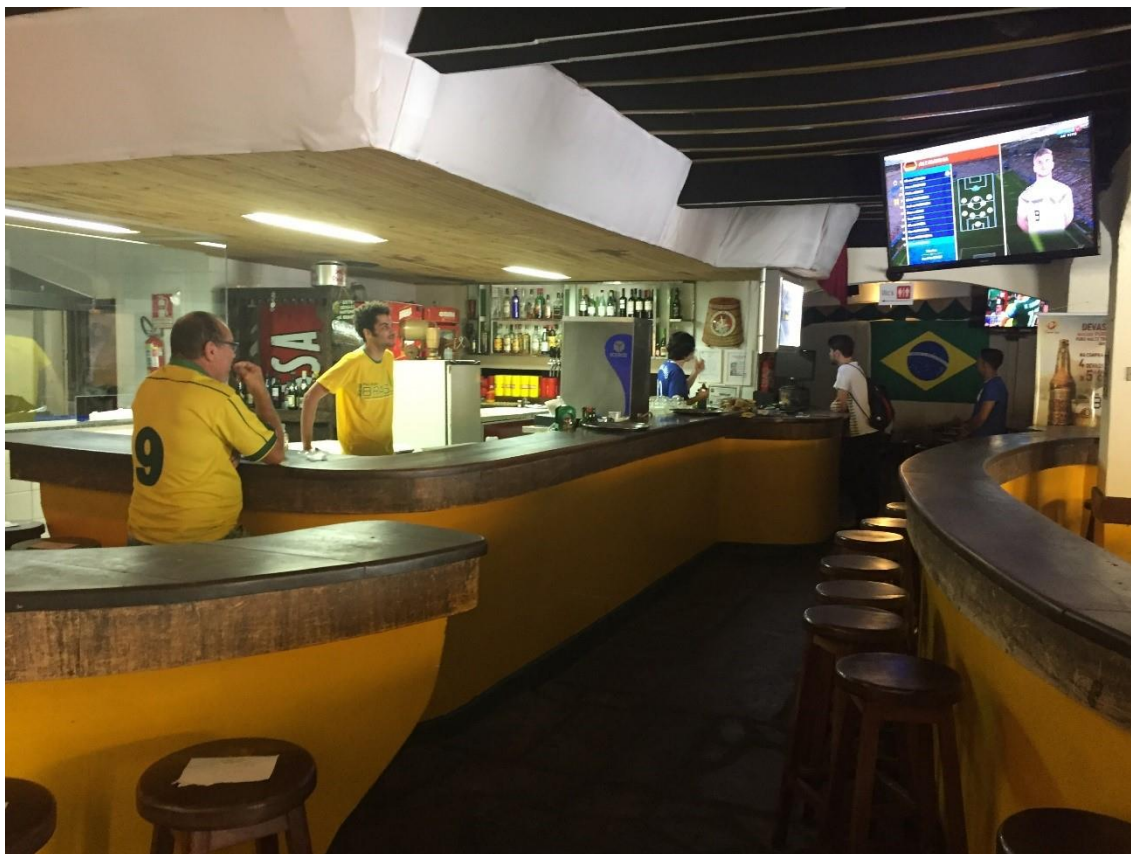
Figura 9. Balcão do Bar Brasil antes de jogo da Copa 2018.