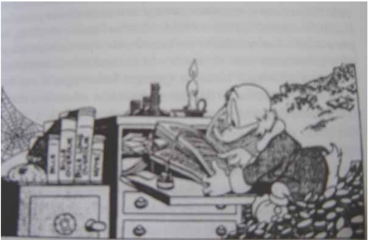
Extraído de Santos (2002)