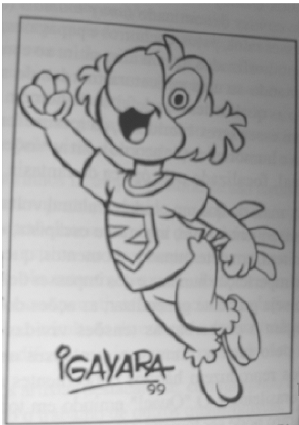
Extraído de Santos (2002)