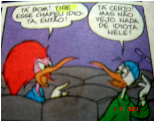
(3) ZC, 2120, 1999, p.50