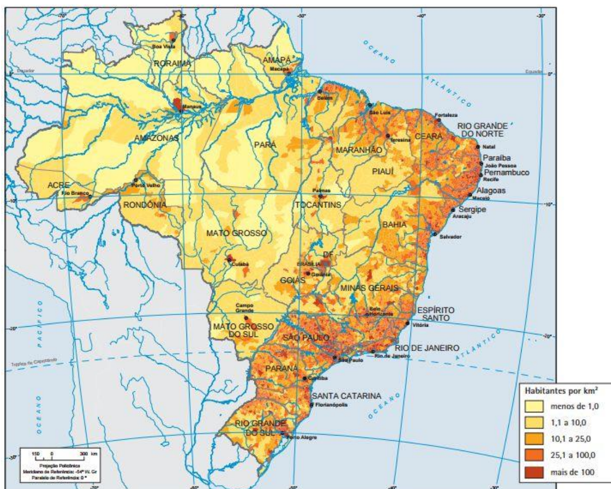
Figura 2 – Densidade Demográfica do Brasil em 2010