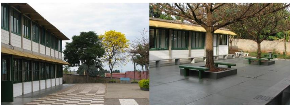
Imagem 3 – Entrada e Pátio da Escola Cecília Meireles

A segunda instituição que implementou a ampliação da jornada escolar é a Escola Municipal Cecília Meireles, localizada no Conjunto Residencial Morumbi, que “[...] iniciou suas atividades em 1994, estando inserida desde a sua fundação, no Centro de Atenção Integral à Criança – CAIC Salomão Jorge Hauly” (CAMBÉ, 2016-2017, p. 8).