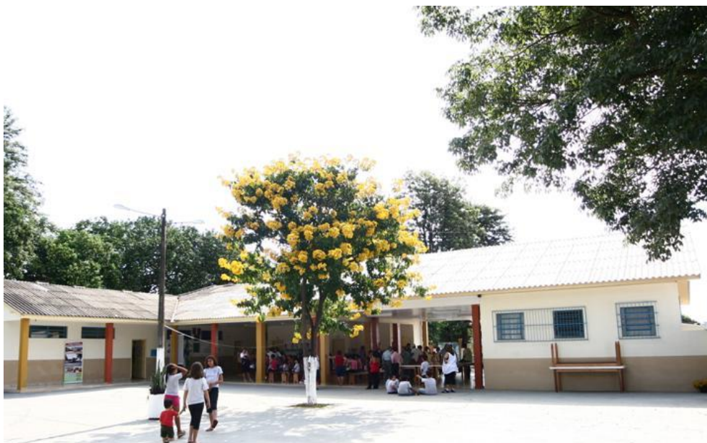
Imagem 4 – Pátio da Escola Santos Dumont

A Escola Municipal Santos Dumont situa-se no Jardim Rivieira, região sudeste da cidade de Cambé, bairro que faz divisa com a cidade de Londrina, atendendo cerca de 450 alunos entre Educação Infantil (4 e 5 anos), Ensino Fundamental e turmas de Contraturno (atendimento exclusivo aos alunos do Ensino Fundamental).