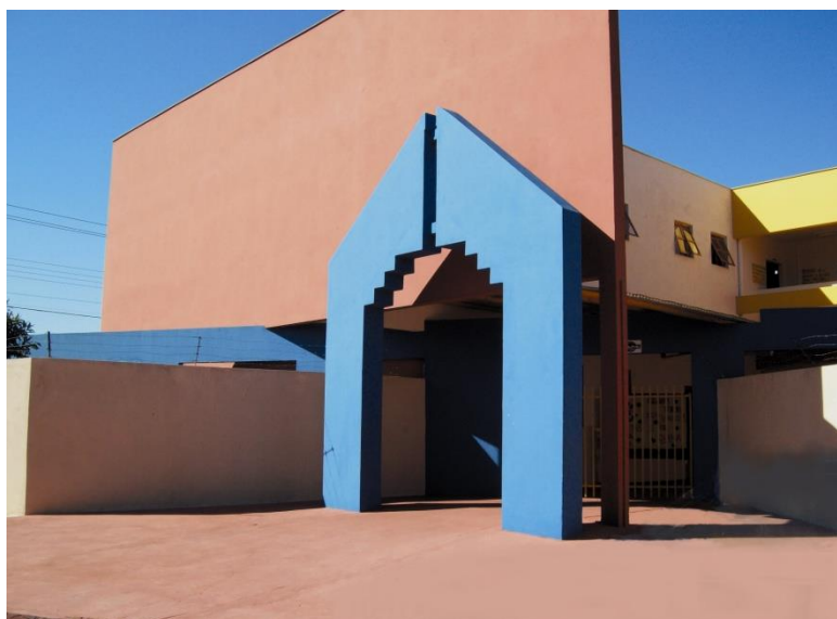
Imagem 2 – Fachada da Escola Pedro Tkotz

A Escola Municipal Pedro Tkotz está localizada no Parque Manella, região próxima ao bairro Santo Amaro.