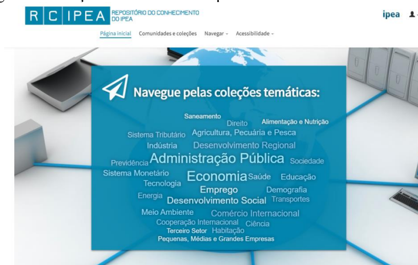
Figura 1- Coleções temáticas do Repositório do Conhecimento do Ipea