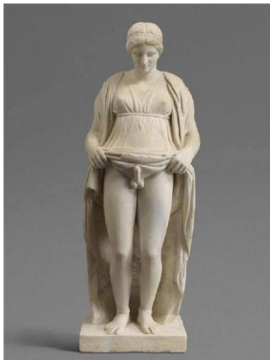
Figura 2: Hermafrodita. Império romano. 27 a.C. –476 d.C. Museu do Louvre.