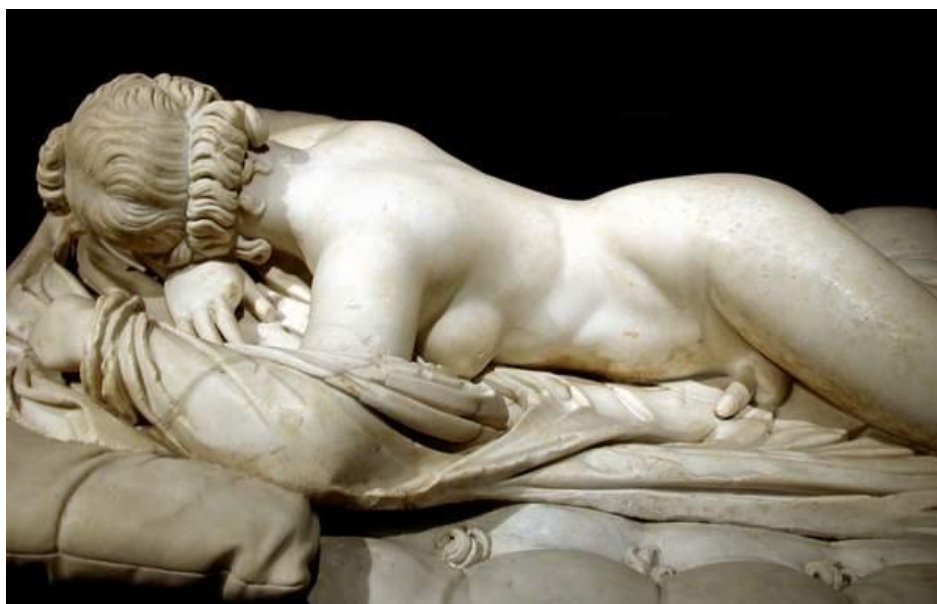
Figura 3: Estatua em mármore de um hermafrodita. Século III a.C.

A cama é um acrescento de Bernini (século XVII). Paris, Museu do Louvre.