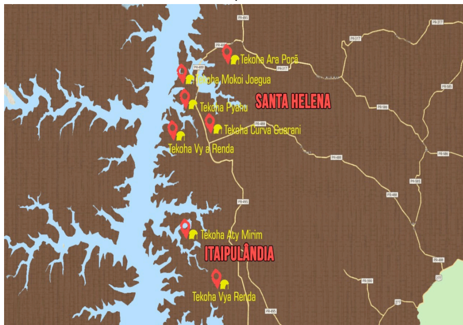
Figura 5: Aldeamentos Indígenas Guarani nos municípios de Santa Helena e Itaipulândia

Fonte: Oguata Porã (2019) apud PORTO, 2019, p.50).