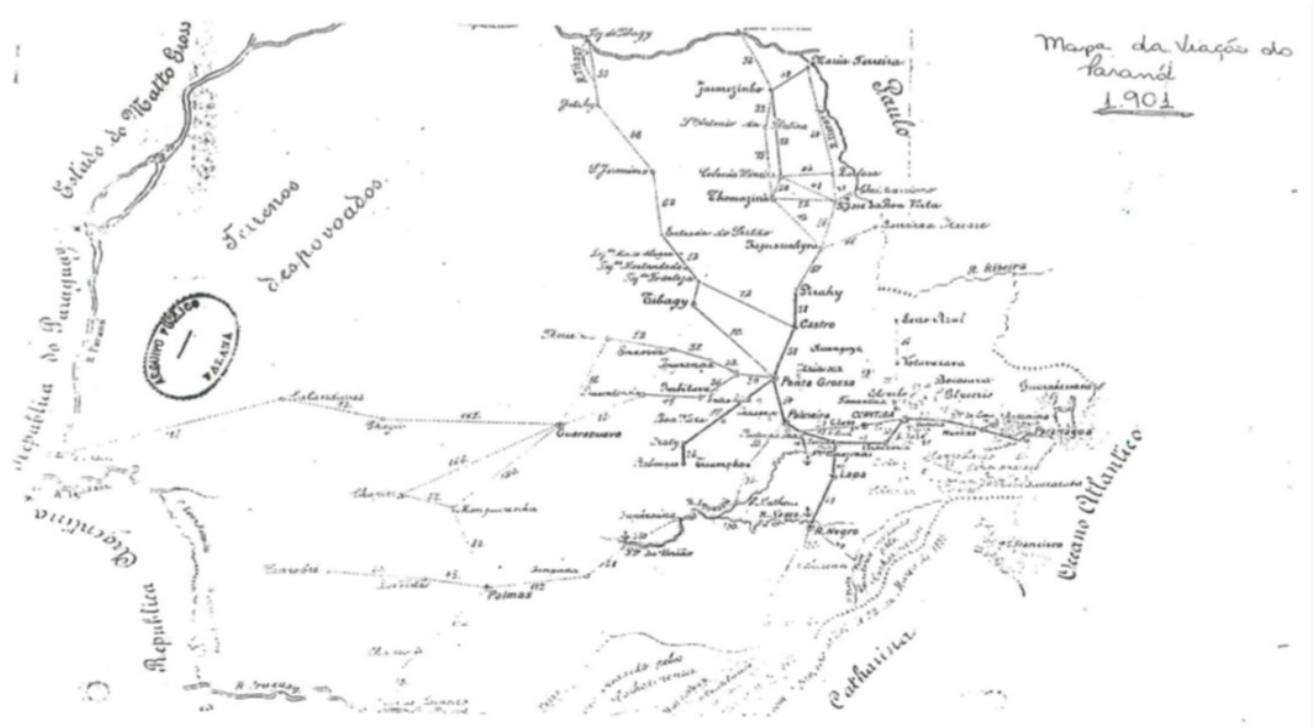
Figura 2: Mapa da ocupação do estado do Paraná do século XX