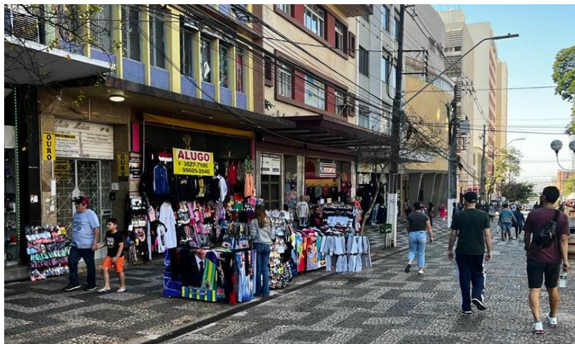
Figura 6 - Avenida Paraná – Calçadão de Londrina

Ao transitar à deriva na cidade, observam-se os novos elementos que interagem com o varejo tradicional, principalmente no deslocamento pelo Calçadão de Londrina. Assim como a Rua Sergipe, igualmente importante artéria comercial, a Avenida Paraná apresenta afetações de dezenas de pontos de vendedores ambulantes informais, reflexo dos impactos econômicos gerados pela pandemia de Covid-19. De acordo com a estimativa apresentada pelo Sindicato do Comércio Varejista de Londrina (Sincoval), a quantidade de trabalhadores informais “cresceu significativamente no último ano, muito além do permitido pelo Código de Posturas do município. São mais de 600 pessoas, entre trabalhadores autorizados e outros com a situação irregular” (MARCONI, 2021).