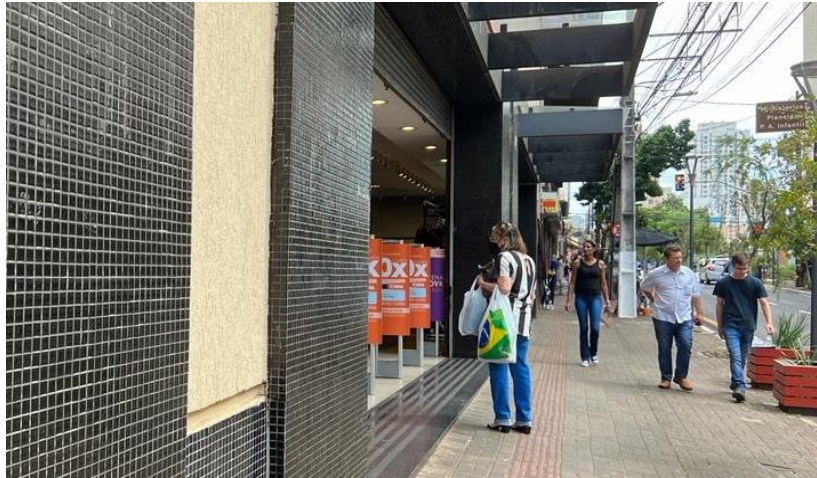
Figura 4 - Em contraponto com a Figura 3, visão do varejo 4 em primeiro plano, sem placas do contexto pandêmico; no meio da imagem, uma mulher faz o uso da máscara, e, do lado direito, transeuntes sem o uso