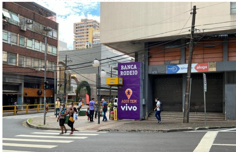
Figura 5 - Alameda Miguel Blasi, esquina com a rua Prof. João Cândido. endereço conhecido por ser o local do Restaurante Rodeio.

Porém, alguns estabelecimentos não conseguiram ou optaram por não dar continuidade aos negócios. Foi o que aconteceu com o Restaurante Rodeio (Figura 5), que, após 54 anos de história, em maio de 2020, fechou e não conseguiu reabrir, devido à pandemia. Famoso pelo seu filé à parmegiana, já recebeu algumas celebridades como a cantora Elza Soares e o apresentador Chacrinha. O espaço, que mantinha os requintes da época do café e era presente no imaginário coletivo dos londrinenses, hoje é mais uma porta fechada, com a placa “aluga-se”, se juntando a muitos outros imóveis no centro de Londrina que não resistiram aos períodos de restrição mais severa. Observa-se na imagem pessoas caminhando com máscara e, ao fundo, as portas fechadas do estabelecimento, que antes da pandemia permanecia aberto de segunda a segunda.