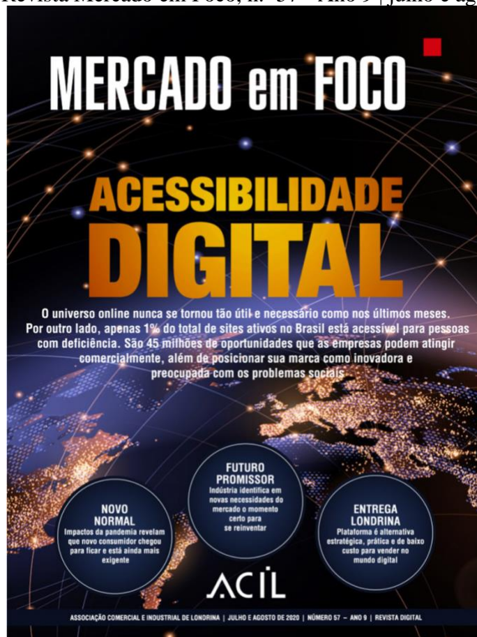
Figura 7 – Revista Mercado em Foco, n.º 57 - Ano 9 | julho e agosto de 2020.

A editoria de conteúdo da revista é um trabalho que acontece com cerca um mês e meio a dois meses de antecedência de sua publicação, e envolve diversos processos, entre eles: pesquisa de pauta, levantamento dos temas, das fontes, o briefing de cada repórter e o desenvolvimento da diagramação. Quando veio a notícia da pandemia, a edição março/abril já estava pronta, pois havia sido editada no final de fevereiro, segundo a assessoria de imprensa da entidade. Até então, o periódico tinha sua publicação híbrida, com tiragem impressa e digital. Com o advento da pandemia, fenômeno que pegou a todos de surpresa, e, diante as incertezas, a Associação avaliou os processos, analisando o cenário, e optou por não realizar a publicação de maio/junho. Nesse período, a entidade formatou a revista para ser 100% digital, voltando com a publicação no quarto bimestre de 2020: julho e agosto | n. 57 - Ano 9, a qual está apresentada na figura 7, a seguir.