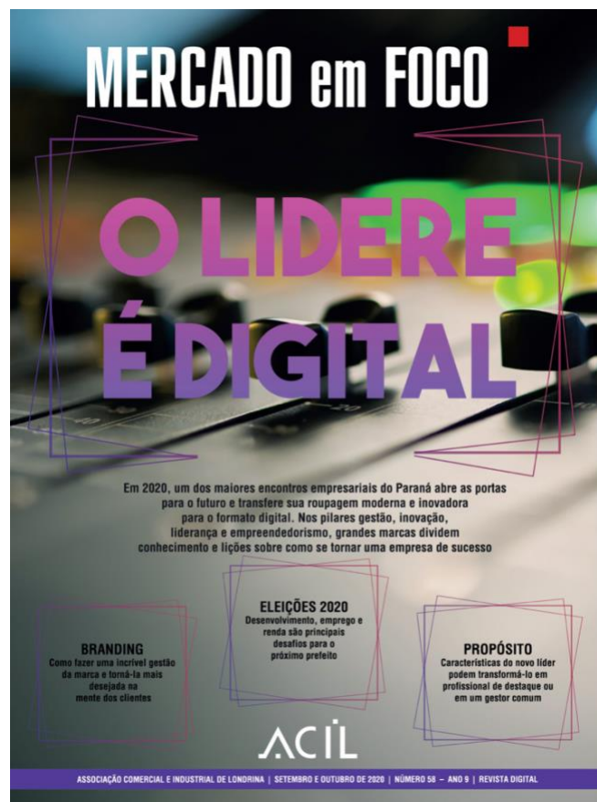
Figura 8 - Revista Mercado em Foco , n. 58 - Ano 9 | setembro e outubro de 2020

A segunda figura a ser analisada é a da capa da publicação n. 58 — Ano 09, dos meses de setembro e outubro de 2020 (Figura 8), a seguir: