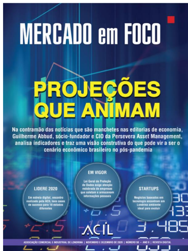
Figura 9 - Revista Mercado em Foco , n. 59 - Ano 9 | novembro e dezembro de 2020

A revista n. 58 apresentada traz menos referências ao momento pandêmico. A comunicação focou em apresentar temas mais voltados à gestão e aos projetos, acontecimentos que mostram otimismo mesmo diante de uma situação delicada, mas que já havia sido absorvida pela condução do comércio, em relação aos aprendizados do lockdown , por exemplo, como relatou o Lojista 1, no capítulo das entrevistas: “Nós tínhamos um cuidado grande com o uso de luvas, máscaras, álcool em gel, álcool líquido e os utensílios, todos higienizados. Colocamos o distanciamento nas balanças e a sinalização no chão para o distanciamento” (ACIL 2022b). Nesse período do ano, após aproximadamente cinco meses de pandemia, o comércio havia adquirido algumas ações de proteção na sua permanência sistêmica. A última capa a ser analisada está disposta na figura 9; trata-se da edição n. 59, referente aos últimos meses de 2020, novembro e dezembro.