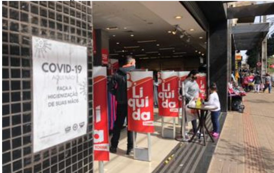
Figura 3 - Visão do varejo: em primeiro plano, placa comunicando a solicitação de higienização das mãos; ao fundo, à direita da imagem, mulher e criança fazendo uso de álcool em gel e máscaras

A preocupação em manter o comércio em funcionamento era paralela à conduta de informar sobre as obrigatoriedades do combate à pandemia. Na Figura 3, o texto preso à parede comunica a ação de higienização das mãos; logo, ao fundo, duas pessoas fazem uso de álcool em gel. Não foram observados signos proibitivos à entrada de menores de 12 anos. Ainda na figura 3, nota-se informações textuais de liquidação, símbolo da publicidade que visa incitar os usuários para o consumo, além de placas de higienização das mãos, uso de máscaras e ainda algumas informações arquitetadas e à disposição de suas vitrines, convidativas para o consumo.