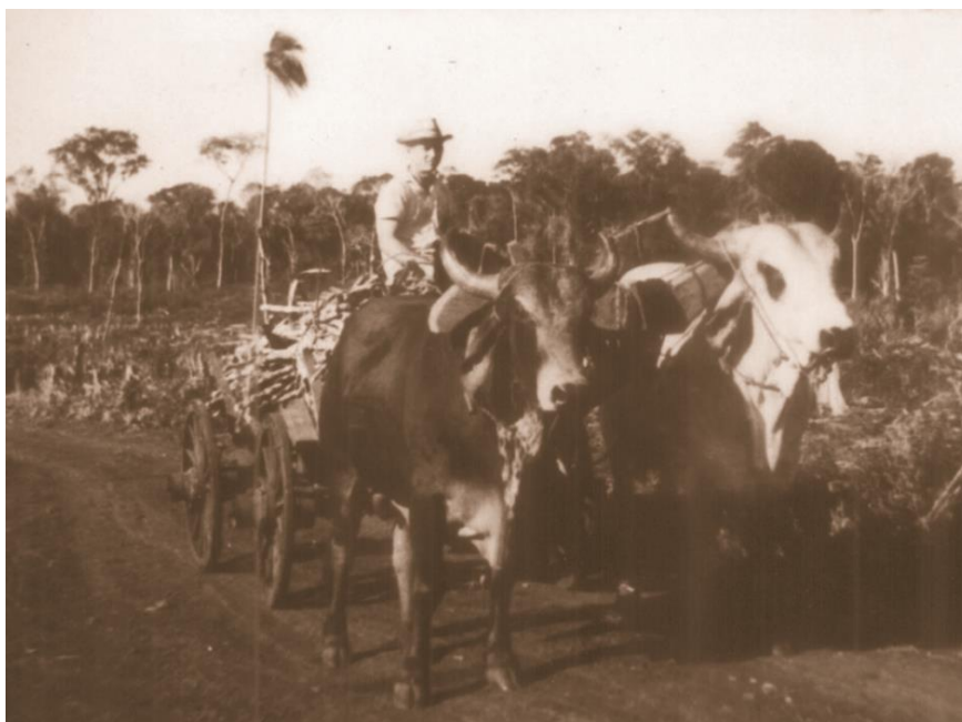
Figura 25 - Valdir Heindrickson na localidade de Esquina Gaúcha, em 1968