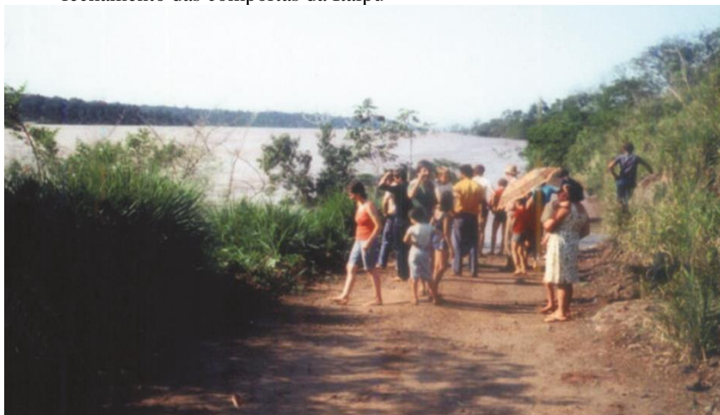
Figura 26 - Famílias acompanhando de perto a subida das águas do Rio Paraná, logo após o fechamento das comportas da Itaipu