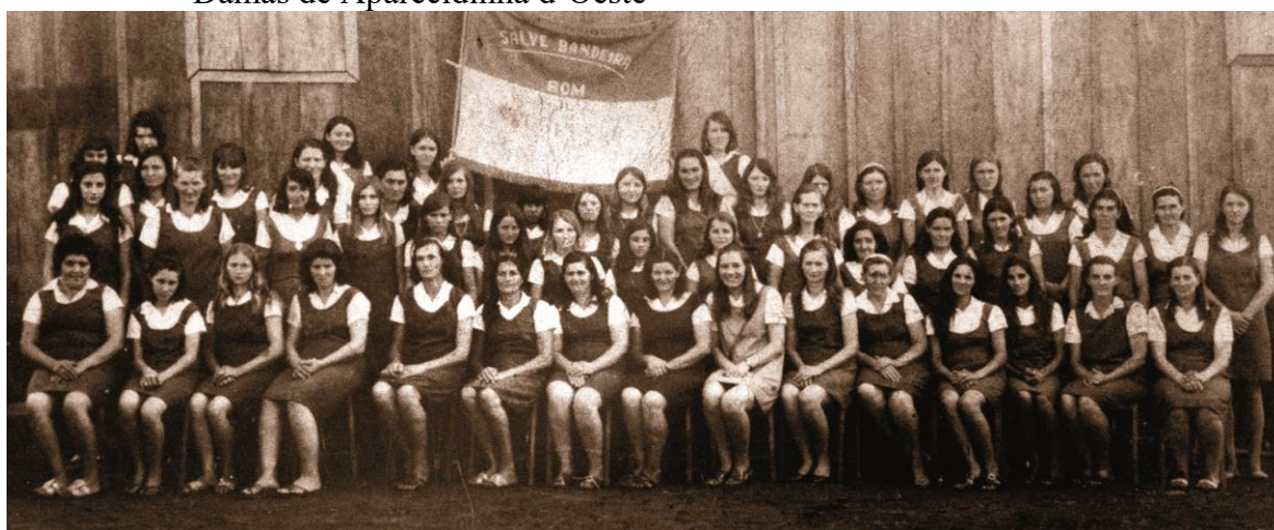
Figura 17 - Sociedade de Damas Bom Progresso no ano de 1971: primeira Sociedade de Damas de Aparecidinha d'Oeste