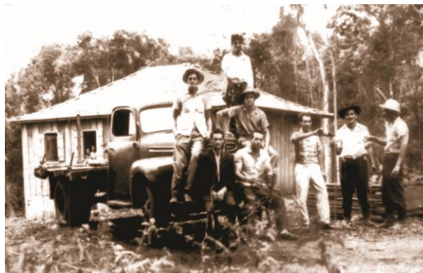
Figura 2 - Primeira casa do comércio construída em Itacorá

Fonte: Acervo familiar. Aatoria: Waldomiro Klos. Data: 1962