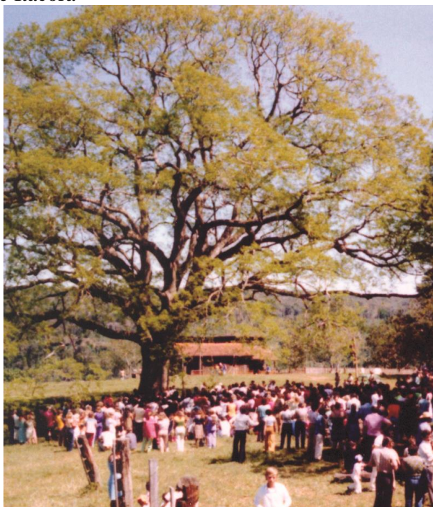
Figura 27 - Timbaúva (árvore da morte), localizada próximo à barranca do Rio Paraná, no distrito de Itacorá