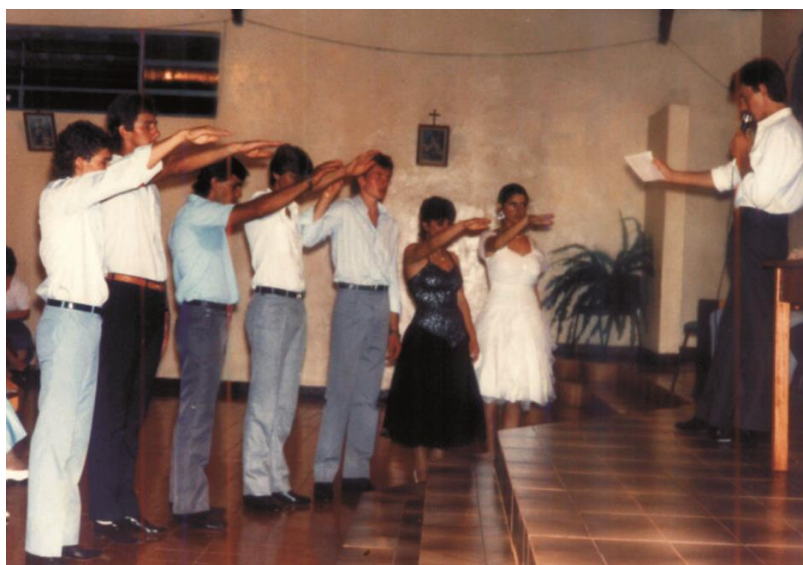
Figura 13 - Segunda turma de concluintes do curso técnico em contabilidade, no ano de 1987, gestão Albino Bissoloti