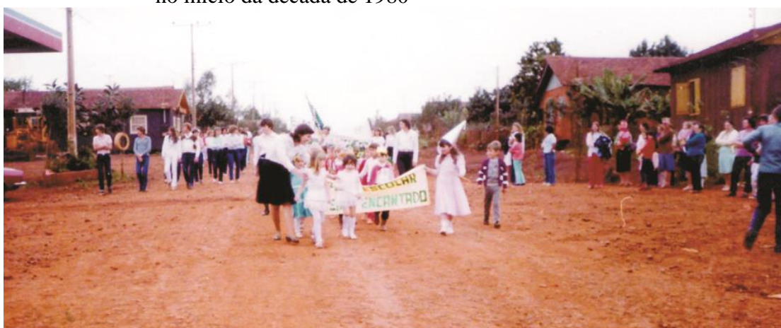
Figura 22 - Desfile cívico ocorrido na Avenida Tiradentes, em Aparecidinha d'Oeste, no início da década de 1980