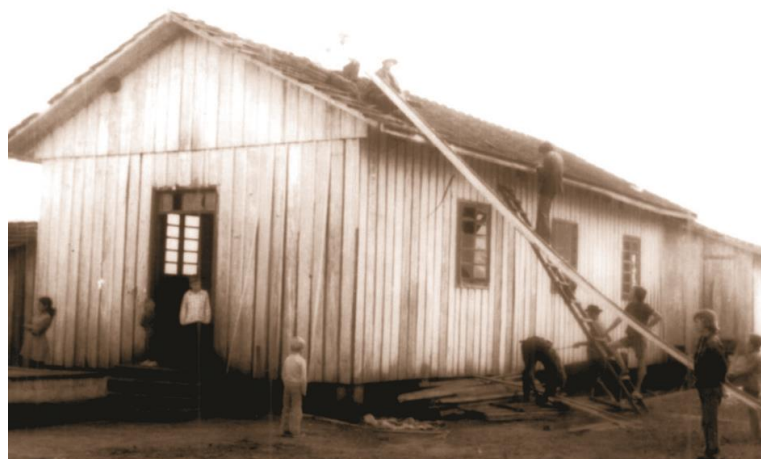
Figura 16 - Igreja Católica do distrito de Itacorá sendo desmanchada para construção de outra mais ampla