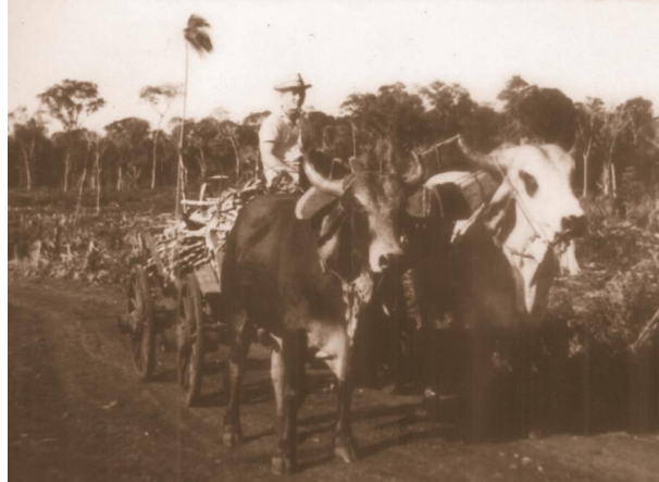
Figura 1 - Transporte no período de colonização

Fonte: SCARPATO; BOHM (2006). Sem autoria. Data: 1968