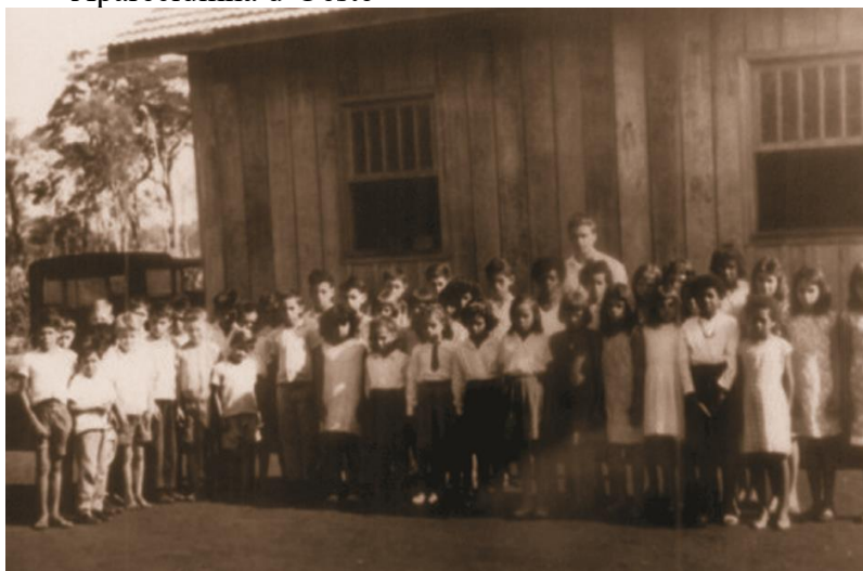
Figura 14 - Escola Municipal Carlos Gomes durante a década de 1970, em Aparecidinha d'Oeste