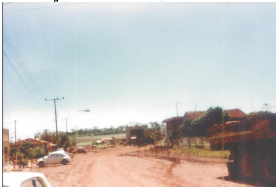
Figura 24 - Rua Rui Barbosa, na década de 1980