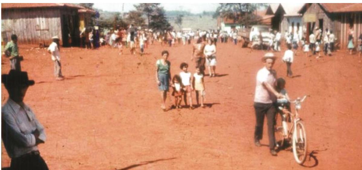
Figura 23 - São José do Itavó no auge do ciclo da hortelã durante a década de 1970