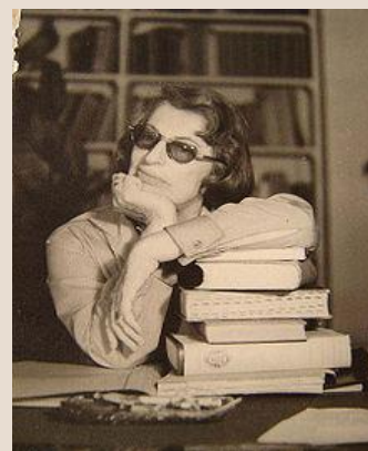
Imagen 3: Silvina Ocampo

Disponible en: < https://upload.wikimedia.org/wikipedia/commons/thumb/9/94/Silvina-tomado-por-Bioy-Casares-en-Posadas-1959.jpg/220px-Silvina-tomado-por-Bioy-Casares-en-Posadas-1959.jpg >. Accedido el: 28 sep. 2015.