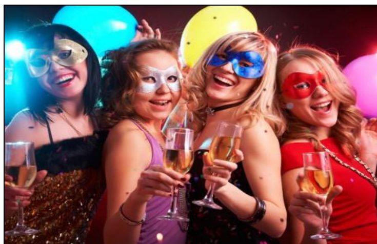
Imagen 2: Máscaras

Disponible en: < http://cumpleparty.com/wp-content/uploads/2012/10/fiesta-disfraces-474x356.jpg >. Accedido el: 25 sep. 2015.