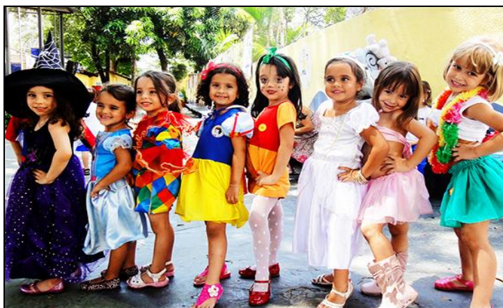
Imagen 1: Disfraces infantiles

Disponible en: < http://cumpleparty.com/wp-content/uploads/2012/10/fiesta-disfraces-474x356.jpg >. Accedido el: 25 sep. 2015.