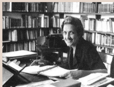
Imagen 5: Cecília Meireles