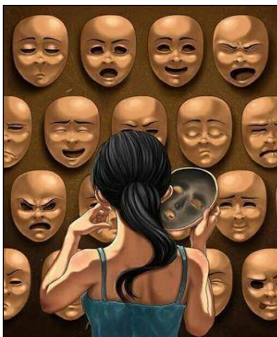
Imagen 6: Muchacha con máscaras

Disponible en: < https://s-media-cache-ak0.pinimg.com/736x/67/a9/4e/67a94e63ab668868f49443c05aa1925e.jpg > Accedido el: 23 sep. 2015