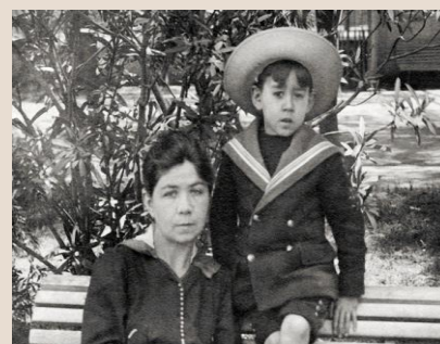
Imagen 4: Alfonsina y su hijo Alejandro.

STORNI, Alfonsina. En: Languidez , 1920. Disponible en: < http://cvc.cervantes.es/actcult/storni/antologia/antologia10.htm > Accedido el: 20 set. 2015.