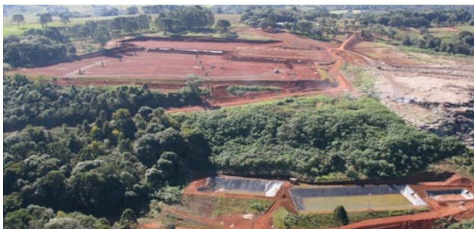
Foto 3 – Aterro Sanitário de Guarapuava (no alto, à esquerda), o Lixão (no alto, à direita), lagoas de decantação do chorume (abaixo).

A maior parte desses resíduos não era devidamente separada, outra parte era jogada nas ruas, nas calçadas e nos terrenos baldios sem a menor preocupação. A partir de maio de 2011, os resíduos recolhidos passaram a ser levados para o Aterro Sanitário Municipal, onde começaram a ser depositados. Mas nem sempre houve o aterro, e por cerca de 40 anos todo o lixo da cidade era jogado no Lixão Municipal, que coincidentemente localizava-se ao lado do local onde se situa o atual Aterro. É a respeito desse assunto e de outros ligados a ele, entendidos aqui como a “questão do lixo” em Guarapuava, que objetivamos refletir.