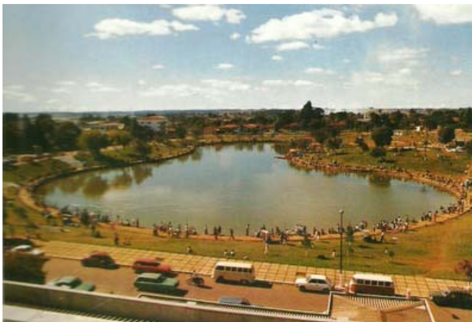
Foto 1 – Lagoa das Lágrimas vista do alto do Hospital São Vicente – Guarapuava (1977)