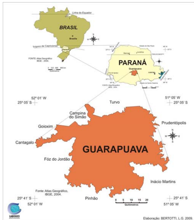
Mapa 3 – Localização do Município de Guarapuava-Pr

Guarapuava é a cidade sede do município de mesmo nome localizado na região centro-oeste do estado do Paraná, região sul do Brasil.