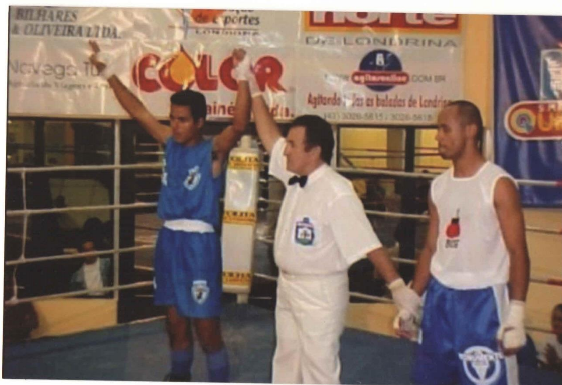
Imagem 11 – Combate no Shopping Quintino. Anúncio do vencedor.