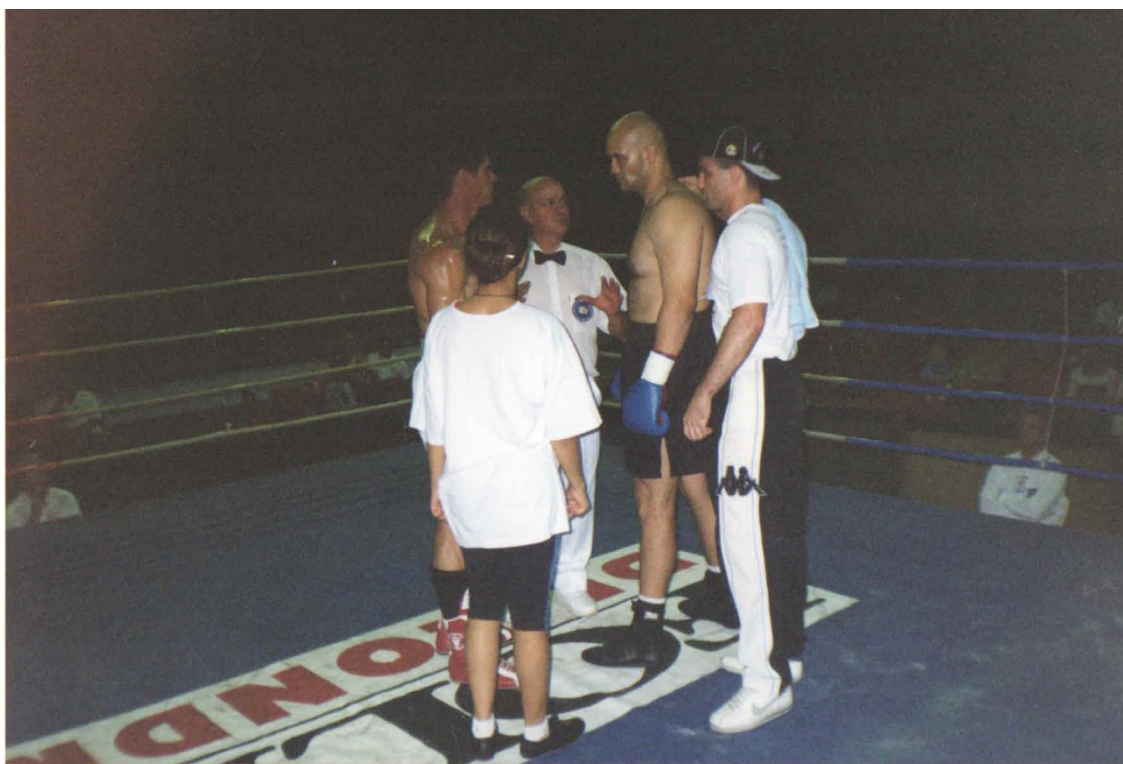
Imagem 8 – Intimidação, uma forma de pré-combate.