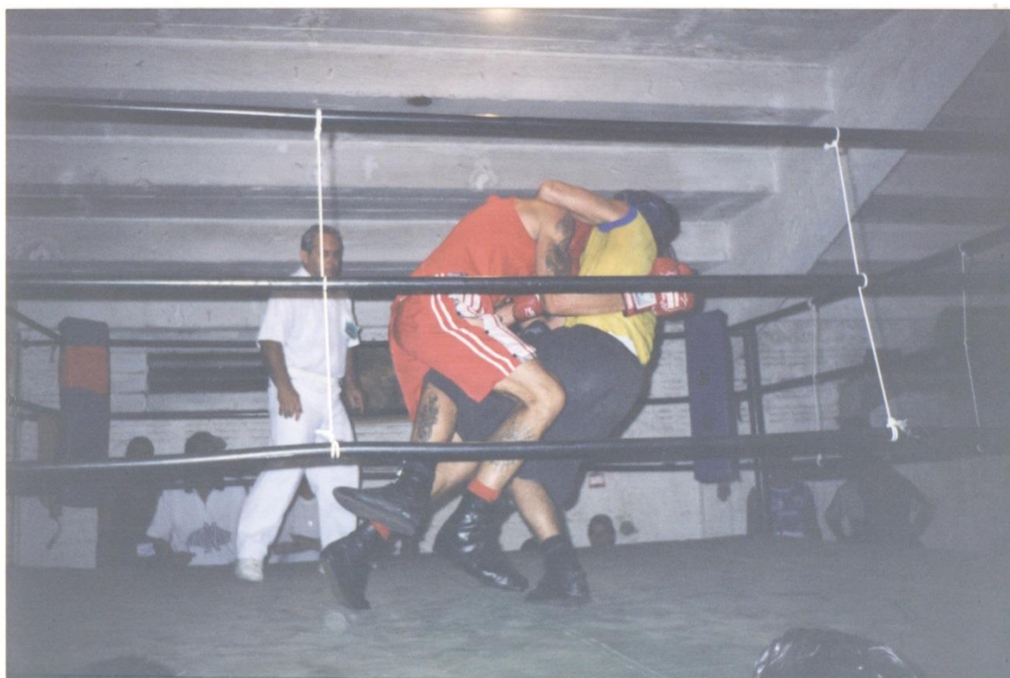
Imagem 10 – Infração cometida durante uma competição amadora na Escola de Boxe.

Fonte: Coleção da Escola de Boxe do LEC/FPP. 1 fot., 10,27x15 cm. Fotógrafo desconhecido, entre 1994 e início da década de 2000.