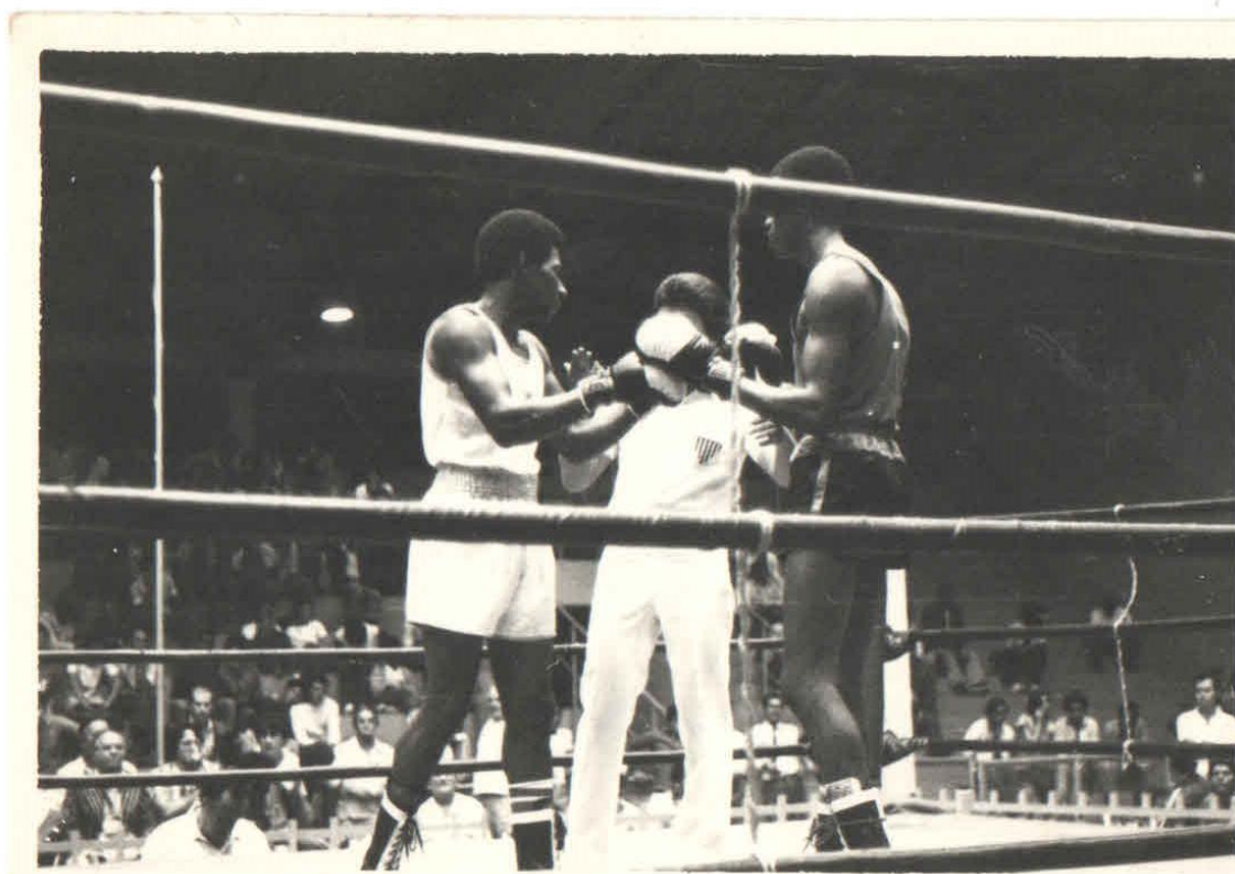
Imagem 6 – Campeonato brasileiro de boxe. Londrina, 1977.