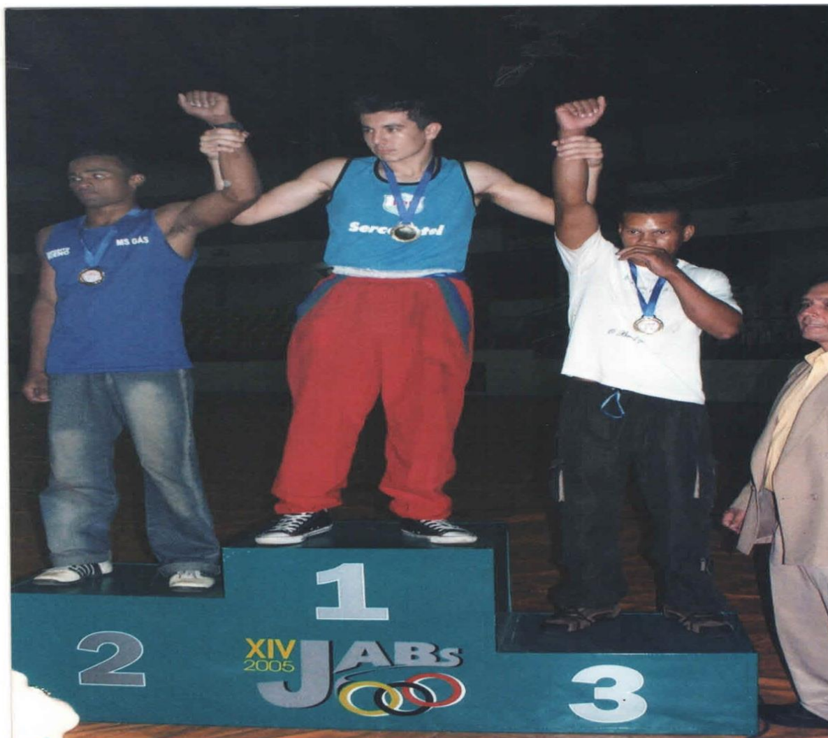
Imagem 12 – Resultados do XIV JABS.