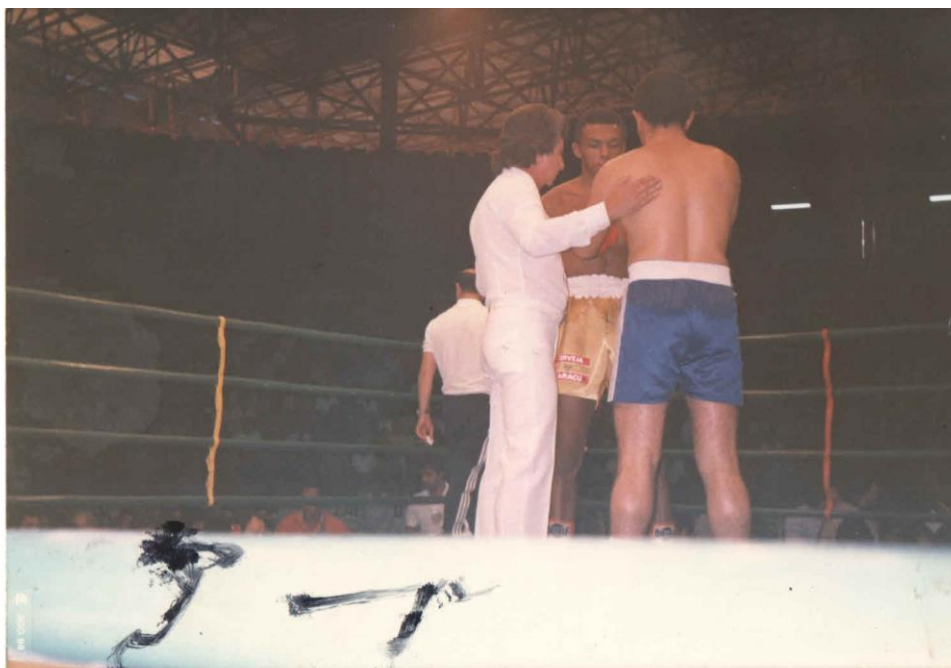
Imagem 7 70 – “Cumprimentem-se e lutem”.

Fonte: Coleção da Escola de Boxe do LEC/FPP. 1 fot., 8, 94x12, 8 cm Fotógrafo desconhecido, 1984.