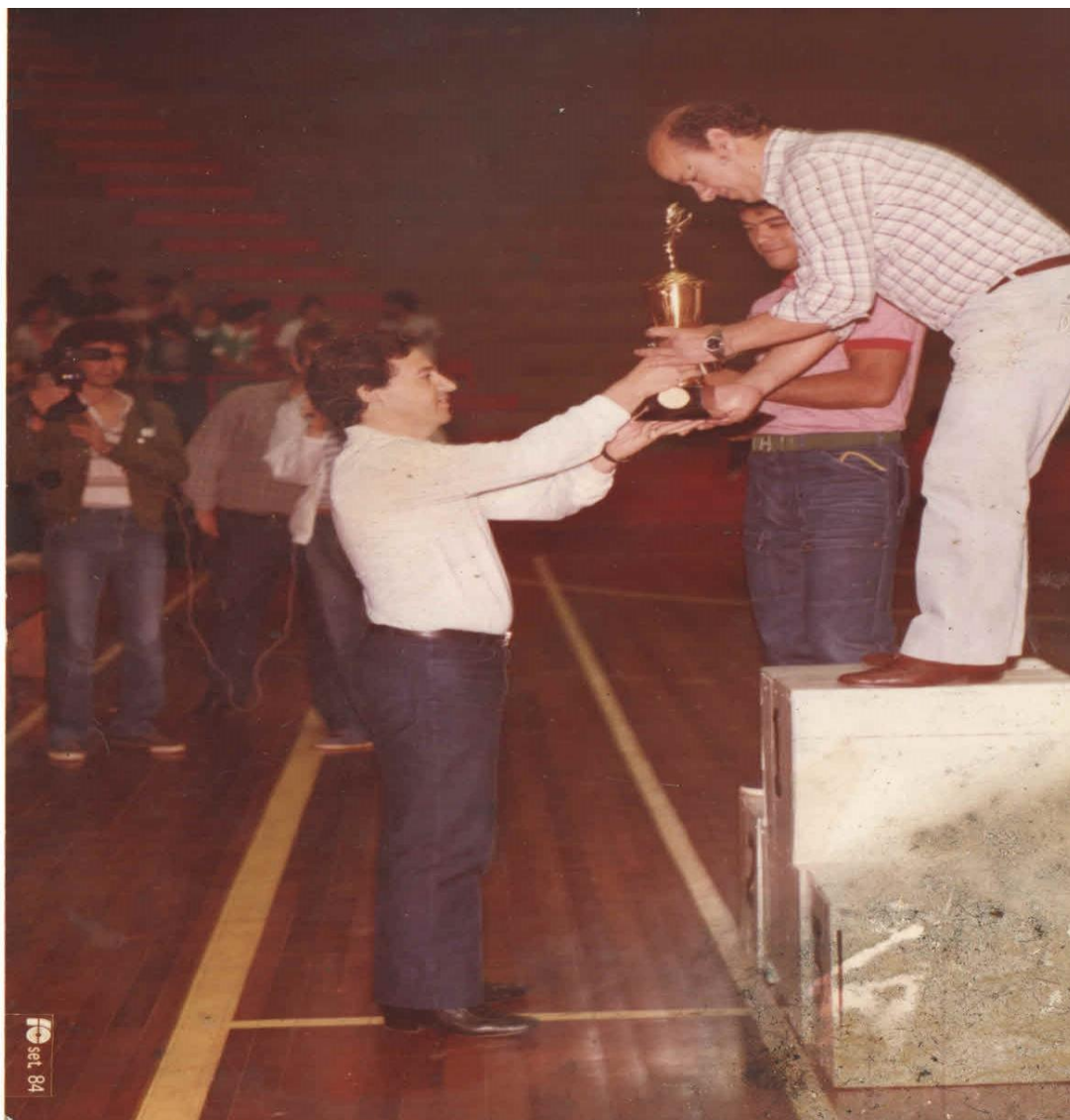
Imagem 13 – Resultados dos Jogos Abertos de 1984.