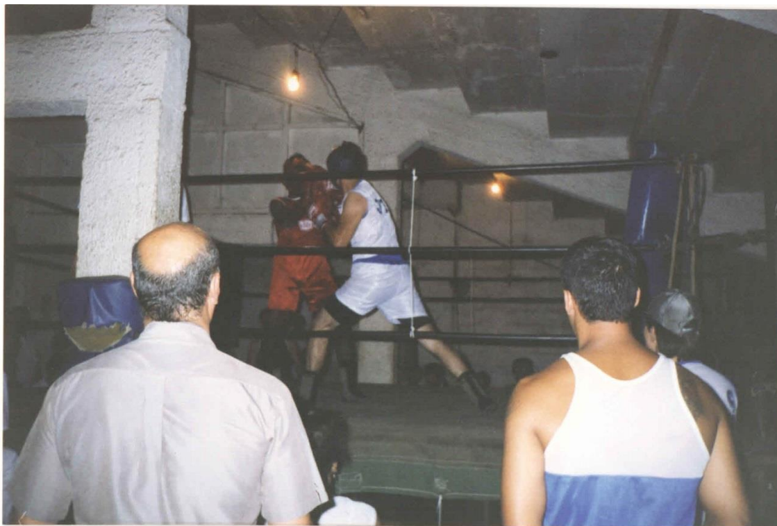
Imagem 9 – Luta amadora na Escola de Boxe.