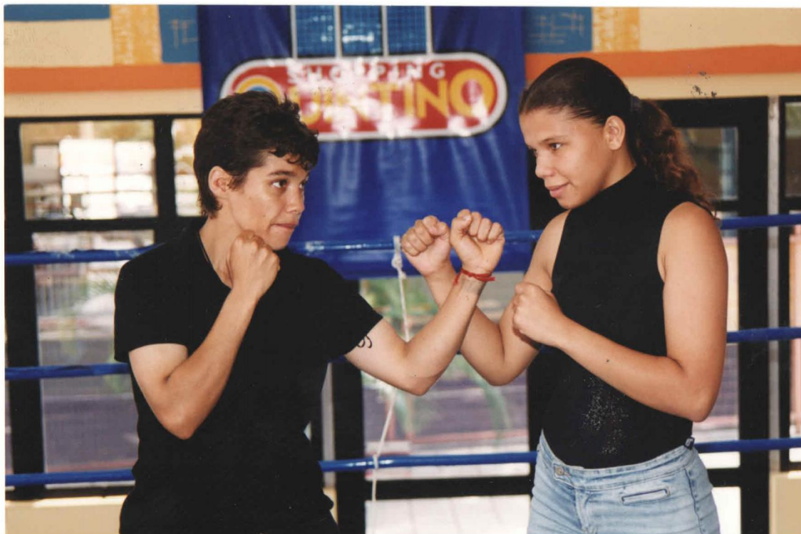
Imagem 5 – Boxe feminino no Shopping Quintino, Londrina.

Fonte: Coleção da Escola de Boxe do LEC/ FPP. 1 fot., 10,6x15 cm. Fotógrafo desconhecido, década de 2000.