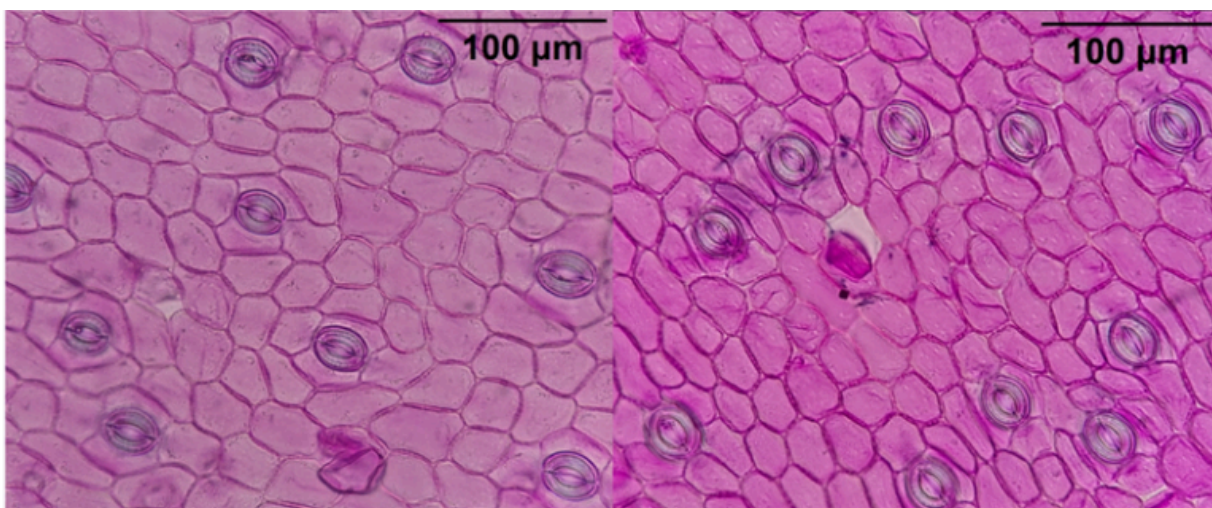
Figura 1 - Estômatos anomocíticos observados em folhas de indivíduos de Gomesa flexuosa (Lodd) M.W.Chase & N.H.Williams.

Dentre os grupos analisados foi observado que os estômatos em G. flexuosa são, predominantemente, anomocíticos (Figura 1) pela ausência de células subsidiárias com padrão de formato, tamanho ou posição específicos, sendo distribuídas de maneira irregular (METCALFE; CHALK, 1950 apud APPEZZATO-DA-GLÓRIA; CARMELLO-GUERREIRO, 2012). Porém, foram encontrados, eventualmente, estômatos que podem ser caracterizados como paracíticos, pela presença de duas células subsidiárias posicionadas de forma que seu eixo longitudinal fique paralelo ao ostíolo (Figura 2). Por fim, as células-guarda são tipicamente reniformes e não houve a observação de estômatos na região foliar adaxial (Figura 3), sendo caracterizadas como hipoestomáticas (APPEZZATO-DA-GLÓRIA; CARMELLO-GUERREIRO, 2012).