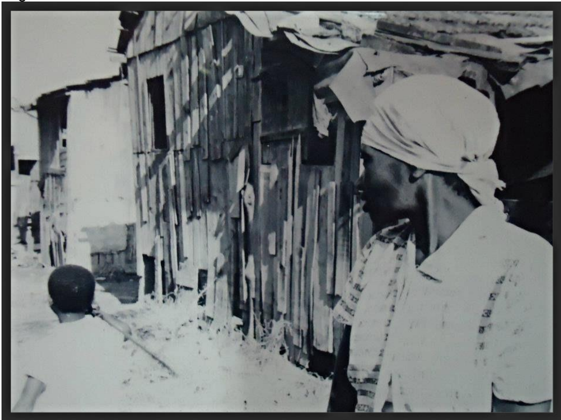
Figura 1 - Carolina Maria de Jesus na favela do Canindé

A figura que apresentamos a seguir, selecionada dentre as inúmeras representações de Carolina Maria de Jesus na favela contidas no portal biobibliográfico da autora 2 promove a captura dos três componentes da paisagem a que se refere Collot (2013): o local, a favela do Canindé; o olhar, forte e expressivo, mas carregado de candura; e uma imagem, crua e impactante, como reflexo da interação entre sujeito e território.