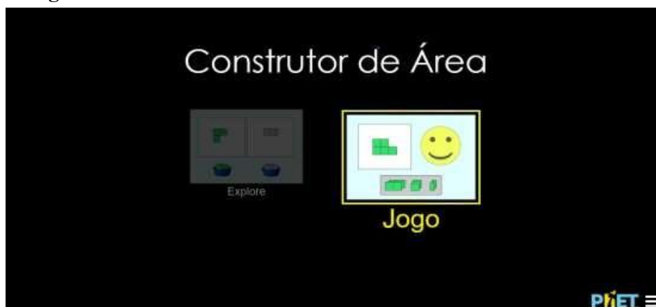
Figura 1 – Tela inicial das duas atividades do OA “Construtor de Área”