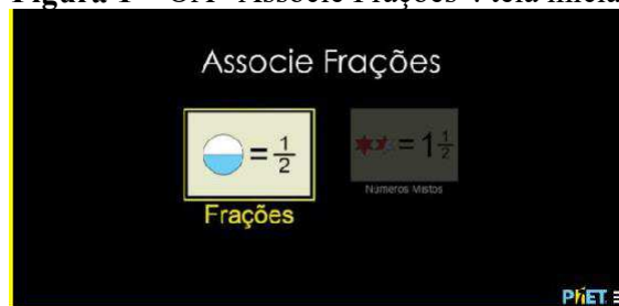
Figura 1 – OA “Associe Frações”: tela inicial