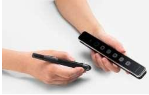
Figura 1 - Componentes da Lousa Interativa Portátil uBoard : caneta digital e receptor station