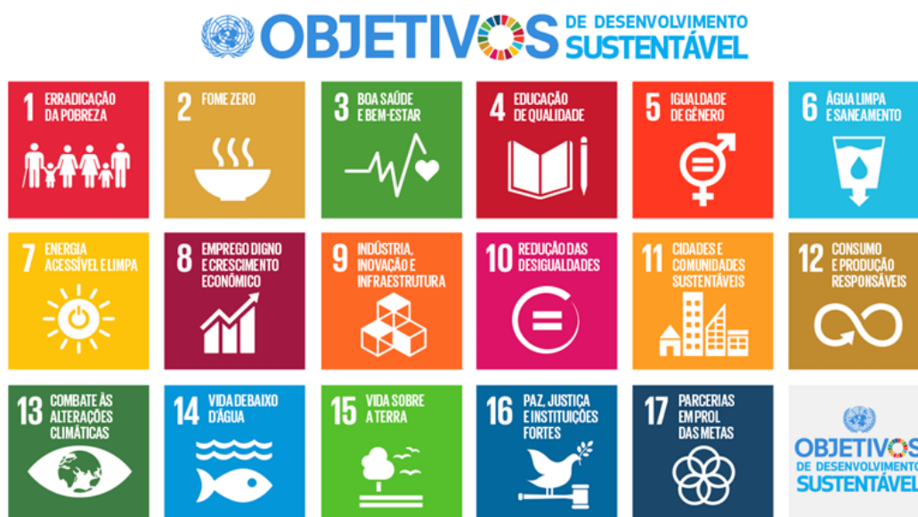
Figura 1 - Objetivos de Desenvolvimento Sustentável [ODS]