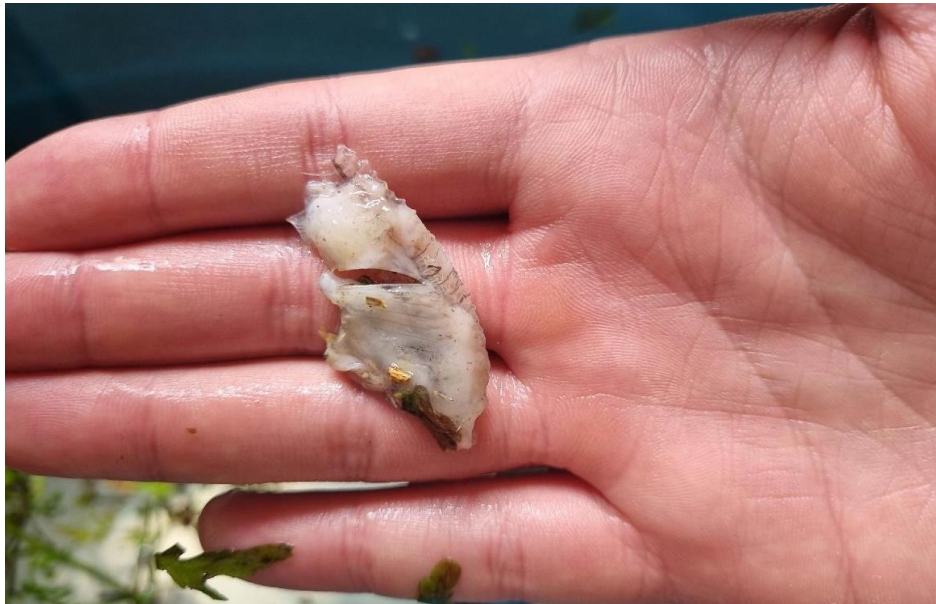
Figura 11 - Evidência de predação de um indivíduo da espécie A. lacustris , observa-se sinais de predação

enriquecidos e monitoramento visual automatizado, para aprofundar o conhecimento sobre as interações predador-presa. Também foi observado que M. eques apresenta uma habilidade de ocupação espacial, exibindo comportamento de fuga e dispersão mais rápida diante da presença do predador ( H. malabaricus ). Essa característica contribui para seu sucesso como espécie invasora, visto que aumenta sua eficiência em escapar da predação e favorece a sua dispersão em diferentes ambientes.