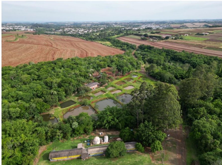
Figura 1 – Localização do Laboratório de Ecologia Aquática e Conservação de Espécies Nativas (LEACEN), no qual foi realizado o experimento ex situ

O experimento foi realizado de acordo com as normas do Projeto de Pesquisa e Desenvolvimento P&D-0387-0117/2017 no Laboratório de Ecologia Aquática e Conservação de Espécies Nativas da Universidade Estadual de Londrina (LEACEN/UEL), localizado nas coordenadas 23°20'02.8"S e 51°12'30.6"W (figura 1). Esse local possui infraestrutura adequada para a realização de experimentos com organismos aquáticos.