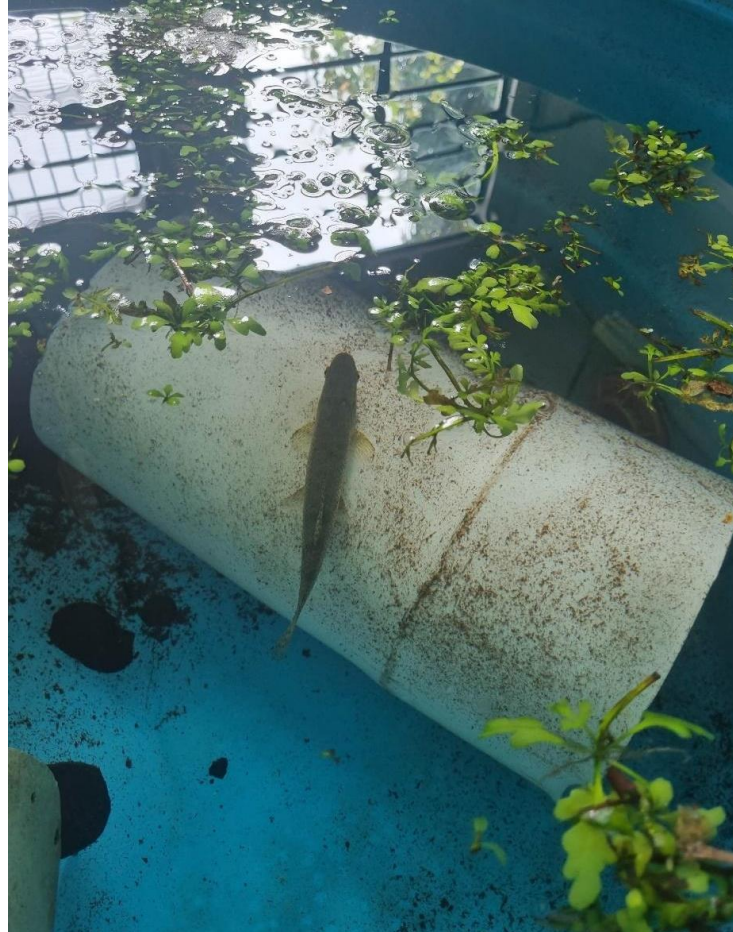
Figura 10 – Visualização de um indivíduo da espécie H. malabaricus próximo à superfície em um dia com ondas de calor intensas