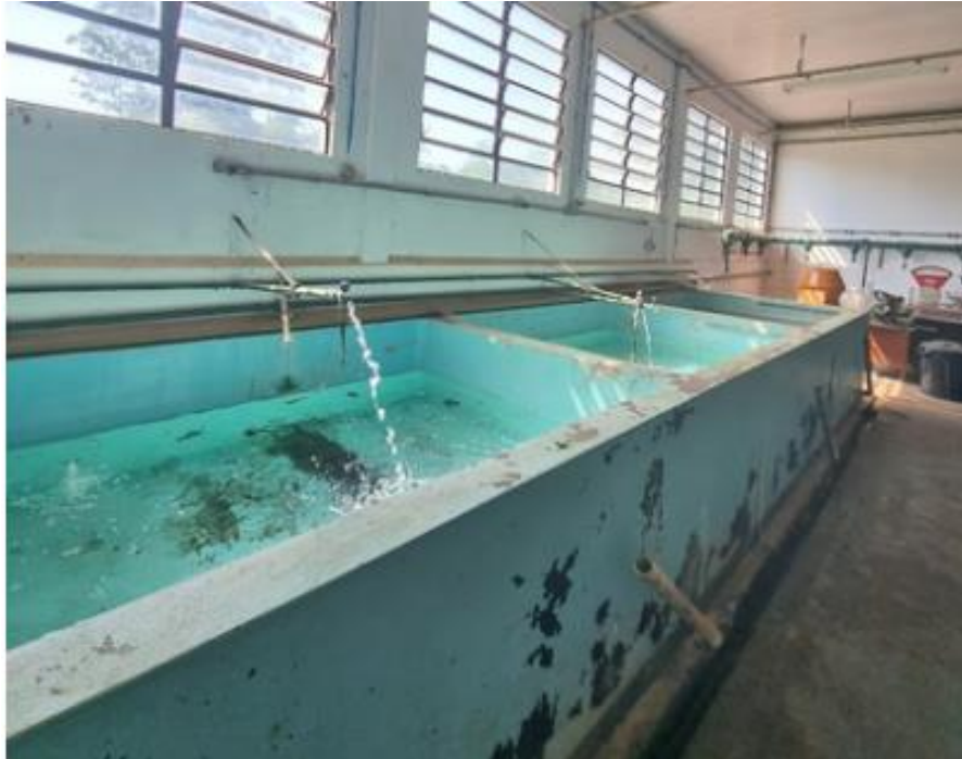
Figura 7 – Tanque 2 com capacidade máxima de 3.000 L antes da montagem do experimento ex situ