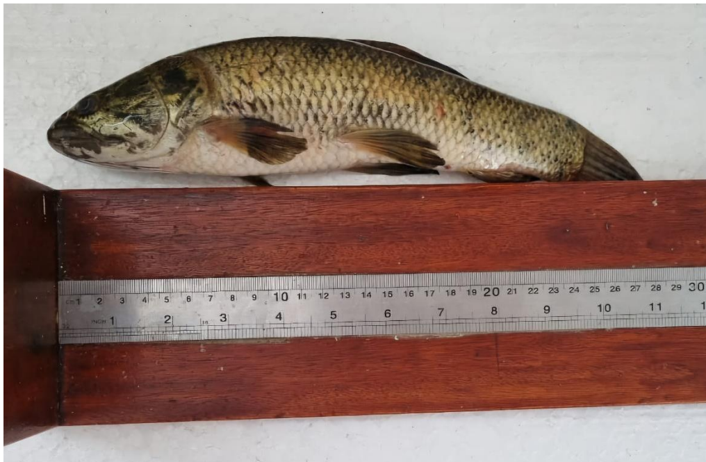
Figura 2 – Indivíduo adulto de H. malabaricus , com aproximadamente 27 cm de comprimento total, o exemplar foi medido com o auxílio de um ictiômetro

Os indivíduos de H. malabaricus (figura 2) foram capturados por redes de arrasto de malha e A. lacustris (figura 3) foram pegos pela tarrafa. Já os indivíduos de M. eques (figura 4) foram adquiridos comercialmente numa loja especializada em aquários no município de Londrina, Paraná.