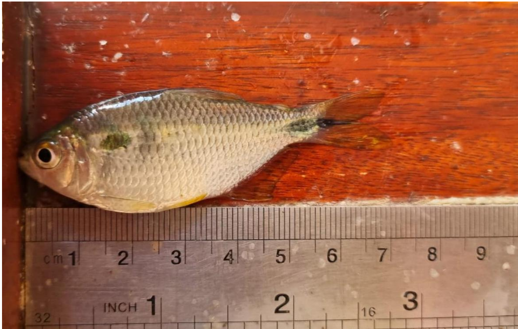
Figura 3 – Indivíduo adulto de A. lacustris , com aproximadamente 7 cm de comprimento total, o exemplar foi medido com o auxílio de um ictiômetro