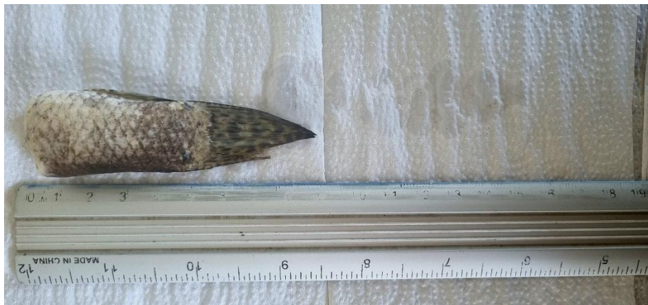
Figura 9 – Detecção de canibalismo entre os indivíduos da espécie H. malabaricus durante o período de aclimação, foi encontrado somente uma cauda com aproximadamente 9 cm de comprimento

desprende pouca energia ao capturar uma presa, faz sentido pensar que alguns fatores podem influenciar na escolha das presas, por exemplo, o tamanho e a disponibilidade de alimento (Takeuchi, 2008; Montenegro et al., 2013; França, 2022). Um evento marcante durante o período de aclimação foi o registro de canibalismo entre H. malabaricus (figura 9), possivelmente causado pela limitação de espaço e recursos nos tanques. Além disso, uma traíra morreu ao pular para fora do tanque também durante o período de aclimação, por meio de um rasgo na malha de proteção que posteriormente foi reforçada a sua costura. Conseqüentemente, o experimento que iniciou com 11 indivíduos de H. malabaricus passou a contar com a presença de 9 indivíduos até a finalização.