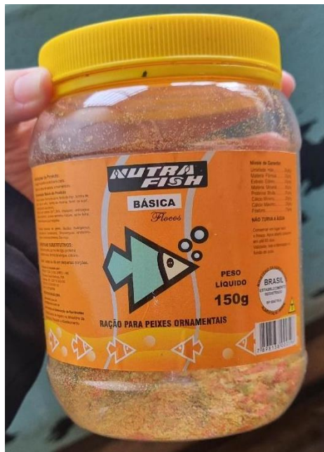
Figura 5 – Ração em flocos usada para alimentar diariamente as presas ( A. lacustris e M. eques )

Inicialmente, ocorreu um período de aclimatação, em que todas as três espécies de peixes foram mantidas em caixas d'água separadas. A espécie predadora ( H. malabaricus ) passou por um jejum inicial com duração de sete dias, após esse período foi iniciado a introdução das presas. As espécies A. lacustris e M. eques foram aclimatados durante trinta minutos e foram alimentados diariamente com a ração floculada Nutrafish (figura 5).