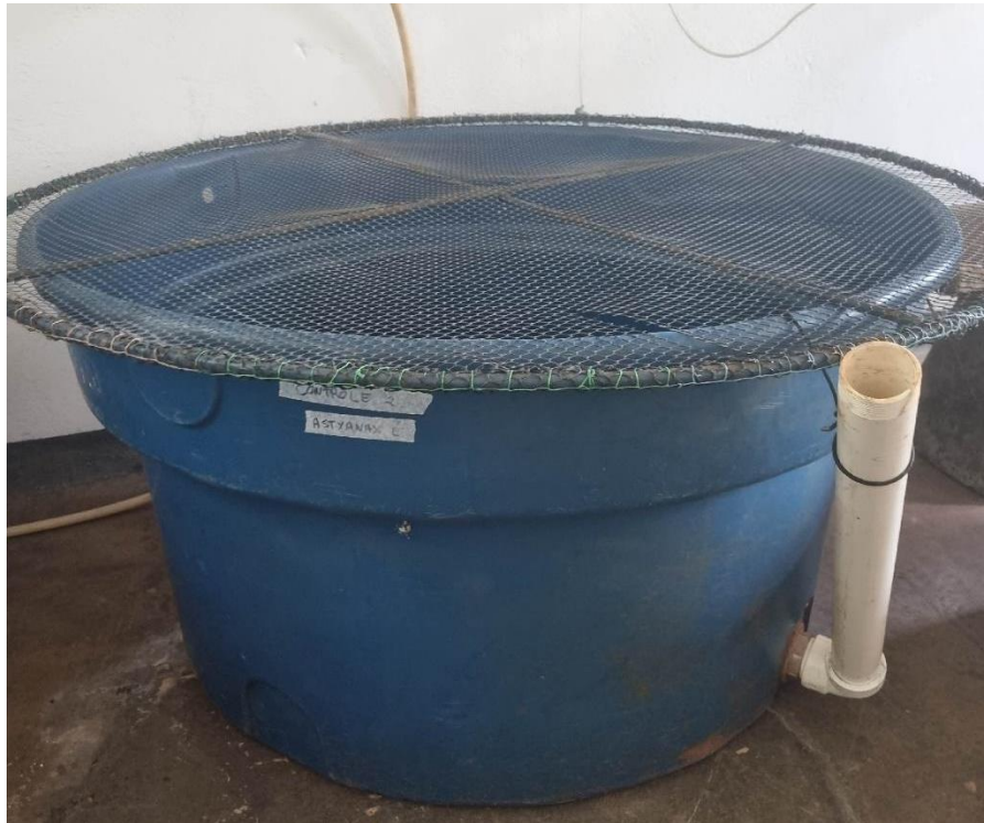
Figura 6 – Tanque 1 com capacidade máxima de 500 L antes da montagem do experimento ex situ

preparados com substratos semelhantes para ambas as unidades experimentais, incluindo troncos, tubos de PVC perfurados, tijolos de seis furos e vegetação para oferecer abrigos aos peixes. Além disso, também foram utilizadas malhas de ferros que ficaram sobre o tanque 1, com intuito de evitar a fuga dos peixes (figura 6). As bombas de água e oxigênio permaneceram ligadas continuamente para garantir a oxigenação adequada. Os parâmetros da qualidade da água, como pH, temperatura e oxigênio dissolvido, foram medidos duas vezes ao longo de todo o experimento.