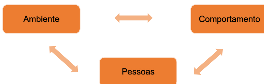
Figura 1 - Modelo do Determinismo Recíproco (Bandura, 1978).

Bandura (1977) propõe, em sua teoria, o modelo do determinismo recíproco entre os fatores pessoais, ambientais e comportamentais. O termo “determinismo” se refere à produção de efeitos de determinados fatores, porém não quer dizer que esses fatores sejam obrigatoriamente determinados por uma sequência prévia de causas, independente do indivíduo. O termo “recíproco” diz respeito à ação mútua entre fatores causais e não se refere à simetria de forças entre as influências bidirecionais. O funcionamento humano deve ser explicado pela relação entre esses três fatores que, mutuamente, subscrevem uma estrutura causal caracterizada pela relação de reciprocidade triádica (Zimmerman; Schunk, 2004).