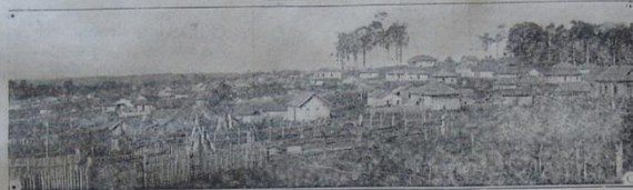
Uma vista parcial de Londrina, em Junho de 1934.