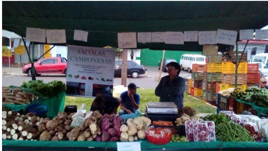
Figura 3 - Feira com exposição das sacolas ecológicas das mulheres do Assentamento Eli Vive