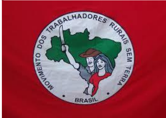
Figura 19 - Bandeira, símbolo oficial do MST