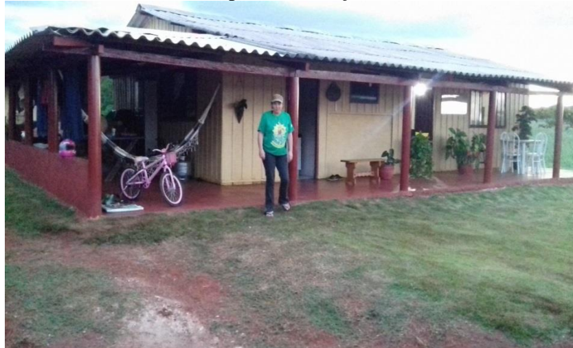
Figura 1 - Casa edificada em lote após a efetivação do assentamento Eli Vive