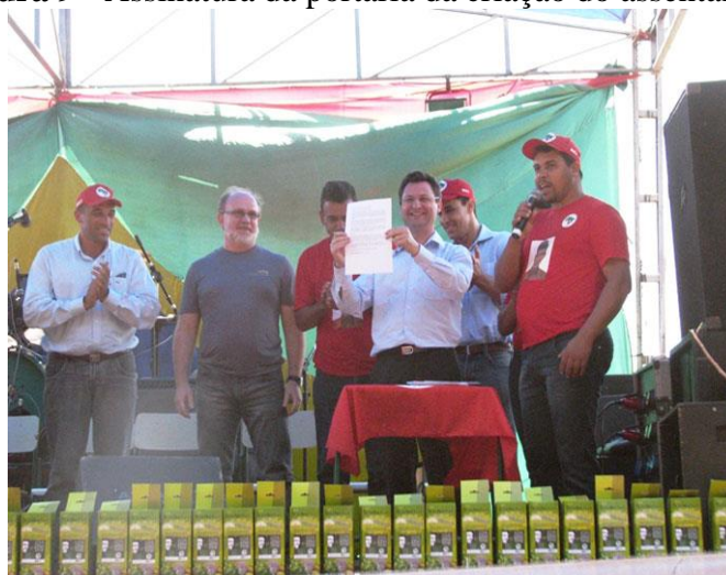
Figura 9 - Assinatura da portaria da criação do assentamento Eli Vive.