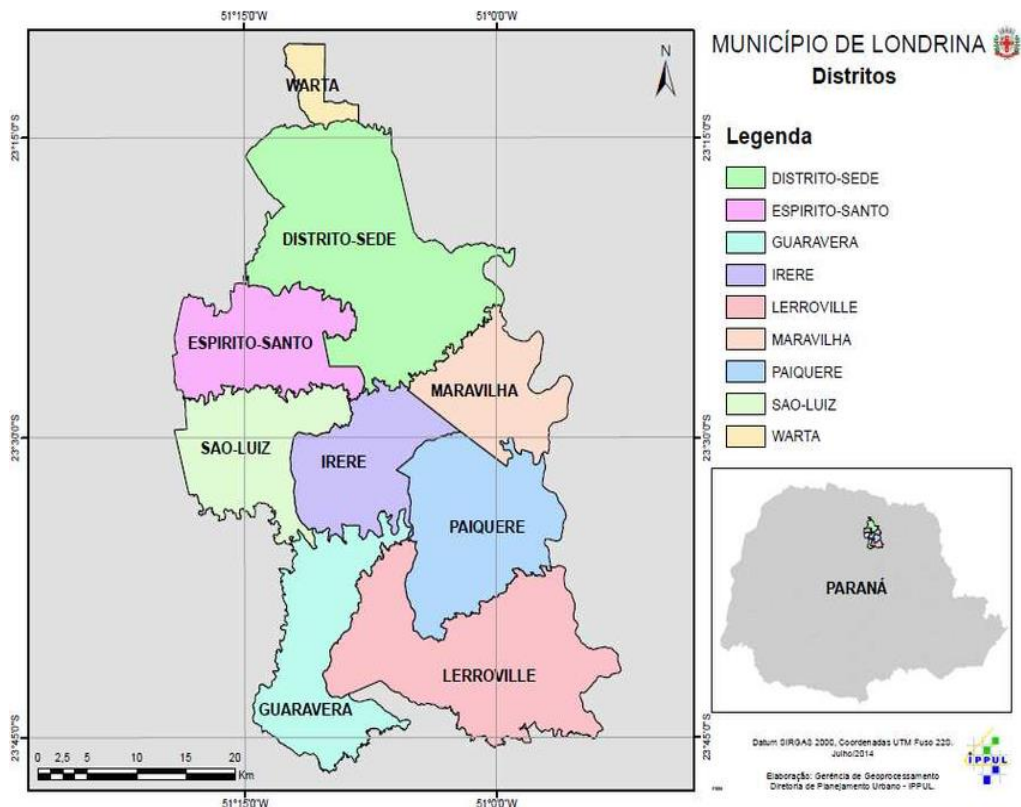
Figura 8 - Município de Londrina e seus distritos