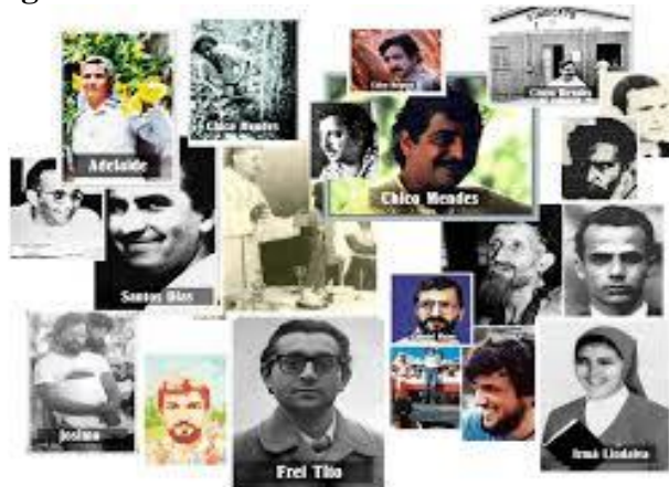
Figura 14 - Painel Mártires da Caminhada

Os conflitos ocorridos na antiga Fazenda Guairacá, no ano de 1991, quando 300 famílias ocupavam a terra como forma de pressão para a desapropriação da área para Reforma Agrária, permanecem na memória dos assentados, da mesma forma que muitos trabalhadores e trabalhadoras que morreram nessa luta em todo o Brasil e na América Latina e que, por essa razão, recebem o nome de mártires.