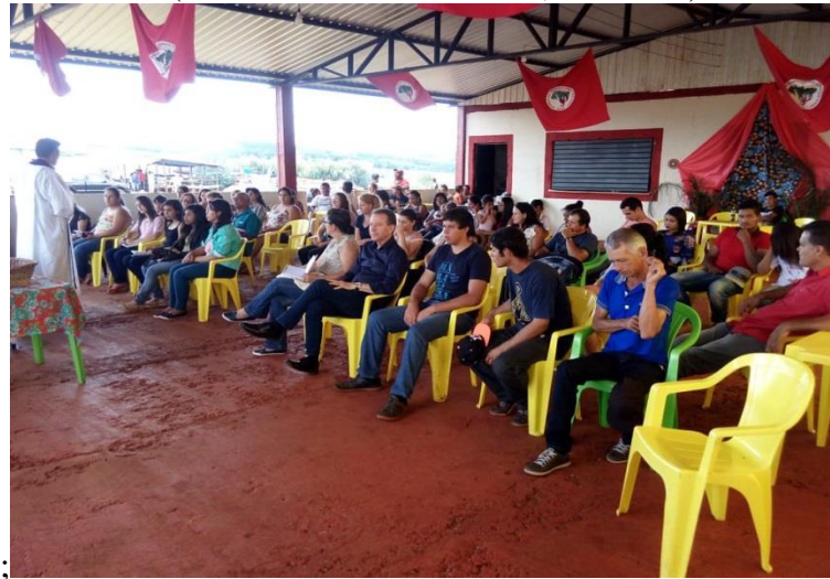
Figura 16 - Momento de espiritualidade durante a celebração da Festa da Batata Doce (Assentamento Eli Vive II, dez/2018)