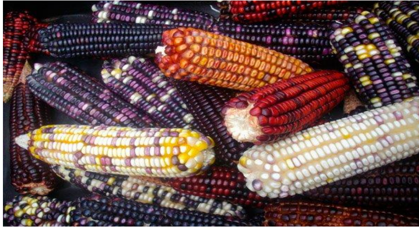
Figura 11 - Foto de semente crioulas produzidas no assentamento Eli Vive.