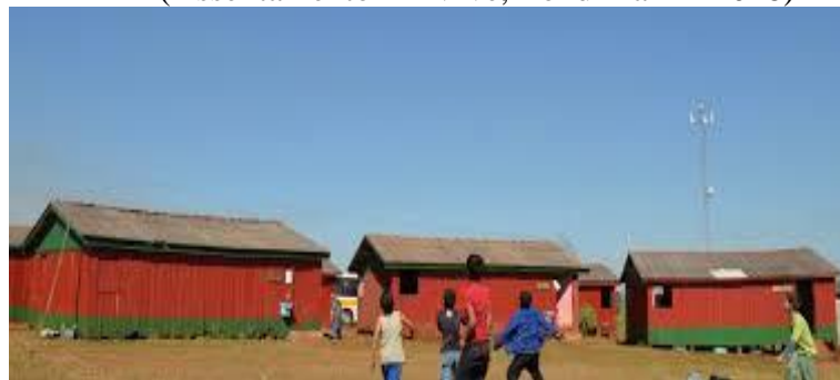
Figura 18 - Escola Maria Aparecida Rosignol Franciosi (Assentamento Eli Vive, Londrina-PR 2018)