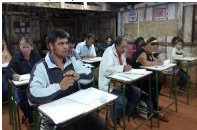
Figura 2 - Sala de educação para jovens e adultos (Escola itinerante Maria Aparecida Rosignol Franciosi – Assentamento Eli Vive I, 2017)

Fonte: Escola Itinerante Maria Aparecida Rosignol Franciosi (2017).