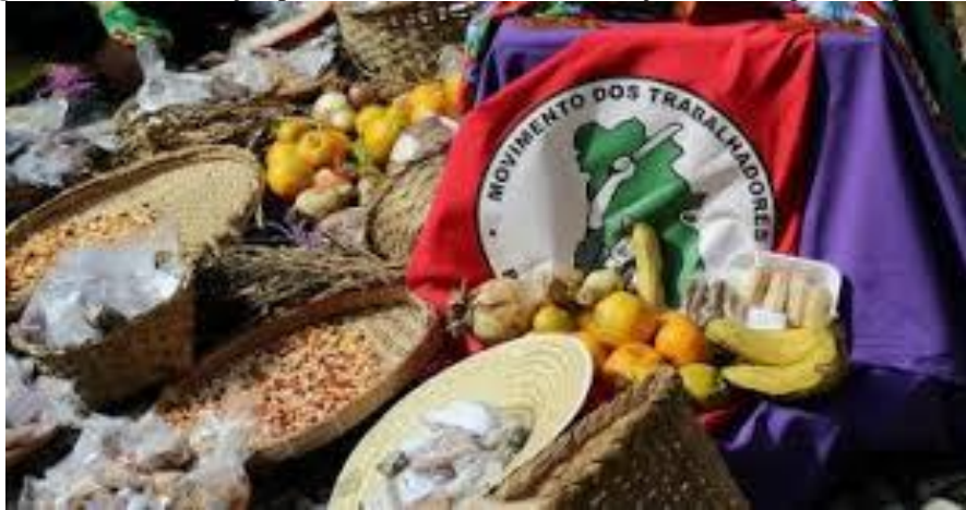
Figura 20 - Ambientação para mística do MST durante a jornada da agroecologia (2010)

diferentes projetos de história a partir de uma coletividade. Esse sonho é imorredouro, e como todo sonho ou utopia, de alguma forma, antecipa o futuro que virá (BOFF, 2018, p. 19).