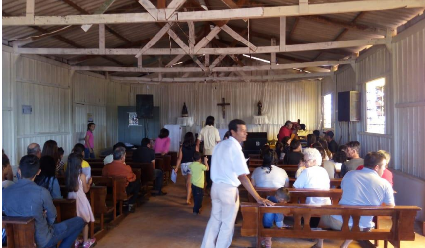
Figura 12 - Imagem interna da Igreja Católica no Assentamento Eli Vive II