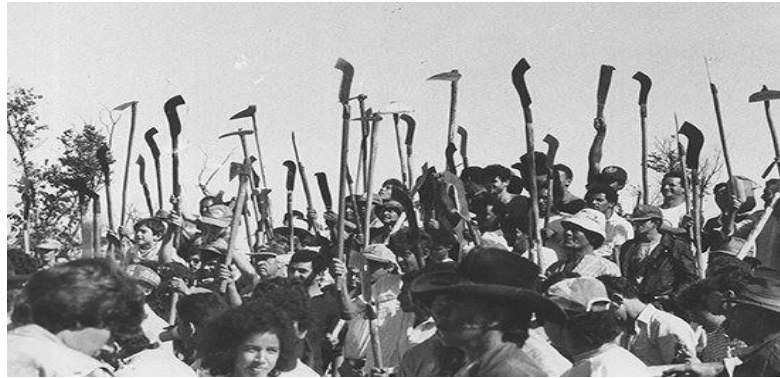
Figura 5 - Reunião das Ligas Camponesas no Nordeste