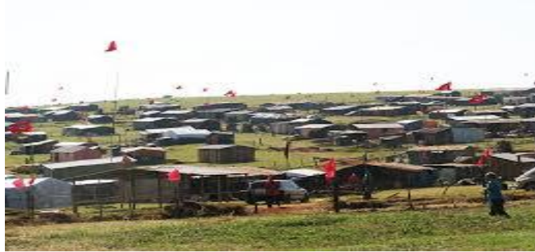
Figura 7 - Acampamento Eli Vive, Londrina-PR, 2011