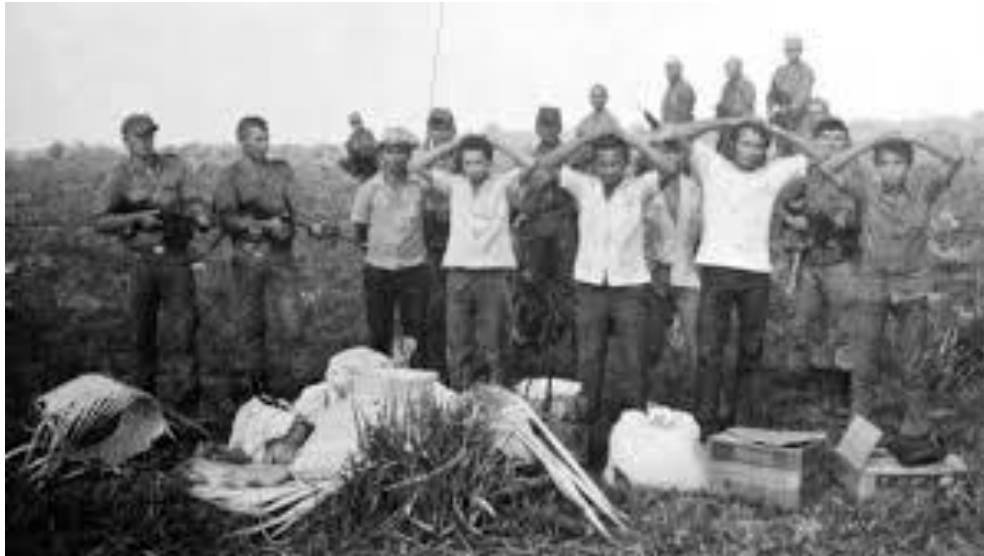
Figura 6 - Abordagem policial contra os camponeses no período da ditadura militar (1964-1985)