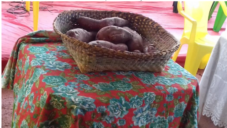
Figura 15 - Ornamentação do espaço de mística na festa da batata doce (Assentamento Eli Vive II, 3dez/2018).