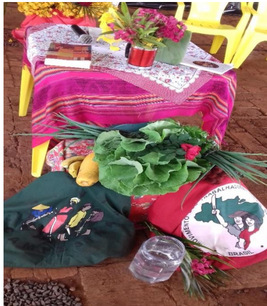
Figura 17 - Ornamentação do espaço preparado para a celebração dos 10 anos do assentamento Eli Vive (abril, 2019).