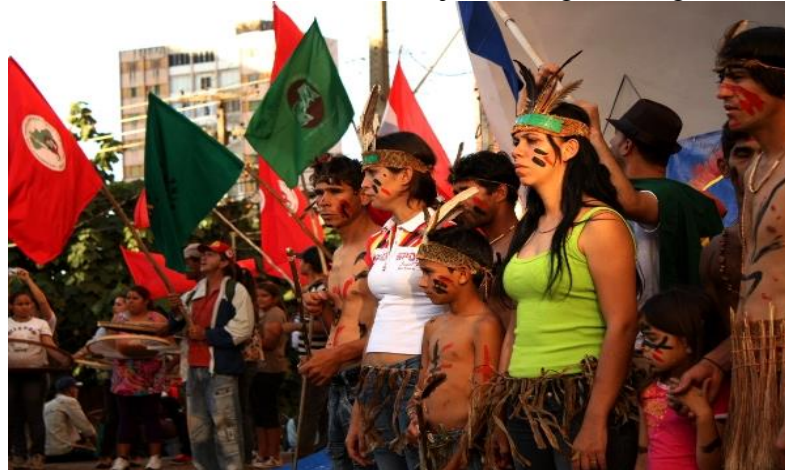
Figura 13 - Mística durante encerramento da 10ª jornada agroecológica – Londrina jul.2011.