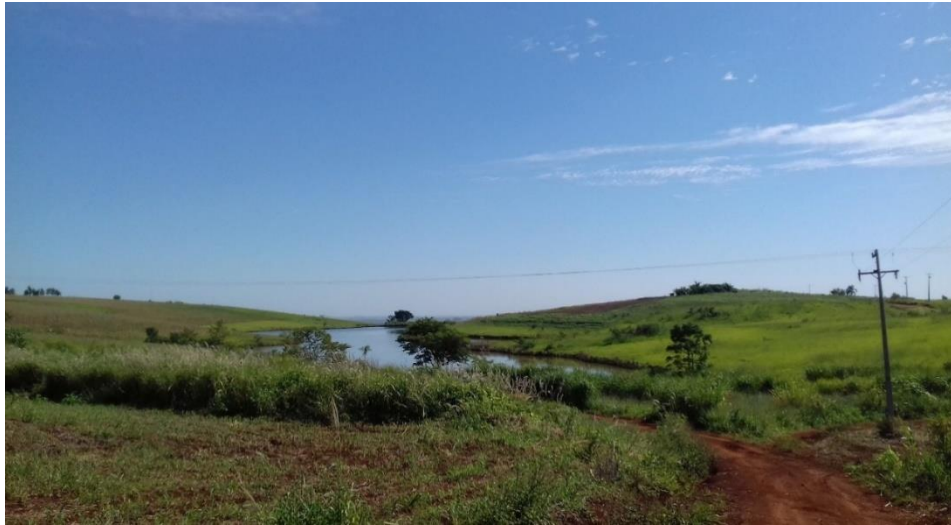
Figura 4 - Imagem do Assentamento Eli Vive