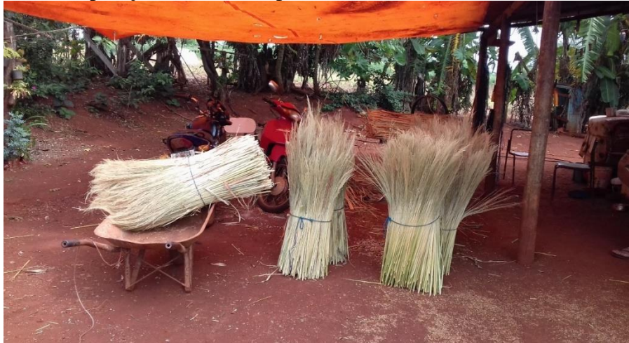
Figura 10 - Preparação da vassoura para ser comercializada (Assentamento Eli Vive).