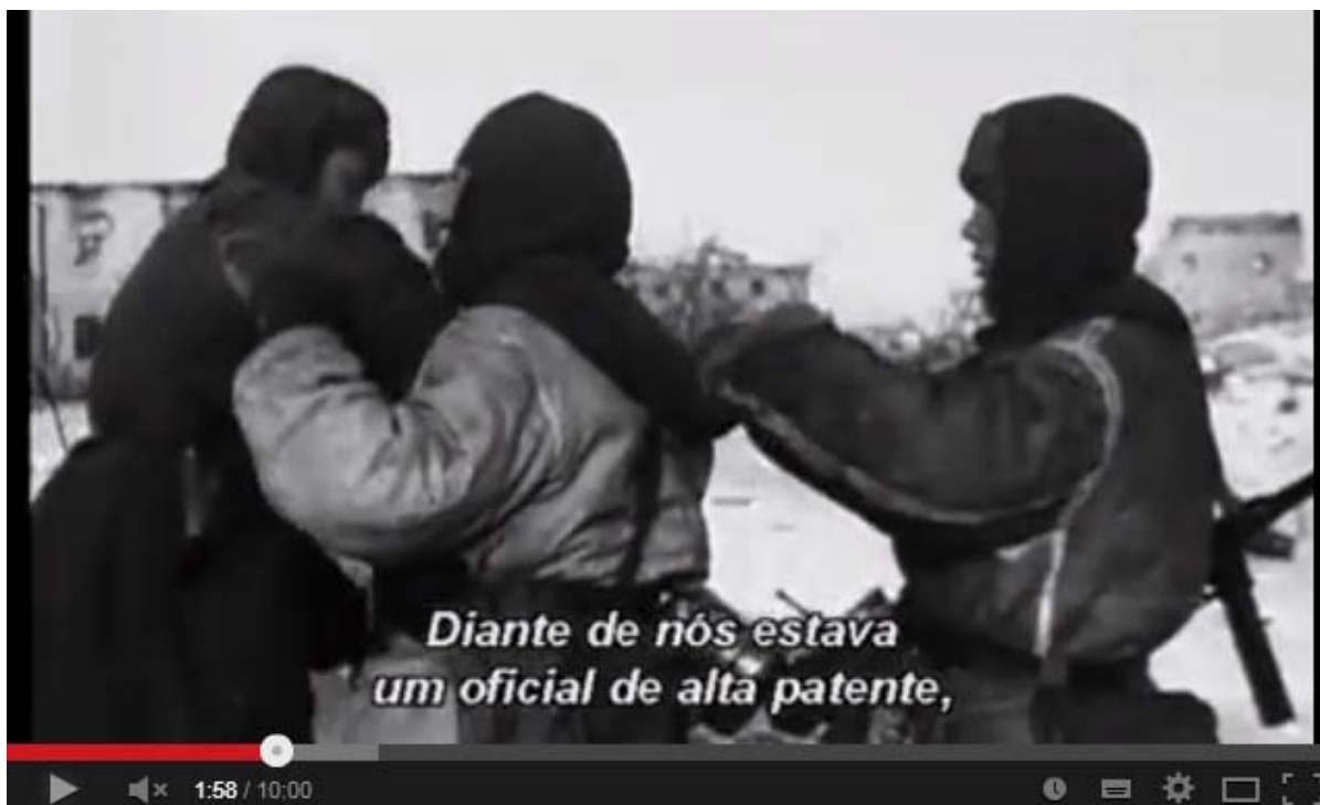
Prisioneiro alemão sendo revistado imagem da fonte.

Frente à condição de penúria, parte dos alemães entrevistados afirma que aceitavam o trabalho forçado, em busca de uma libertação que os fizesse retornar aos braços de seus familiares. O medo da morte e de um futuro assassinato em massa, também perturbava alguns. A morte até aquele momento viria em diferentes formas como temos observado, mas algumas gentilezas entre soviéticos e alemães desfazia aos poucos entre os prisioneiros a idéia de um futuro extermínio em massa. Hans Mroczinski presenciou um ocorrido que o fez crer, que a brutalidade a qual os alemães usaram com os soviéticos, não seria retribuída.