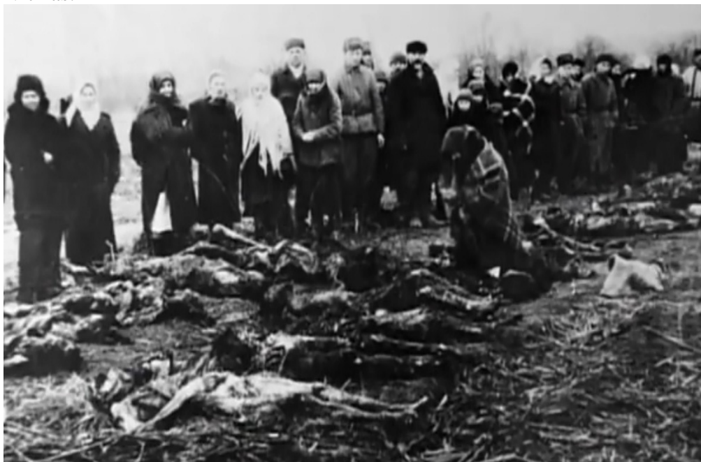
Figura 1- Local de fuzilamento. Nesta imagem podemos observar os corpos de algumas vítimas.

Em Stalingrad a violência só aumentava ao caminhar do conflito independente ao lado em que estava ela era presente. Muitos soldados alemães, por exemplo, que estavam no front não tinha conhecimento das atrocidades que ocorriam no interior. O conhecimento sobre os fatos veio de forma gradativa. Muitos foram testemunhas oculares, como uma unidade especial da 4 SS, que trancou noventa crianças judias em um porão nas imediações da cidade ucraniana de Belava Tserkov, sem água e nem pão o que chocou os moradores da região.