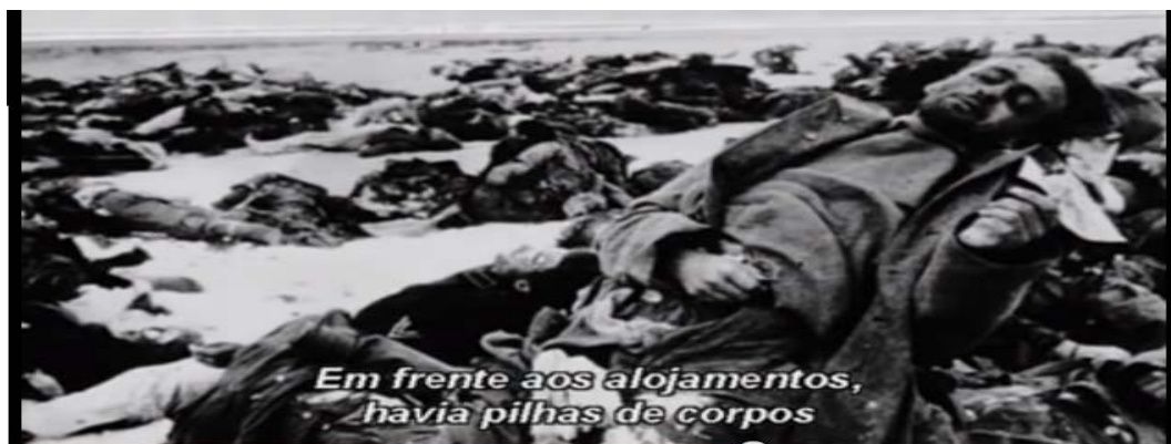
Corpos amontoados sobre Stalingrado imagem retirada da fonte.

Todas as mazelas somadas a fome que os alemães enfrentavam nas ruínas de Stalingrado antes de seu aprisionamento, estiveram presente nos campos de prisioneiro com um grau mais elevado, nos primeiros meses. A fome teve certa importância na causa das mortes nos campos de prisioneiros, ao lado da tifo, 155 essa sim responsável em grande parte pelo número de mortos. Fome que fez com que os alemães perdessem qualquer noção de civilidade, e os levasse agora a praticar o canibalismo, mas esse ato não só servia para sanar a fome daqueles pobres soldados de Hitler, que foram relegados em Stalingrado a própria sorte.