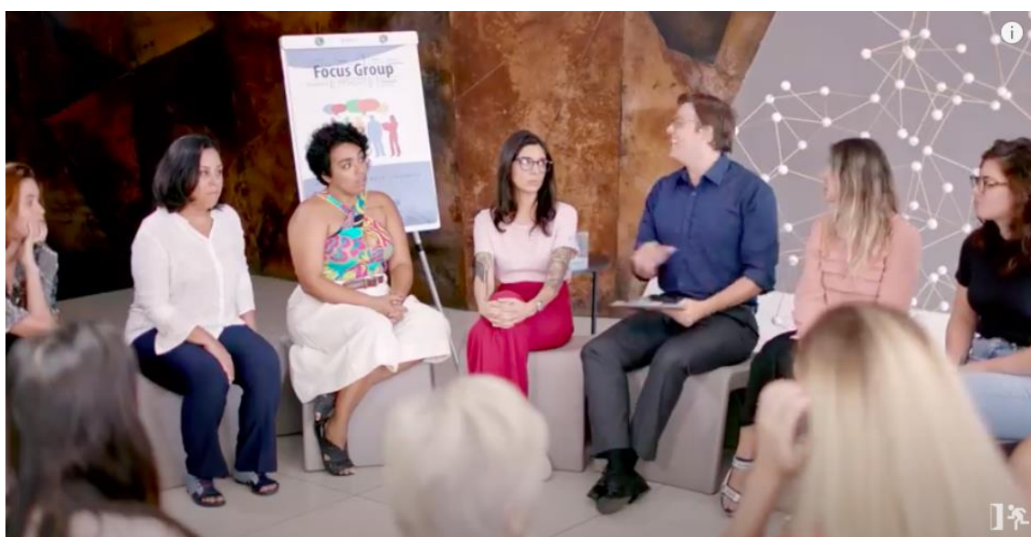
Figura 26 – Entrevistador com o peito estufado e visto como centro da roda de mulheres