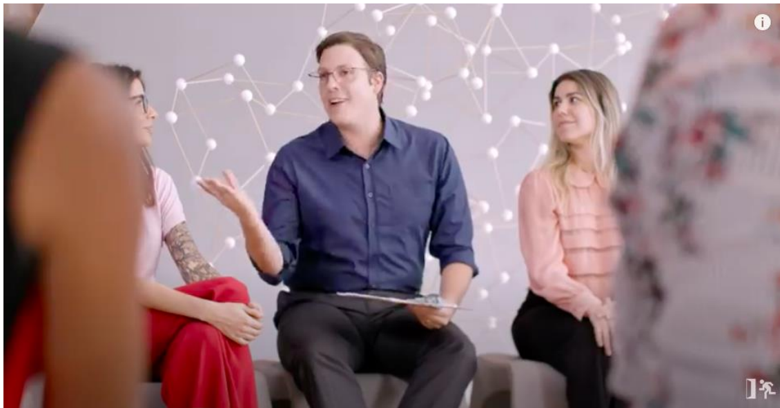
Figura 15 – Duas mulheres olhando satisfeitas com a fala do entrevistador