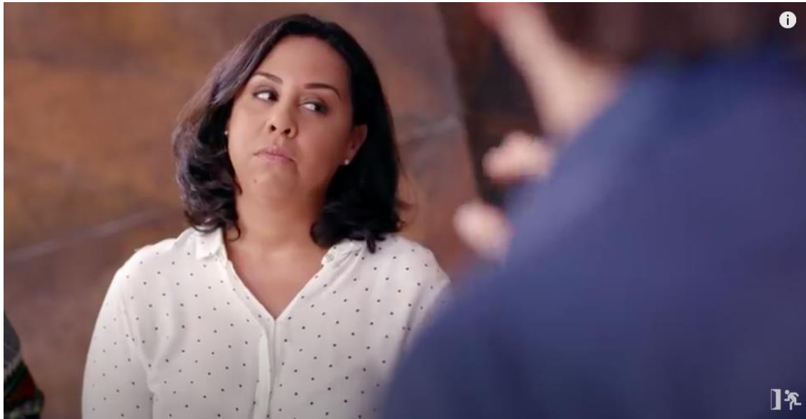
Figura 23 – Olhar destinado a colega do lado sobre a fala em relação ao peito caído