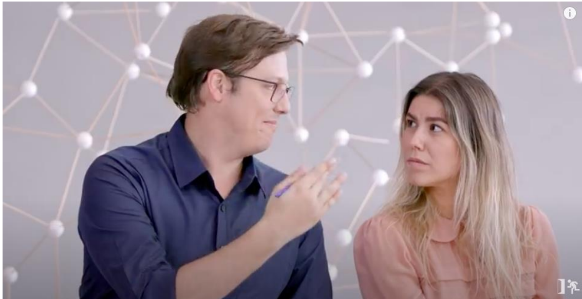
Figura 19 – Olhar afetivo para as mulheres como se falasse com crianças