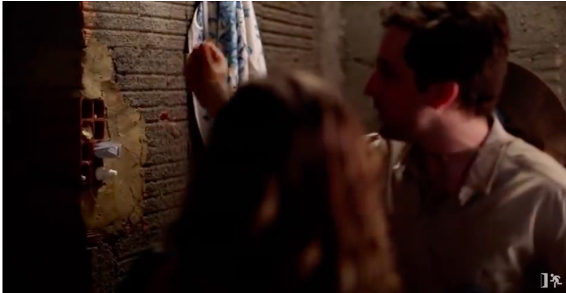
Figura 8 – Casa sem revestimento com o tijolo servindo para guardar objetos