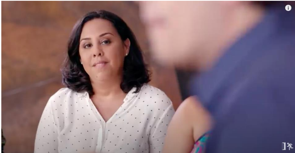
Figura 14 – Olhar e sorriso da personagem Caroline