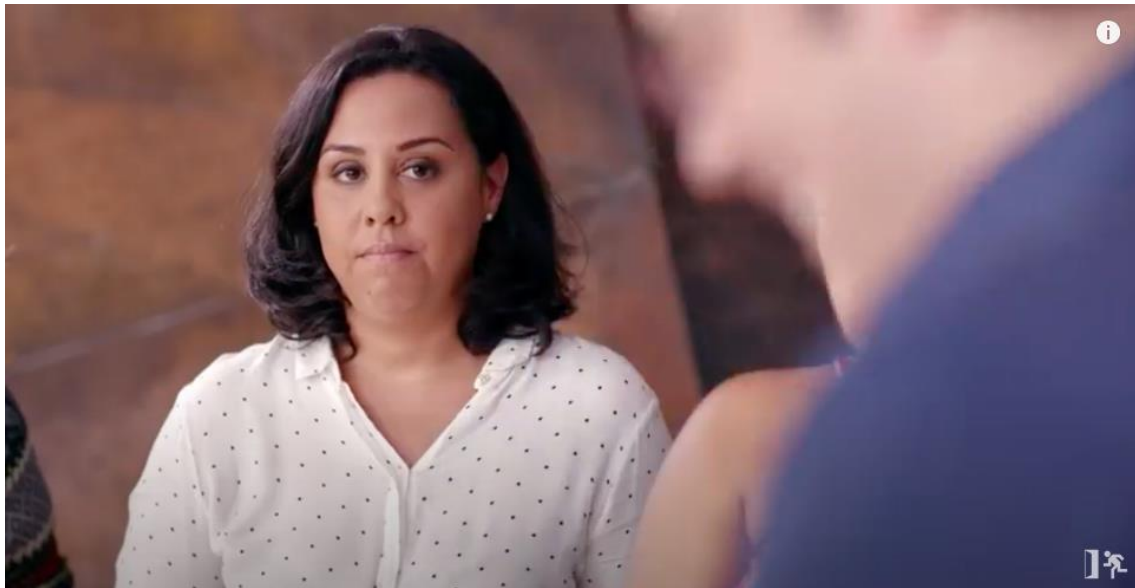
Figura 20 – Olhar direcionado ao entrevistador