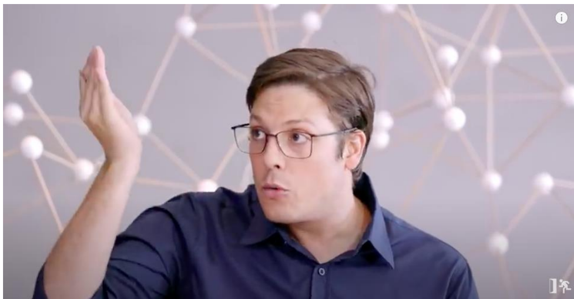
Figura 18 – Olhar direcionado incisivo às mulheres explicando