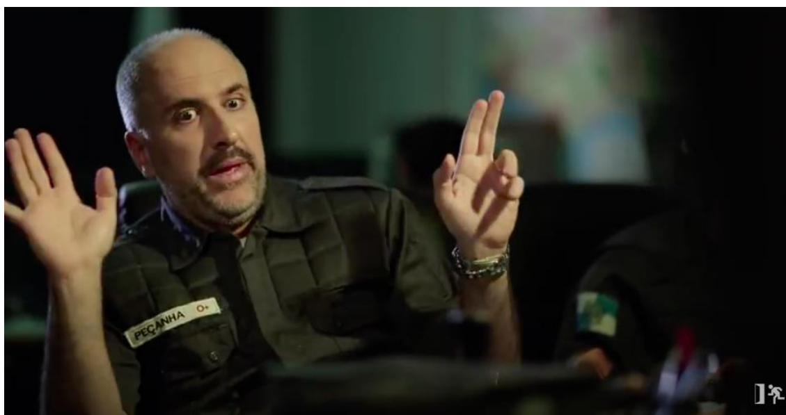
Figura 1 – Policial encena as aspas com as mãos