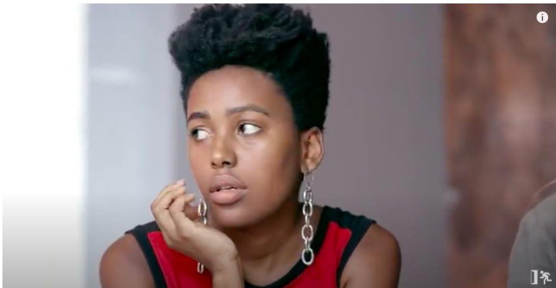
Figura 21 – Olhos virados desdenhando o entrevistador