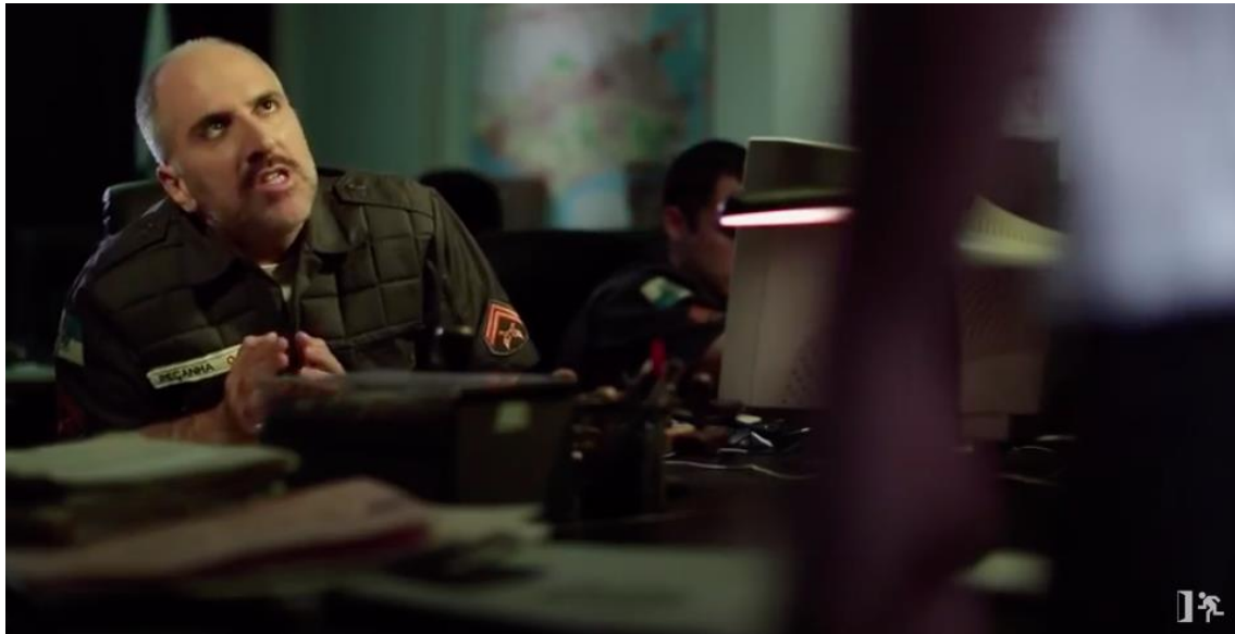
Figura 2 – Olhar do agente Peçanha para o depoente