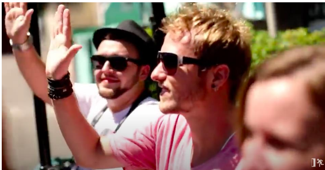
Figura 5 – Turistas acenando