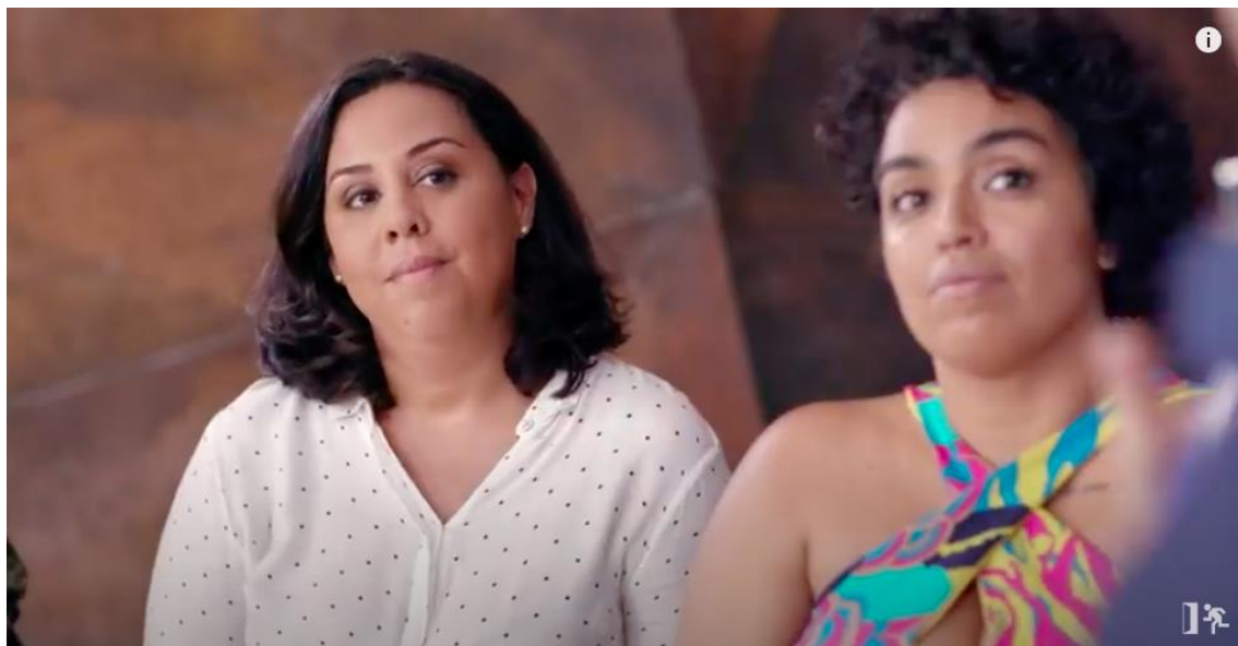
Figura 13 – Olhar das mulheres atentas ao discurso do pesquisador