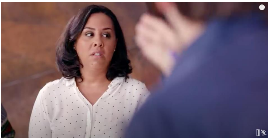
Figura 24 – Olhar destinado a fala sobre a barriga