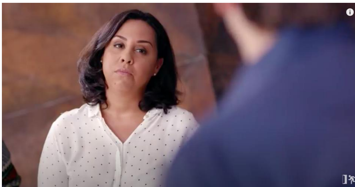
Figura 22 – Olhar destinado a fala sobre o rosto