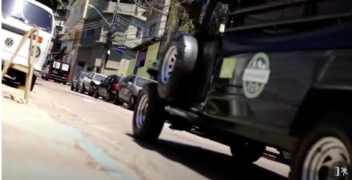
Figura 6 – Carro subindo a ladeira da favela