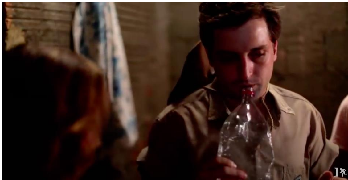
Figura 9 – Guia cheirando a água da garrafa em referência ao ato de cheirar o vinho