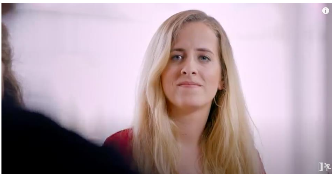
Figura 16 – Personagem feminina loira atenta e contente com a fala do entrevistador