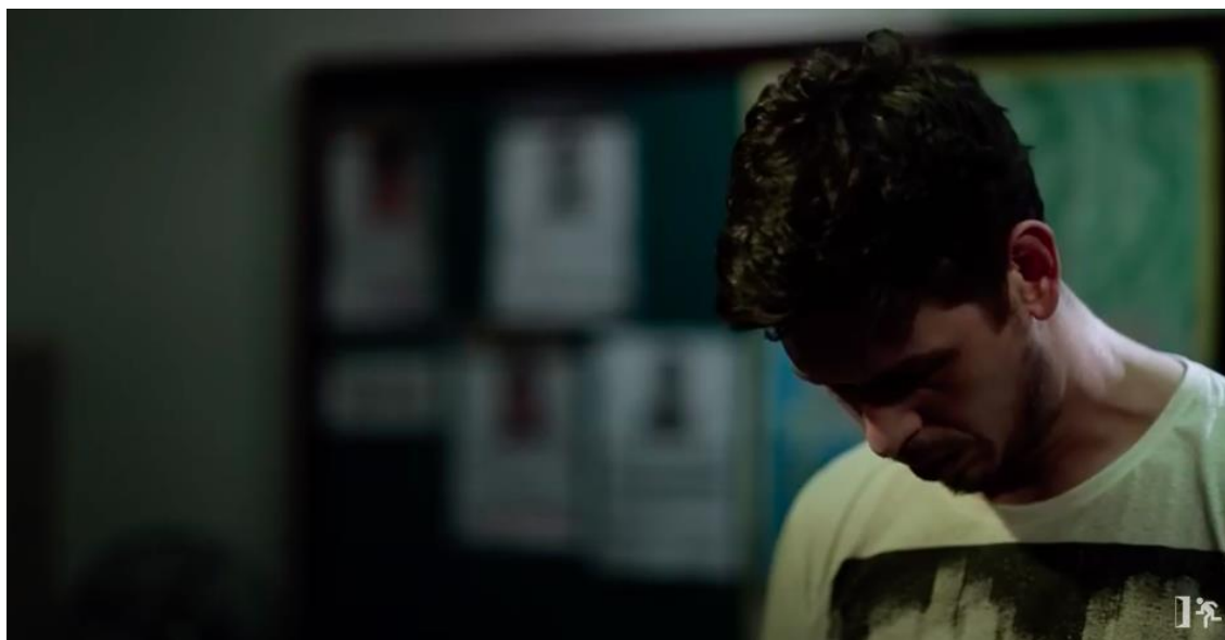
Figura 3 – Vítima do assalto cabisbaixa em posição de obediência e respeito