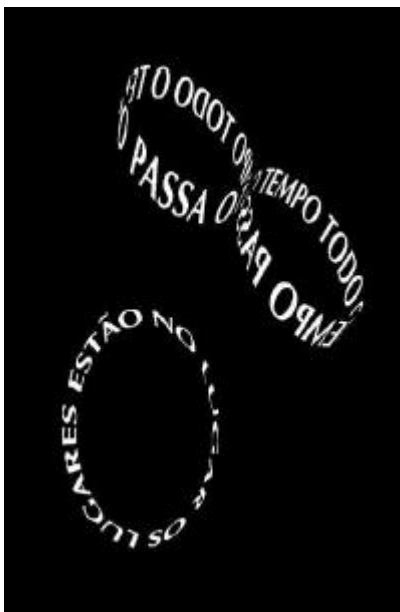
Figura 19 – Poema

O poema é composto por dois versos em formato de círculos que se movem incessantemente na tela durante 52 segundos, enquanto a voz de Arnaldo Antunes repete 45 vezes o vocábulo-título armazém , acompanhado pela guitarra de Arto Lindsay e sonoplastia de Peter Price composta por barulhos de bambus, pratos e copos. É justamente o elemento repetição que mais aproxima este trabalho da filosofia zen.