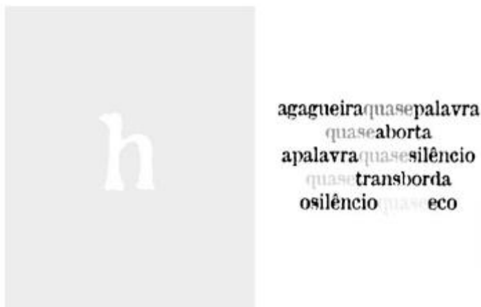
Figura 14 – (ANTUNES, 2005, p.45).

A oralização feita por Antunes, e disponível no CD que acompanha o livro, expressa de forma muito verossímil a experiência visual, em que o vocábulo “quase” gradualmente desaparece, e o “agá” gagueja, quase silencia ou quase ecoa no poema.