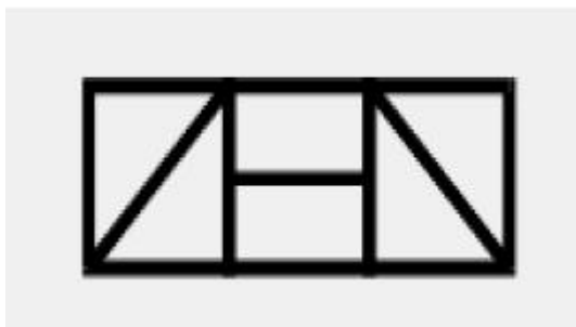
Figura 18 – Poema

O poema Zen funciona como uma espécie de mini-tratado do zen-budismo. Para o crítico e poeta Philadelpho Menezes: