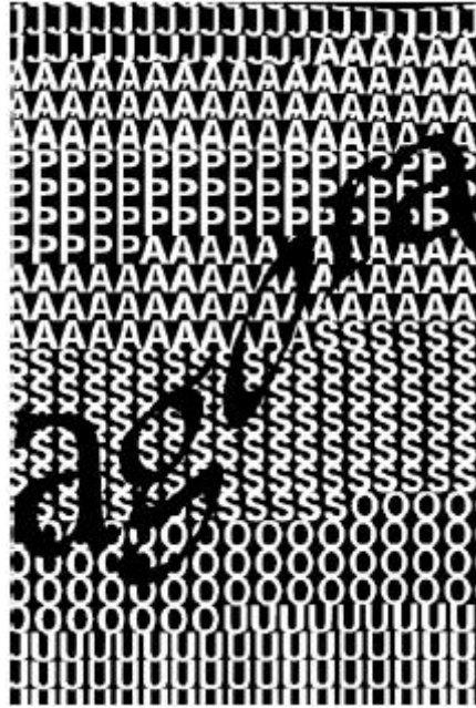
Figura 16 – Poema

O primeiro elemento que podemos destacar neste poema visual é a questão da crise do verso institucionalizada por Mallarmé que propõe uma não linearidade de leitura textual a partir da disposição das palavras, como já vimos anteriormente. Em Agora , Antunes problematiza a recepção do leitor, ao inserir o “já passou” na vertical e a palavra “agora” sobrepondo o primeiro enunciado, produzindo um efeito de tridimensionalidade no poema. Esta corporificação da palavra, transformando-a em ícone, dá ao poema uma idéia de movimento tanto do aspecto visual quanto sonoro. Notamos aí um diálogo de Antunes com a tradição concretista, mais especificamente com o poema Velocidade , de Ronaldo Azeredo: