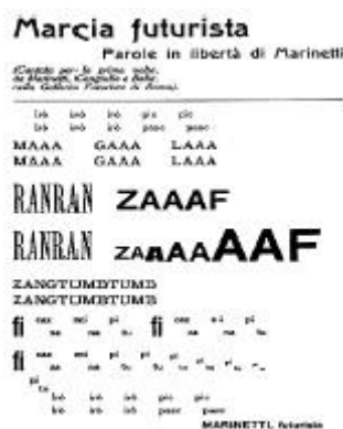
Figura 3 – Marcia Futurista - Marinetti

É também sobre a linguagem que atuam as forças mágicas do expressionismo, a geometrização do cubismo, a busca pela língua universal , ou