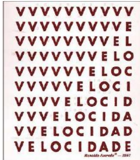
Figura 17 – Poema

Os dois poemas se assemelham quanto às estruturas, sendo que a sugestão de movimento é dada pela composição tipológica de ambos. Nos dois casos, o conceito de velocidade está sendo discutido: a velocidade enquanto marca de uma sociedade moderna e industrializada.