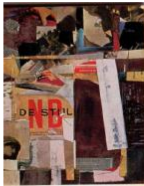
Figura 2 – NB – Kurt Schwitters

de uma ruptura completa com o passado e uma crítica acirrada aos modelos artísticos do presente: Futurismo, Dadaísmo e Surrealismo; seja visualizando na destruição uma possibilidade de construção de uma nova realidade: Cubismo e Expressionismo. Em ambos os casos, o que devemos notar é que as ações dos movimentos vanguardistas são realizadas sobre a linguagem. No Futurismo e Dadaísmo temos a tentativa de uma destruição e pulverização da linguagem, buscando uma provável eliminação da palavra, o que é possível verificar nos diversos poemas sonoros ou fonéticos de Hugo Ball, ou ainda nas colagens de Kurt Schwitters e Filippo Tommaso Marinetti, como podemos ver respectivamente nos exemplos abaixo: