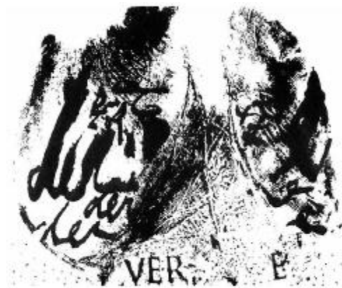
Figura 13 – (ANTUNES, 1990).

Já no terreno gráfico, a simultaneidade ocorre de forma mais explícita em vários trabalhos de Arnaldo Antunes, como no poema Derme/Verme do livro Tudos , de 1990: