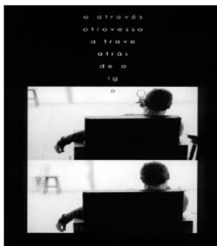
Figura 7 – (ANTUNES, 2006, p.196).