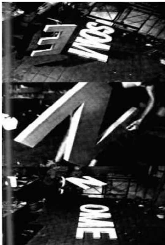
Figura 15 – Poema

Em 93, Antunes revisita o poema, que ganha o seguinte formato impresso em livro: